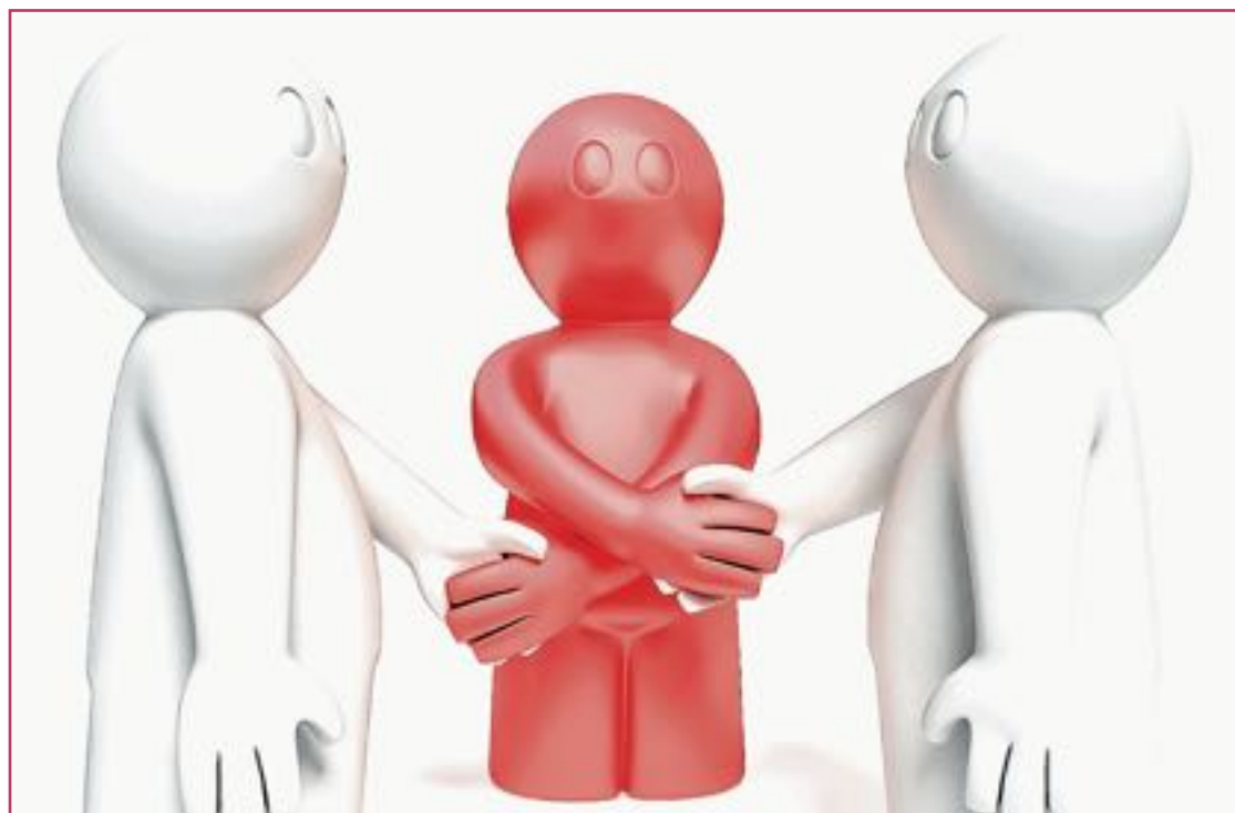
Tanto el Arbitraje como la Mediación deberían de tener un punto de vista jurisdiccional.

Tanto el Arbitraje, como la Mediación, deberían de tener un punto de vista jurisdiccional,