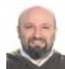
Christian Alain CREATIVIDAD Y WEB