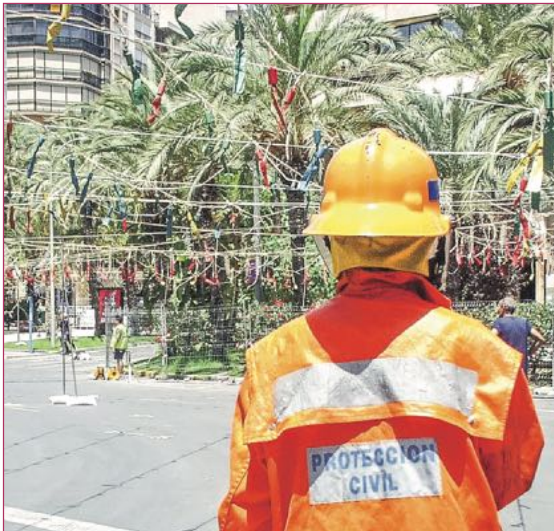
Tutelaje técnico de los voluntarios de protección civil.

«La fase de anticipación de análisis de riesgos lo que hace es unir ciencia y emergencia»