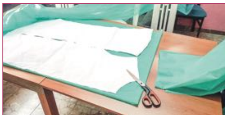
Las batas también han constituido un elemento importante de protección.

vimiento para fabricar y ofrecer sus talleres al servicio solidario de la confección de este material de protección.