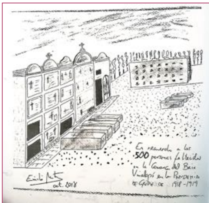
Dibujo de Emilio Martínez conmemorando los fallecidos en Crevillente por la gripe española de 1918.

Así ocurrió en 1804, cuando el ejército tuvo que organizar todo un cordón sanitario alrededor de la ciudad, para que no se extendiera la epidemia de fiebre amarilla, e incluso la Armada hundió a cañonazos varios barcos que traían sospechosas mercancías de contrabando. En aquella epidemia fue necesario incluso que los reclusos arrimasen el hombro para convertirse en improvisados enfermeros que ayudaran a los médicos.