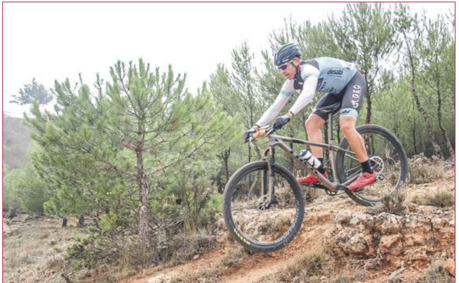
Donde mejor se desenvuelve es en los maratones de hasta cien kilómetros.

Ha sido un primer año excelente porque hemos conseguido más de cincuenta pódiums, consiguiendo un campeonato de España en maratón y otro en ultramaratón. A nivel personal