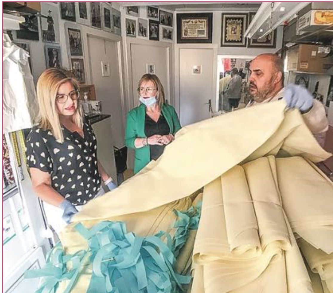
Algunos diseñadores locales han fabricado batas de protección frente al coronavirus.

En este sentido, un ejército formado por aparadoras, modistas, artesanos, amas de casa, diseñadores de calzado y de trajes para las fiestas de Moros y Cristianos, se pusieron en mo-