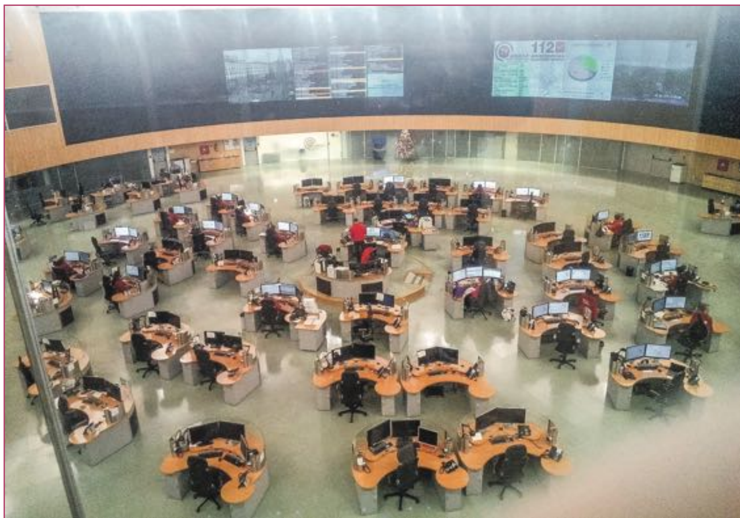
Centro de coordinación operativa 112.

«Hace tiempo que muchos pensamos que era necesario desarrollar unas directrices frente a riesgos biológicos»