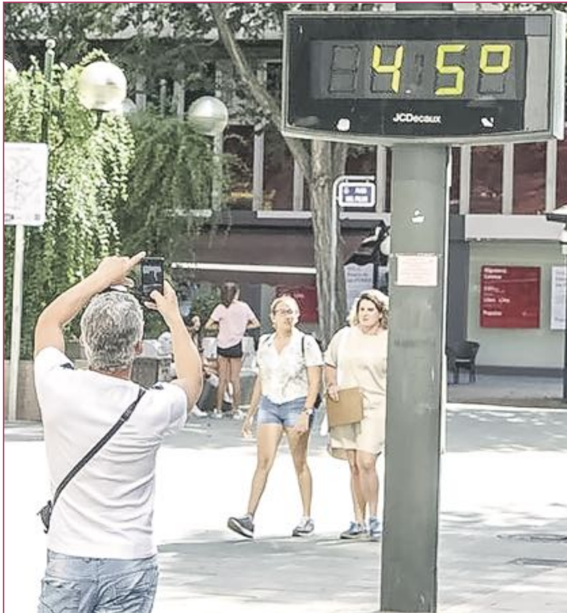
Los científicos esperan que el calor del verano merme la capacidad del COVID-19 como ya ha ocurrido con otros coronavirus.

De momento tampoco se ha descubierto ningún medicamento específico que trate el coronavirus o que disminuya nuestras posibilidades de contraerlo. De hecho en los hospitales se están utilizando