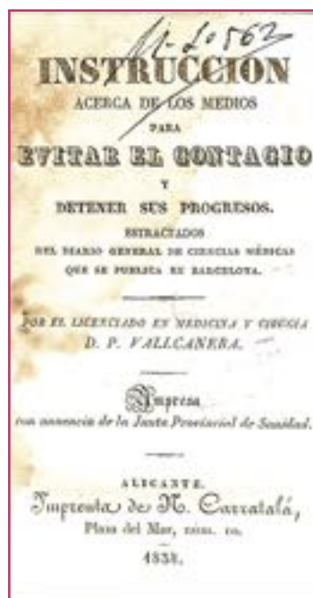
Instrucciones para evitar los contagios de fiebre amarilla en Alicante (1834).

Durante la peste bubónica de 1648 huyeron de Orihuela hasta los enterradores