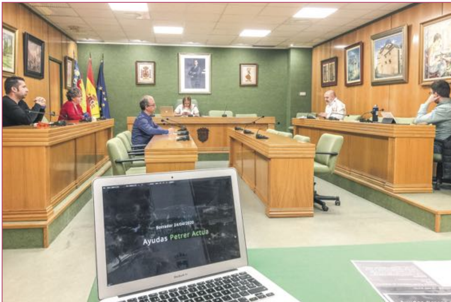
El pleno de abril se celebró telemáticamente.

El proyecto de remodelación de la piscina se pospone hasta que pase la crisis por el coronavirus