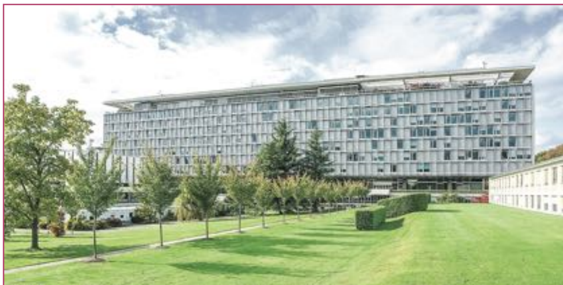
La sede central de la Organización Mundial de la Salud está ubicada en Ginebra.