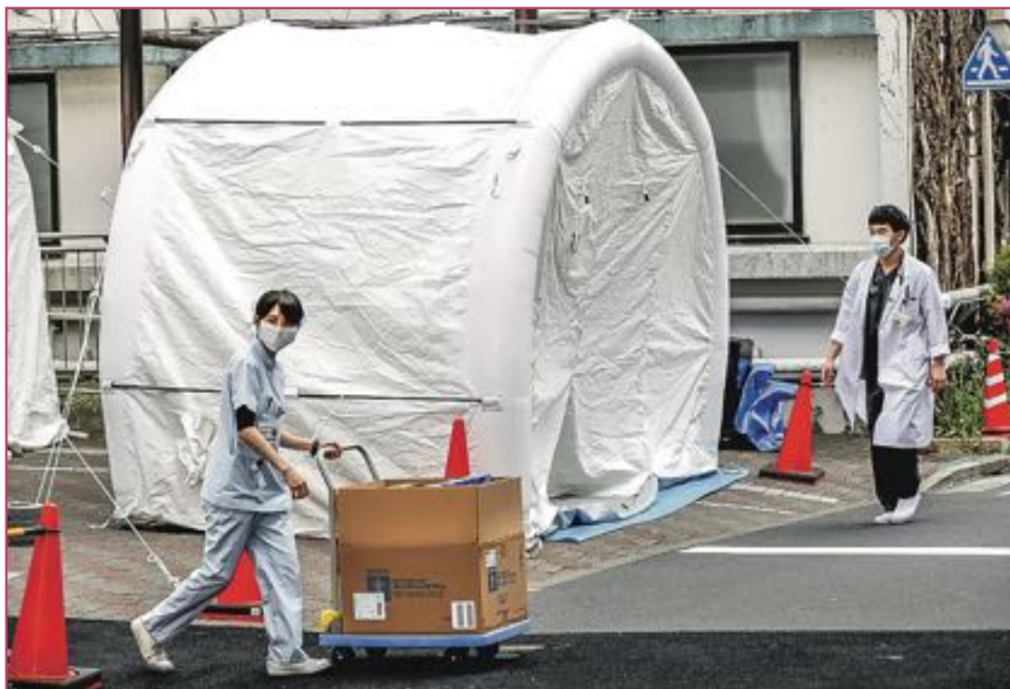
Corea del Sur ha habilitado laboratorios por los barrios y pueblos para que cualquiera pueda hacerse un test.

Con esta estrategia Corea ha logrado evitar el confinamiento total de su población. "Ha habido algunos problemas, como