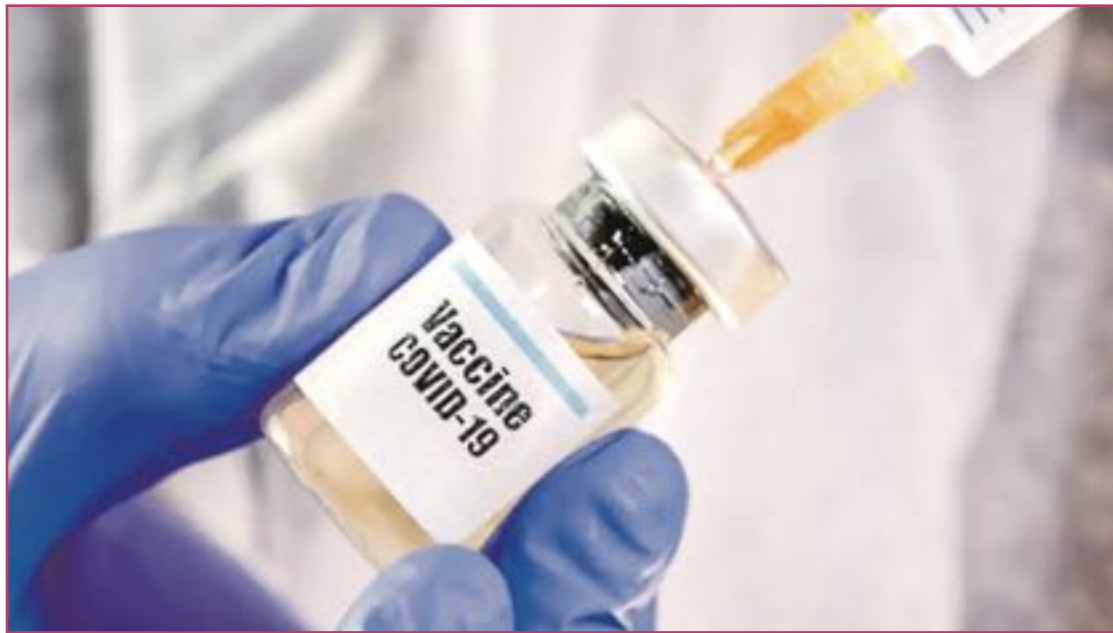
Varios laboratorios están haciendo ya ensayos clínicos de prototipos de vacuna con personas humanas, pero todavía en fases muy iniciales.

Según se precisa en la información oficial compartida por el organismo, las mascarillas tan solo son eficaces si se combinan