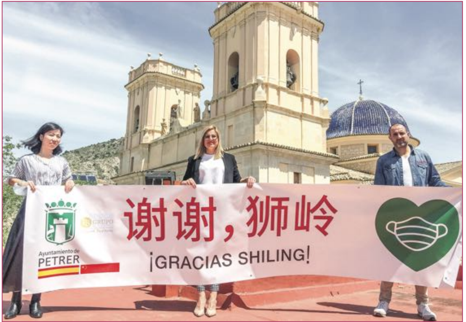
La alcaldesa agradece la donación particular de mascarillas.

«El superávit del año pasado nos permite ampliar las ayudas a los ciudadanos»