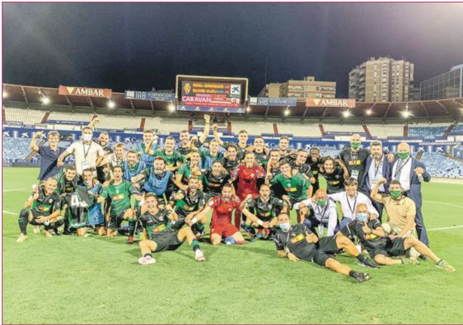
El equipo celebrando la victoria por 0 a 1 en Zaragoza, lo que metía al Elche C.F. en la final por el ascenso

Con el quinto presupuesto más bajo ha demostrado que el dinero aún no lo es todo en el mundo del fútbol