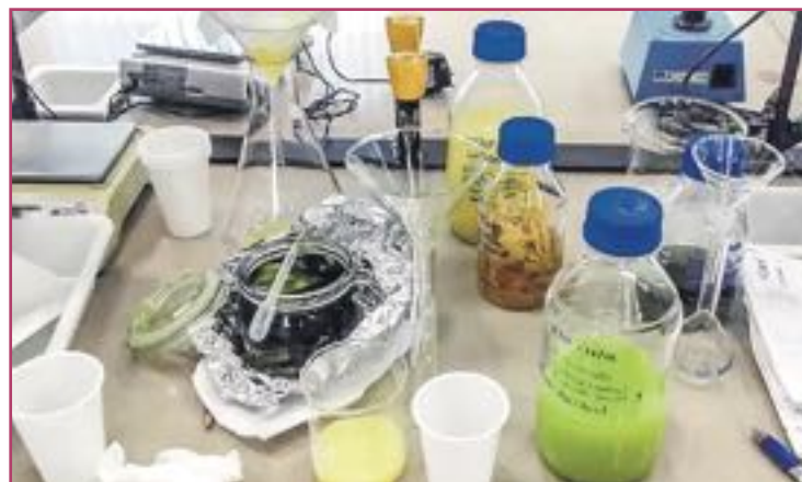
El desarrollo de su formulación se ha elaborado en la Universidad Miguel Hernández.

¿Y cómo han conseguido esa tonalidad que buscaban?