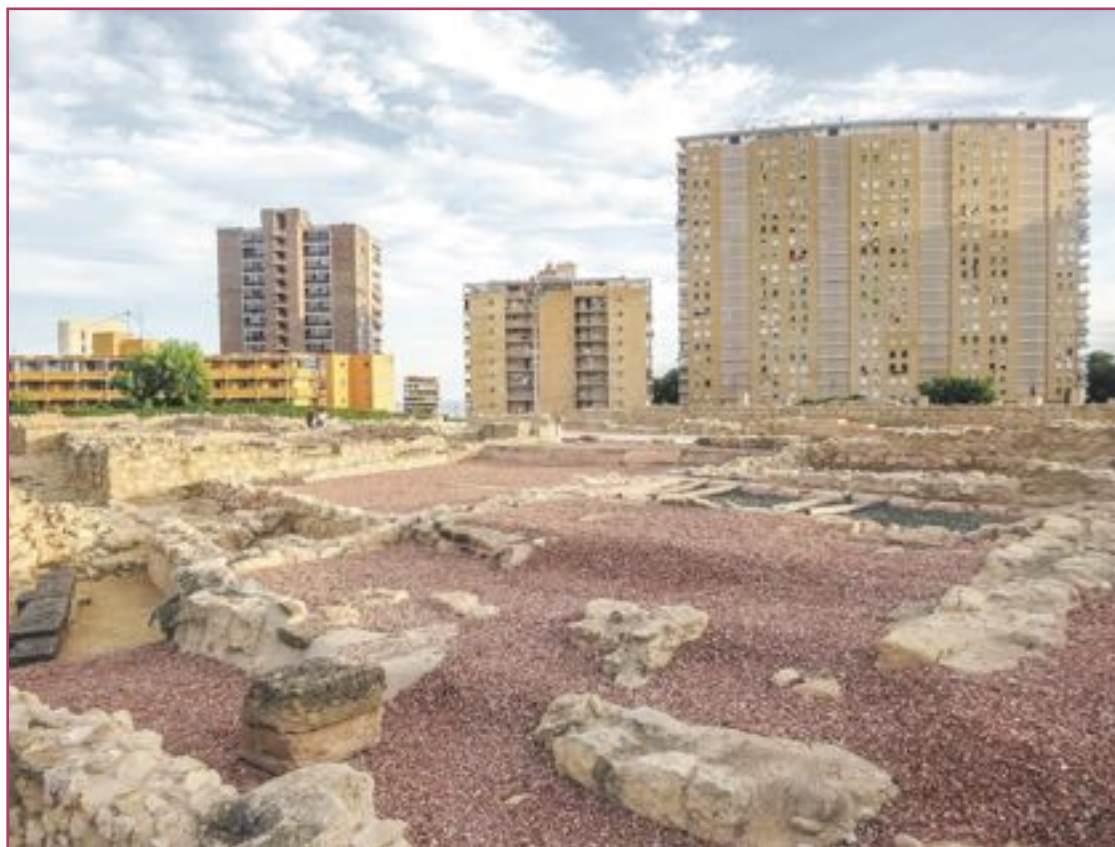
En el pasado los habitantes de Lucentum veían el mar desde sus casas. Hoy se ven urbanizaciones

Para muchos visitantes impactan las termas romanas