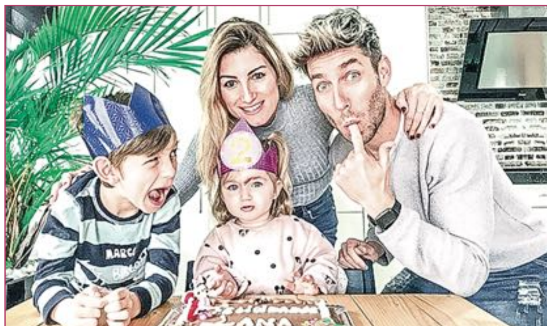
Sus dos hijos viven con naturalidad el camino que han escogido sus padres.

La naturalidad es una de las claves más importantes en esta familia