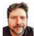
Fede Romero MAQUETACIÓN