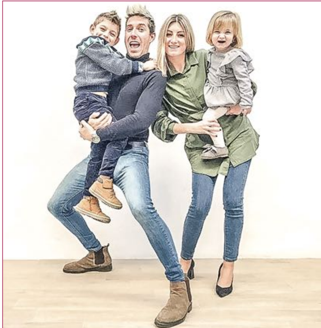
La familia reúne casi 100.000 seguidores entre sus dos cuentas de Instagram.

"Hemos tenido mucha suerte porque no hemos recibido críticas en términos generales; nuestras cuentas de Instagram y nuestro canal de YouTube no