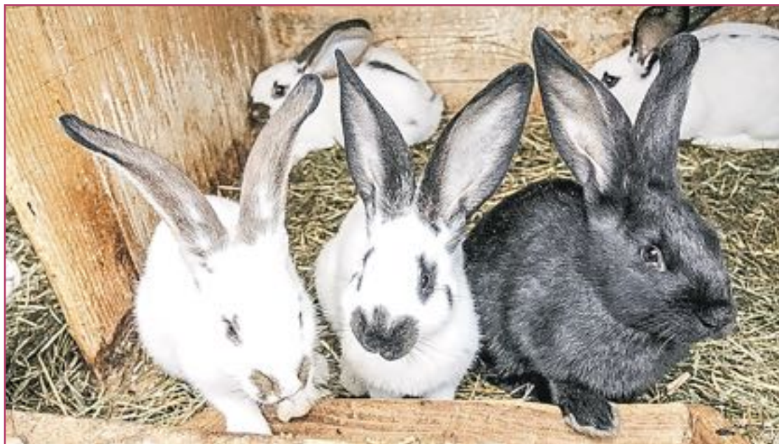
Según el catedrático Gosálvez los ganaderos españoles podrían rentabilizar mucho mejor la venta de conejos produciendo más machos.

«Las clínicas de reproducción no deben centrarse solo en la mujer, pues el varón también es esencial en las posibilidades de éxito»