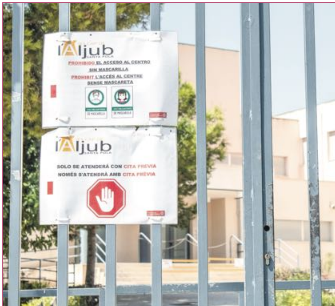
La vuelta a los colegios sigue creando mucha incertidumbre a las familias | Desireé Moya

Un máximo por clase de 20 alumnos en Infantil y 25 en Primaria