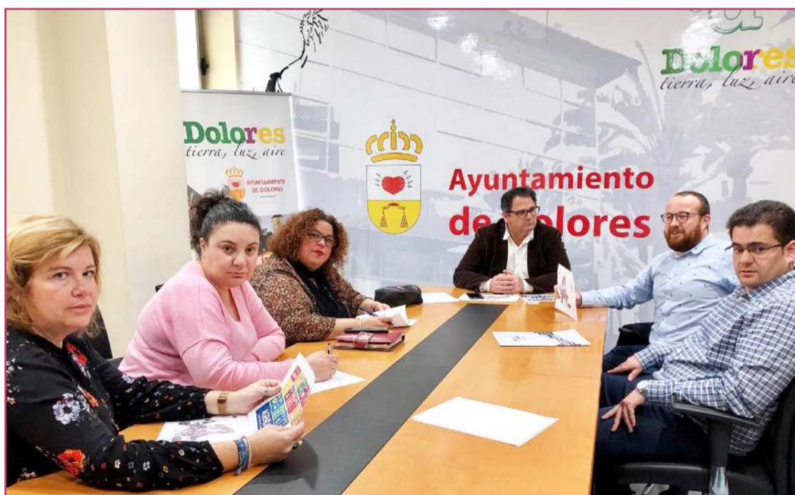
Reunión de trabajo de Joaquín Hernández, alcalde de Dolores, y concejales y concejalas del @ayuntamiento_de_dolores, estudiando las posibilidades de participación en proyectos europeos encuadrados dentro de la Agenda 2030.

«Es un reto que afrontamos con ilusión y es un orgullo ser los únicos representantes de España»