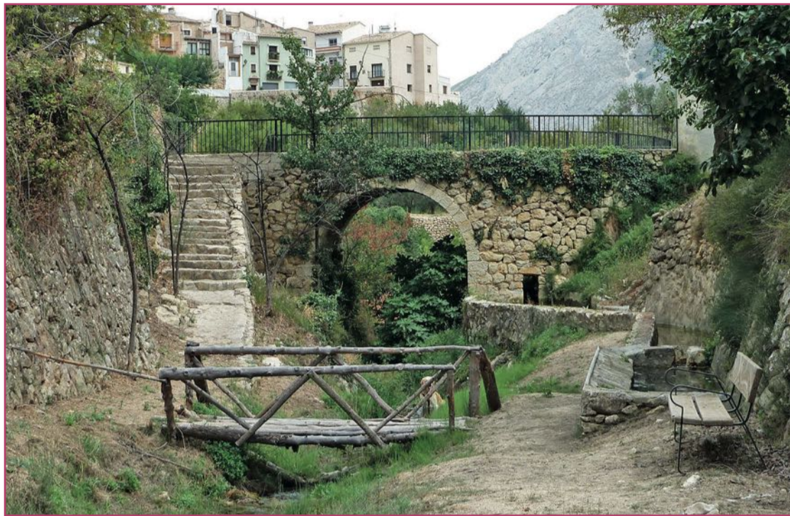
En la zona existen elementos patrimoniales que deben ser puestos en valor.

Lo más preocupante, desde el punto de vista provincial, es que la franja de tierra costera que podría considerarse atractiva para los que buscan nuevas oportunidades es cada vez -en el sentido literal del término- más estrecha. Así, la dirección general de Política Territorial y Paisaje