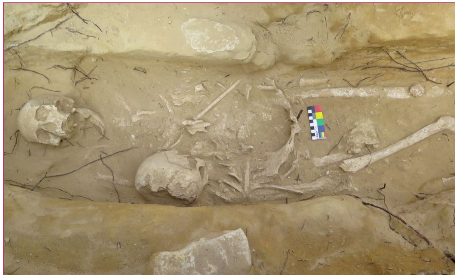
Esqueleto encontrado en la necrópolis del Cabezo del Molino que data del siglo VI

Por este motivo los arqueólogos alicantinos han enviado diversos huesos encontrados en la provincia de Alicante al citado instituto alemán, el cual posee un proceso innovador para analizar el ADN. Dichos restos óseos han sido extraídos de los yacimientos del Tossal de Manises (Alicante), L'Albir (L'Alfàs del Pi), Baños de la Reina (Calp), L'Atzuvia (Xàbia), Cabeza del Molino (Rojales), Vistalegre (Aspe), Polísixto (Cocentaina) y Cabezo Pardo (San Isidro-Albatera).