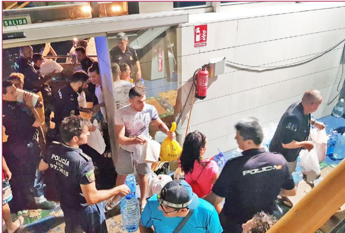
Voluntarios que levantaron una ola de solidaridad sin precedentes en Dolores y toda la Vega Baja, con motivo de la DANA.

Dolores sufrió fuertes lluvias torrenciales en el otoño de 2019, que tuvieron un impacto muy negativo en la localidad. Paralelamente a este fenómeno meteorológico, sus ciudadanos colaboraron voluntariamente en