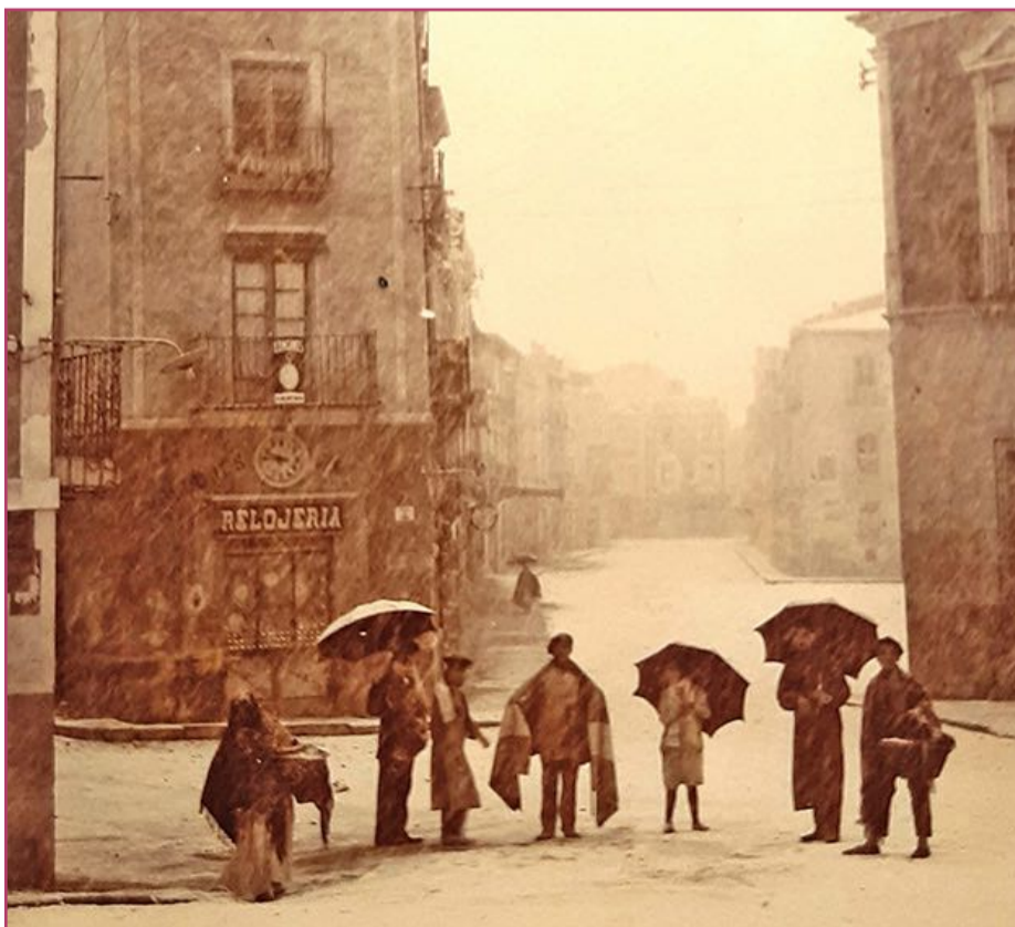
La Plaza de Cubero en la nevada de 1926

A final, toda era cuestión de consolarse con aquello de 'año de nieves, año de bienes', por lo de la mejora que se pudiera producir en las cosechas. Pero, también era significativo recordar el espectáculo de la ciudad, el campo y la huerta de Orihuela, de ver cambiado el paisaje debido a algo que no estamos acostumbrados, ya que el 26 de diciembre de 1926 y el 3 de febrero de 1954, nevó en Orihuela.