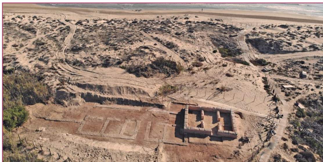
Vista aérea de la Villa Romana recién descubierta.

Todos los yacimientos tienen códigos QR para descargar una audioguía con toda la información