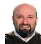
Christian Alain CREATIVIDAD Y WEB