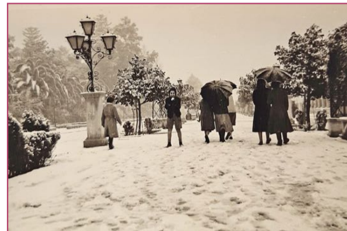
Los Andenes nevados, en 1954