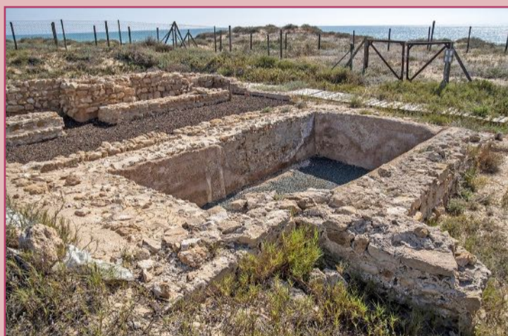
Antigua balsa de origen romano aparecida en la playa del Moncayo.

Esta masía probablemente constaría de varias construccio-