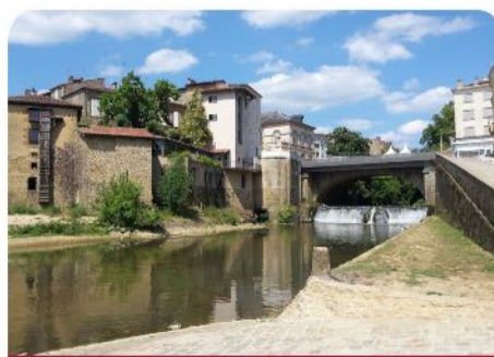
Pontonx sur l'Adour (Francia)