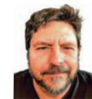
Fede Romero MAQUETACIÓN