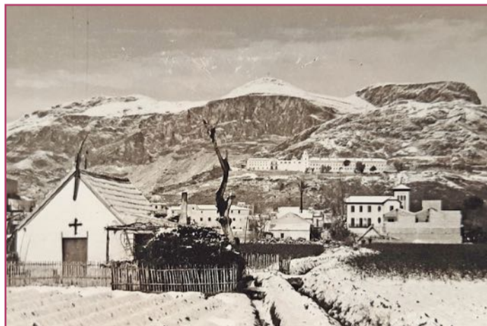
El telón de fondo del paisaje oriolano vestido de blanco, en 1954