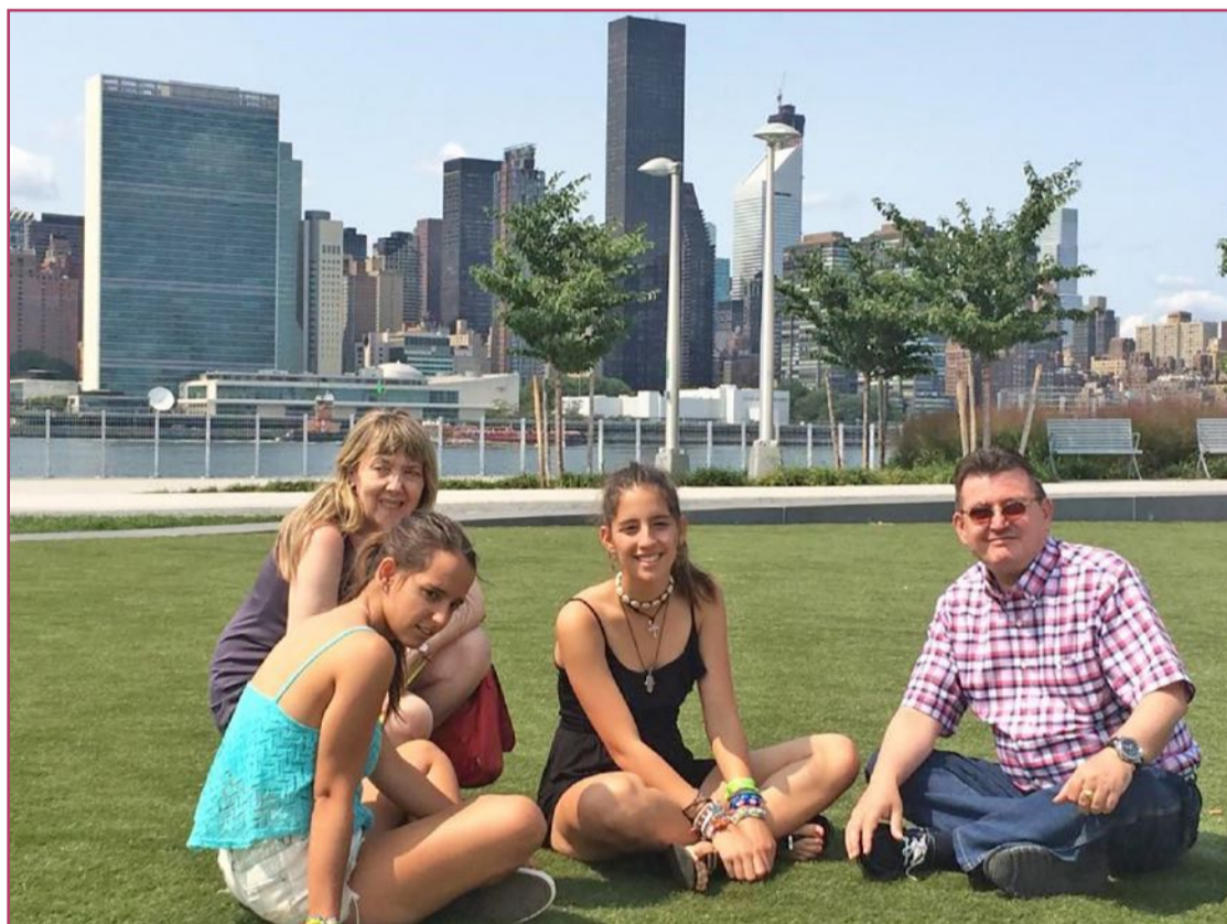
En Nueva York con su mujer y sus hijas.

«En mi infancia los profesores y amigos fueron quienes me hicieron creer en la integración educativa»