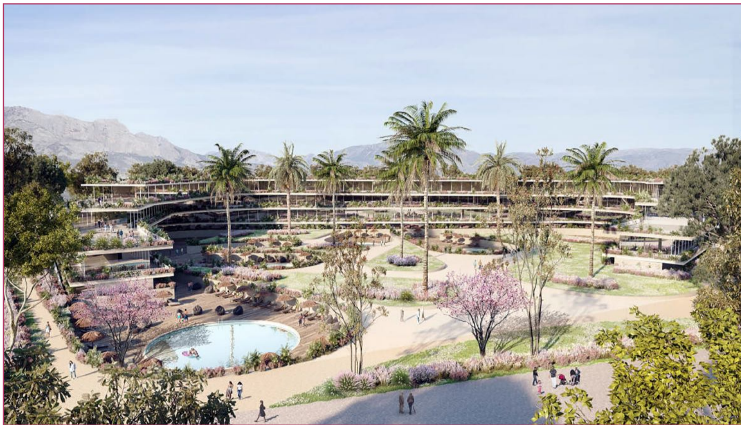
Proyección de la futura imagen que tendrá el sector Finca Roca.