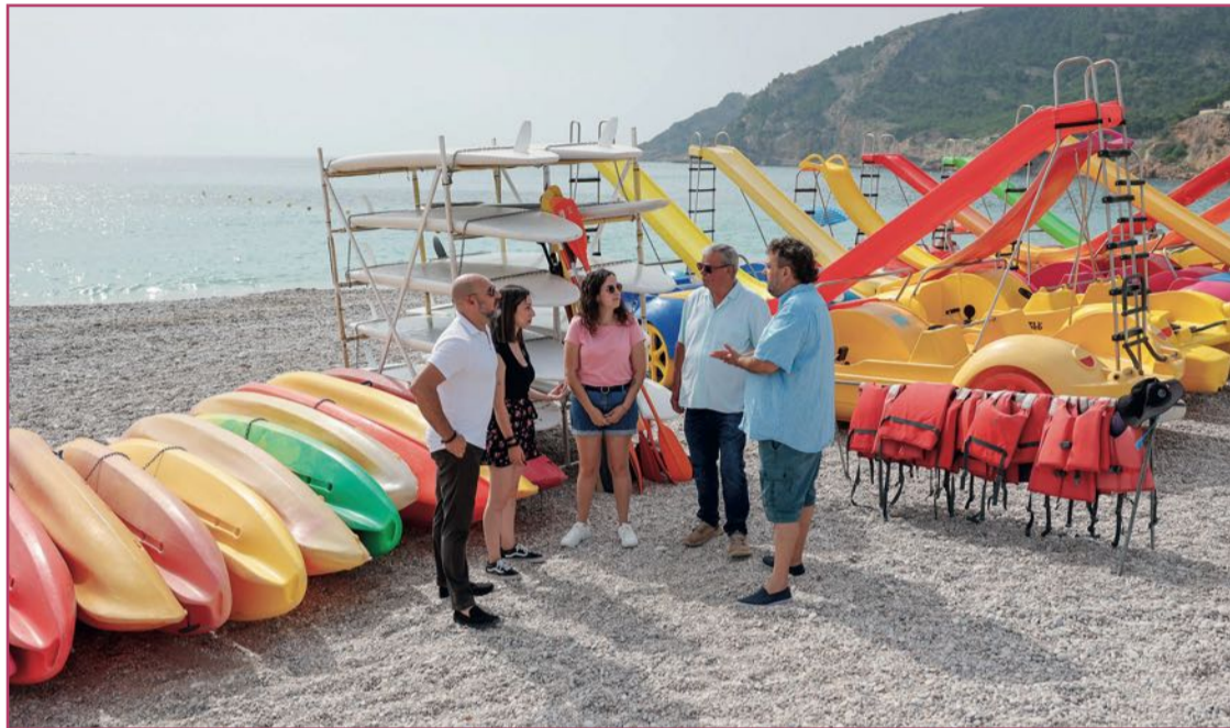
Imagen del acto de presentación de la edición de 2023.