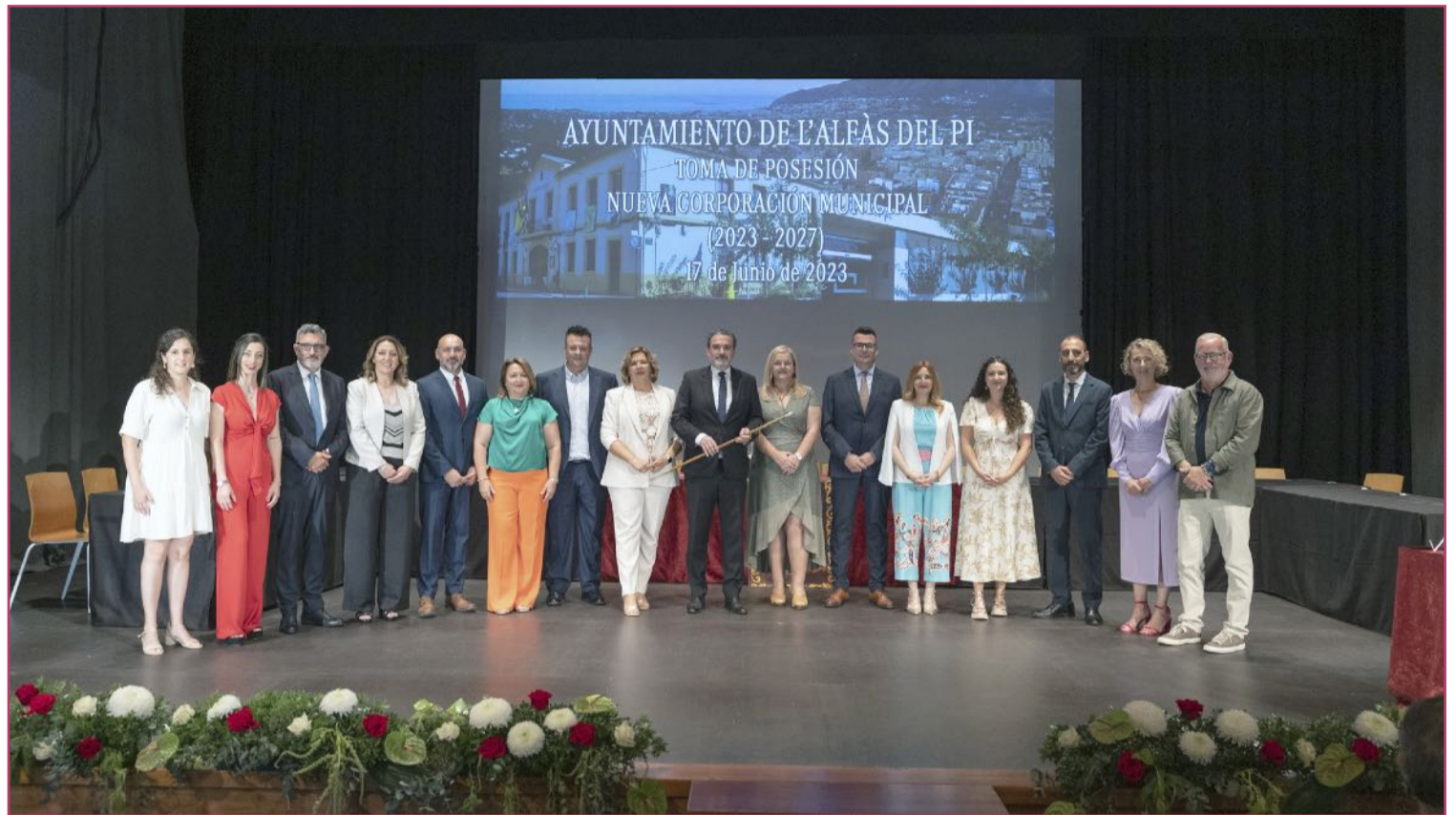
Imagen del equipo de gobierno para el presente mandato.