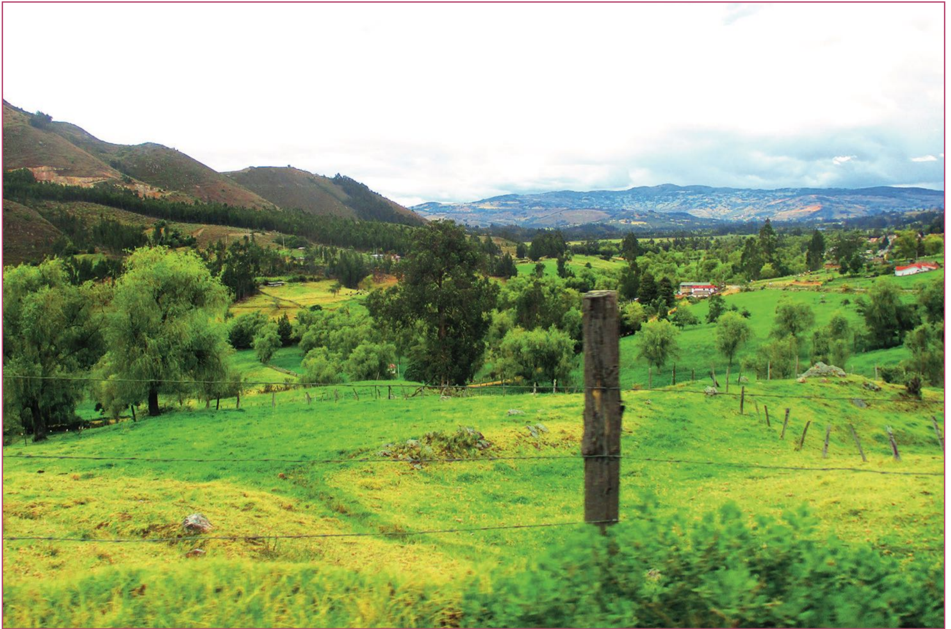
La expedición de Jorge Juan realizó sus mediciones de la curvatura terrestre en Los Andes.

tando a nuevos profesores que enseñaban técnicas sobre ingeniería naval y cartografía más innovadoras de las que habitualmente se impartían en España. También fundó un Observatorio Astronómico y una Asamblea Literaria, con la idea de que estos organismos fueran los gérmenes de una futura Academia de Ciencias.