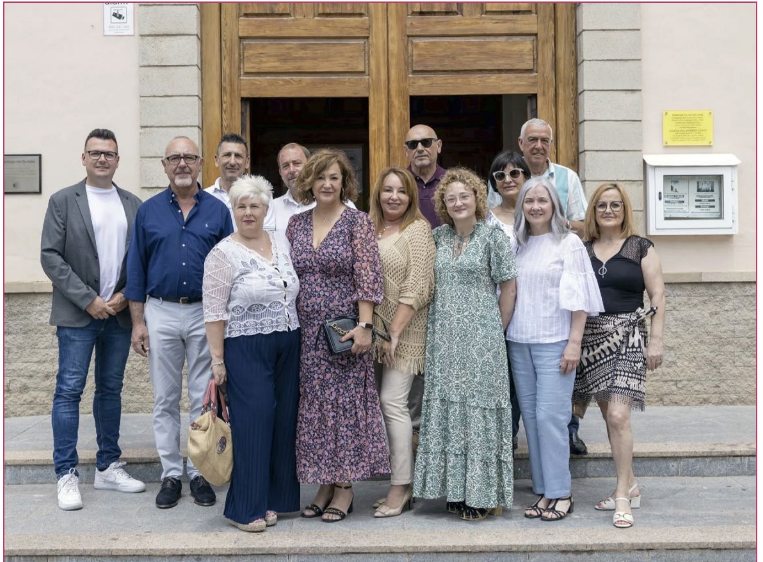
Los siete matrimonios que se han decidido a recuperar las fiestas de San José.

Los catorce mayores todavía no han anunciado los actos con los que tratarán de volver a poner en marcha las fiestas de San José, pero sí han mostrado ya su intención de "organizar eventos para que la ciudadanía disfrute y, al mismo tiempo, colabore para que siga la tradición de 'La Festa de Sant Josep'".