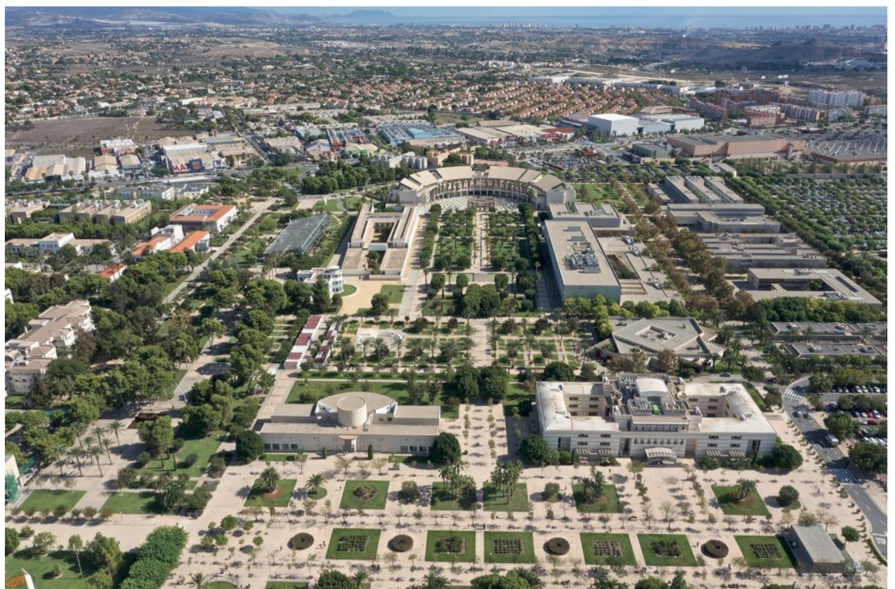
Campus de la Universidad de Alicante.

Desde una perspectiva distinta nace el Grado de Ingeniería en Inteligencia Artificial (IA). Esta materia surge desde una gran demanda social y laboral, y lo hace, ade-