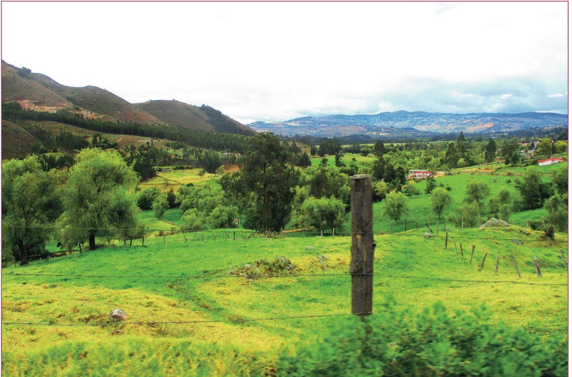
La expedición de Jorge Juan realizó sus mediciones de la curvatura terrestre en Los Andes.

tando a nuevos profesores que enseñaban técnicas sobre ingeniería naval y cartografía más innovadoras de las que habitualmente se impartían en España. También fundó un Observatorio Astronómico y una Asamblea Literaria, con la idea de que estos organismos fueran los gérmenes de una futura Academia de Ciencias.