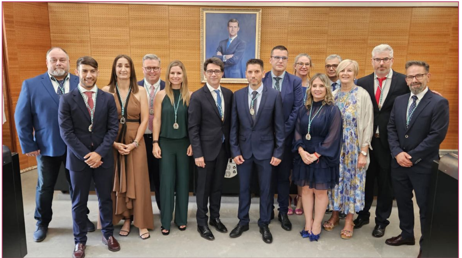
Nuevo equipo de Gobierno.

La Concejalía de Hacienda queda dividida en dos áreas y concejales distintos