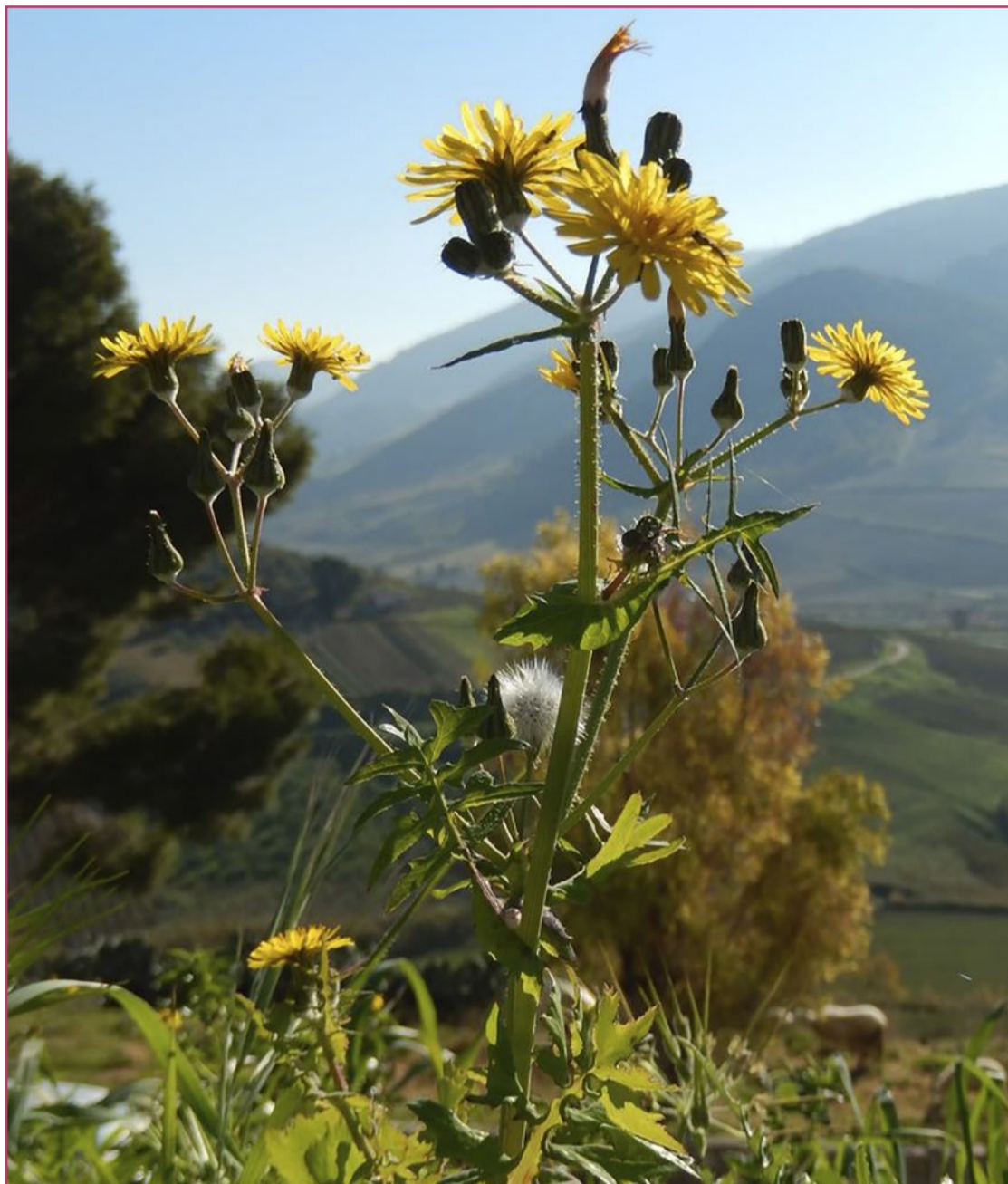
La cerraja menuda, 'lletsó', 'llinsó' o linsón es el alma de muchas ensaladas levantinas | Luca Fornasari

De 3.000 especies de plantas, 127 son endemismos valencianos