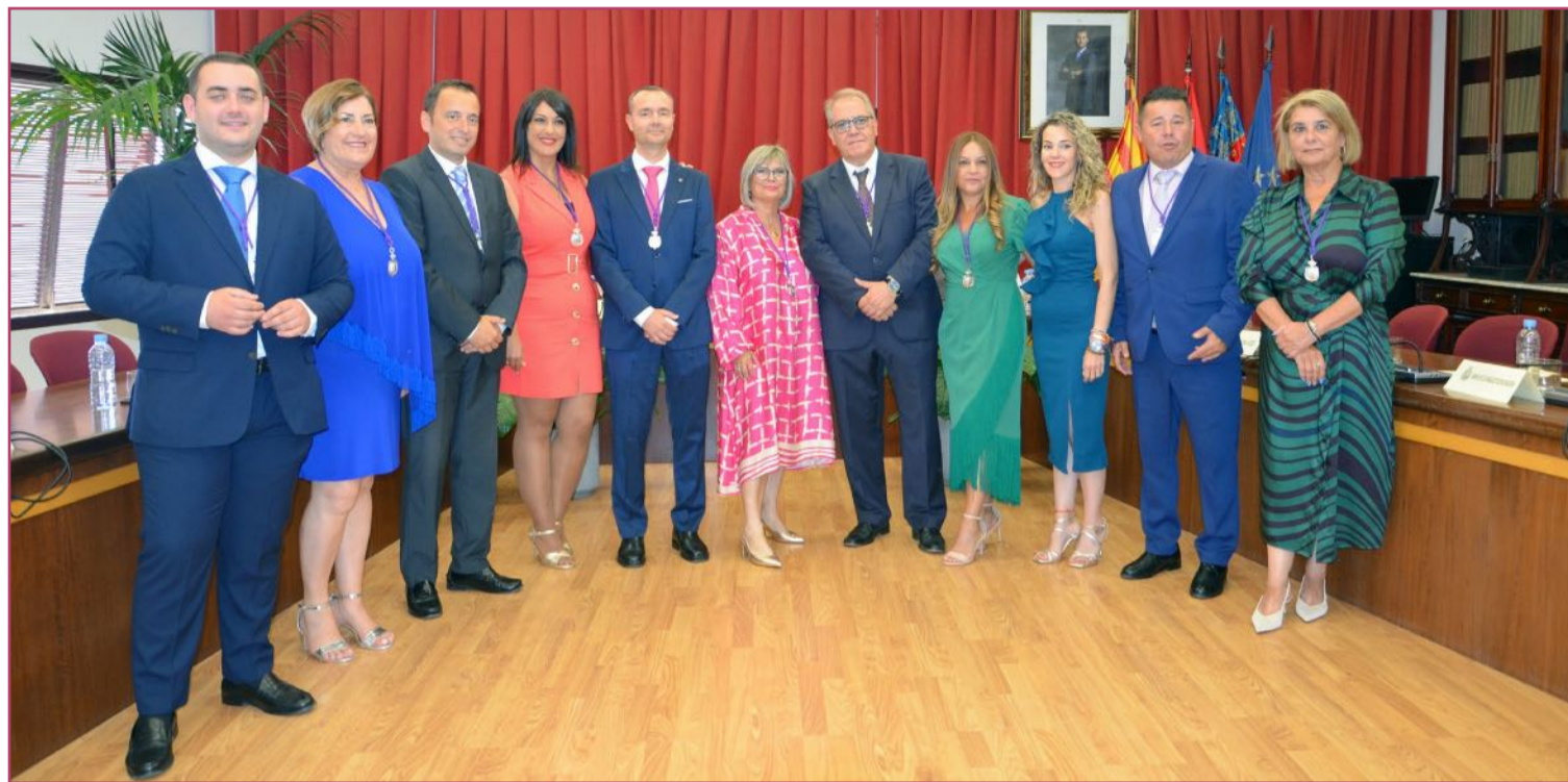
Nuevo equipo de gobierno.