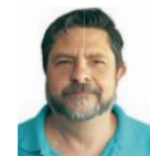
Fede Romero MAQUETACIÓN