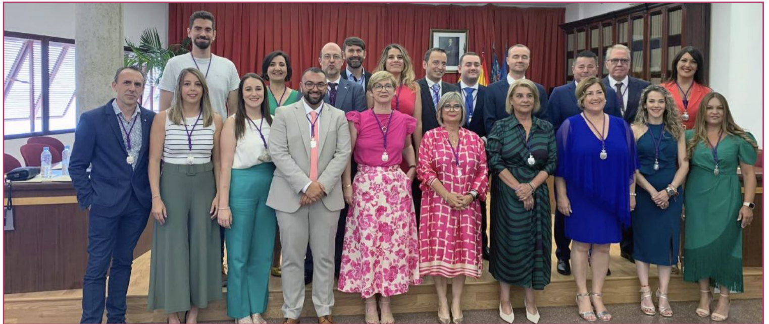
La nueva corporación salida de las urnas tras las elecciones municipales.

“Siempre hemos estado al pie del cañón para sacar propuestas beneficiosas, ayudando para que