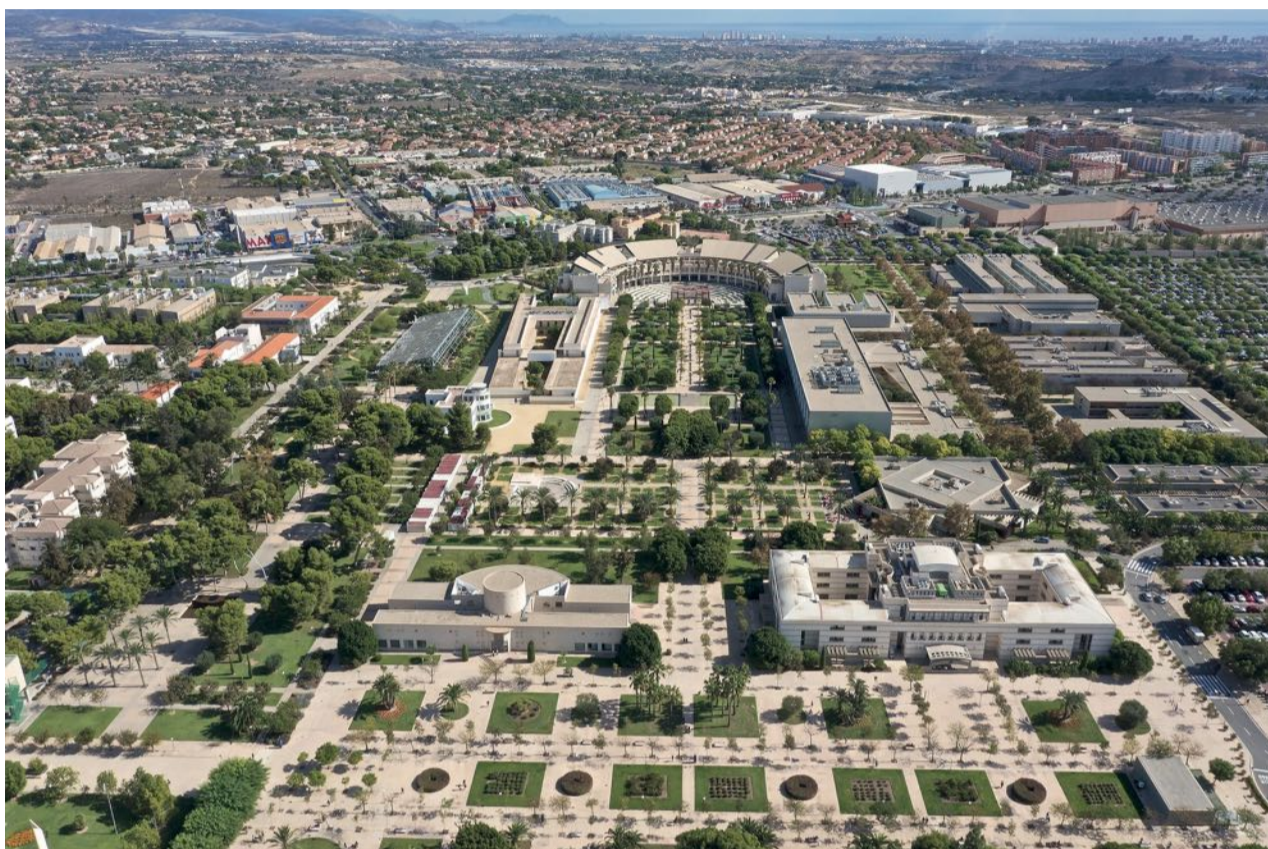
Campus de la Universidad de Alicante.

Desde una perspectiva distinta nace el Grado de Ingeniería en Inteligencia Artificial (IA). Esta materia surge desde una gran demanda social y laboral, y lo hace, ade-