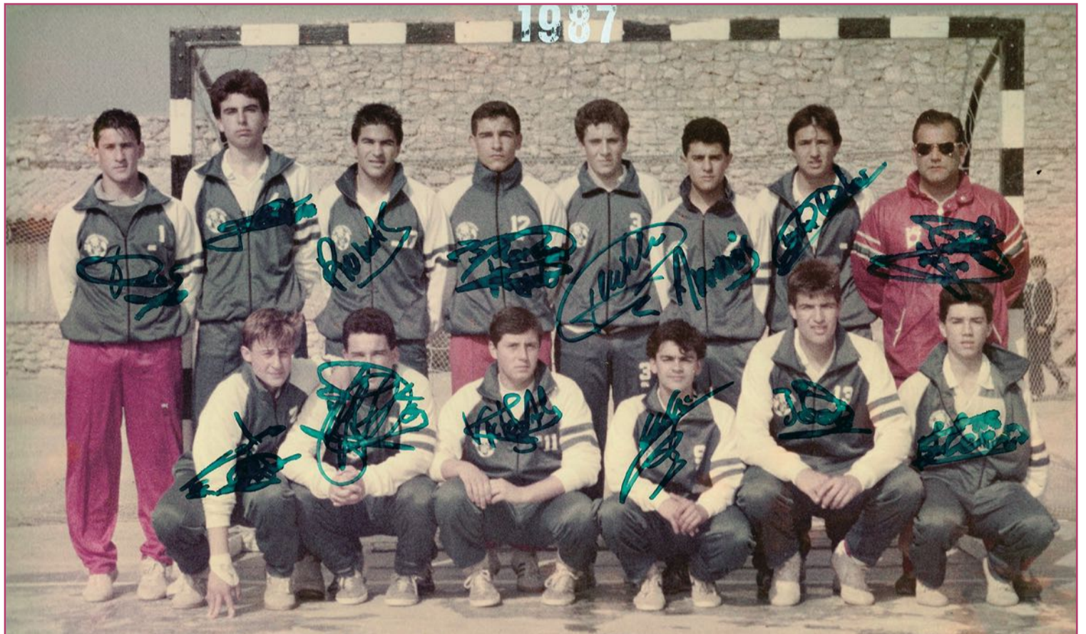
El equipo del Club Balonmano Torrevieja que fue Campeón de España en la categoría Cadete en 1987.