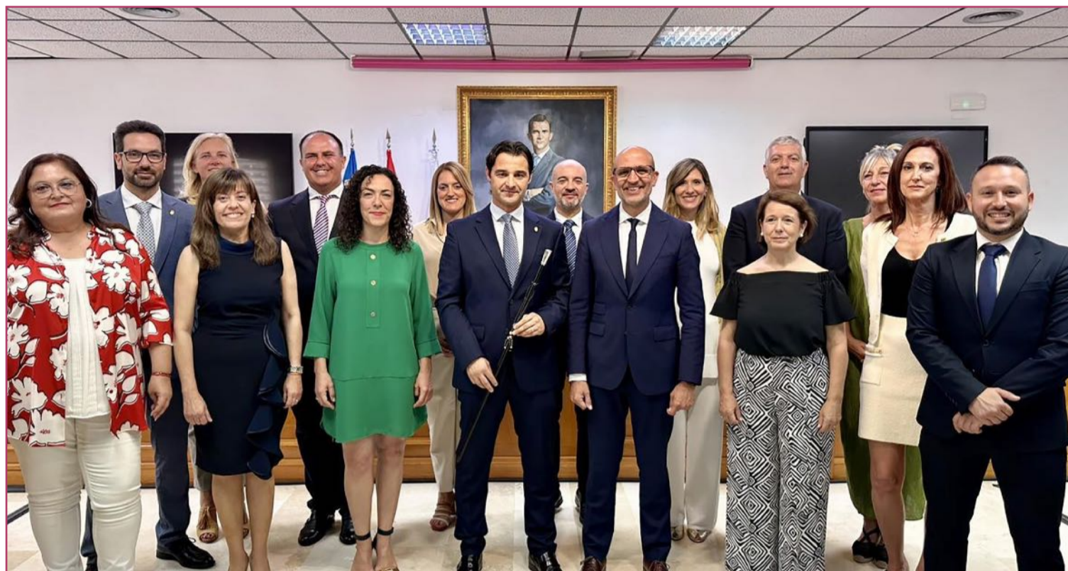
Nuevo equipo de gobierno municipal de Torrevieja.