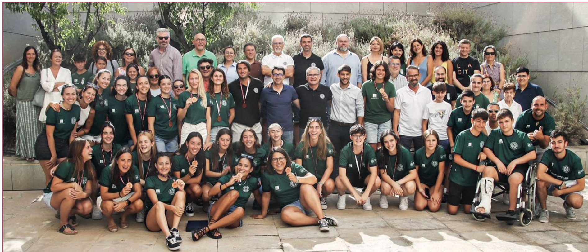
El alcalde y el concejal de Deportes recibieron el pasado 10 de julio a las jugadoras del Club Atlético UA Hockey tras su ascenso.

Arranca la temporada 23-24 con mucha ilusión para nuestros clubes de fútbol, baloncesto, hockey, voleibol y futbol sala