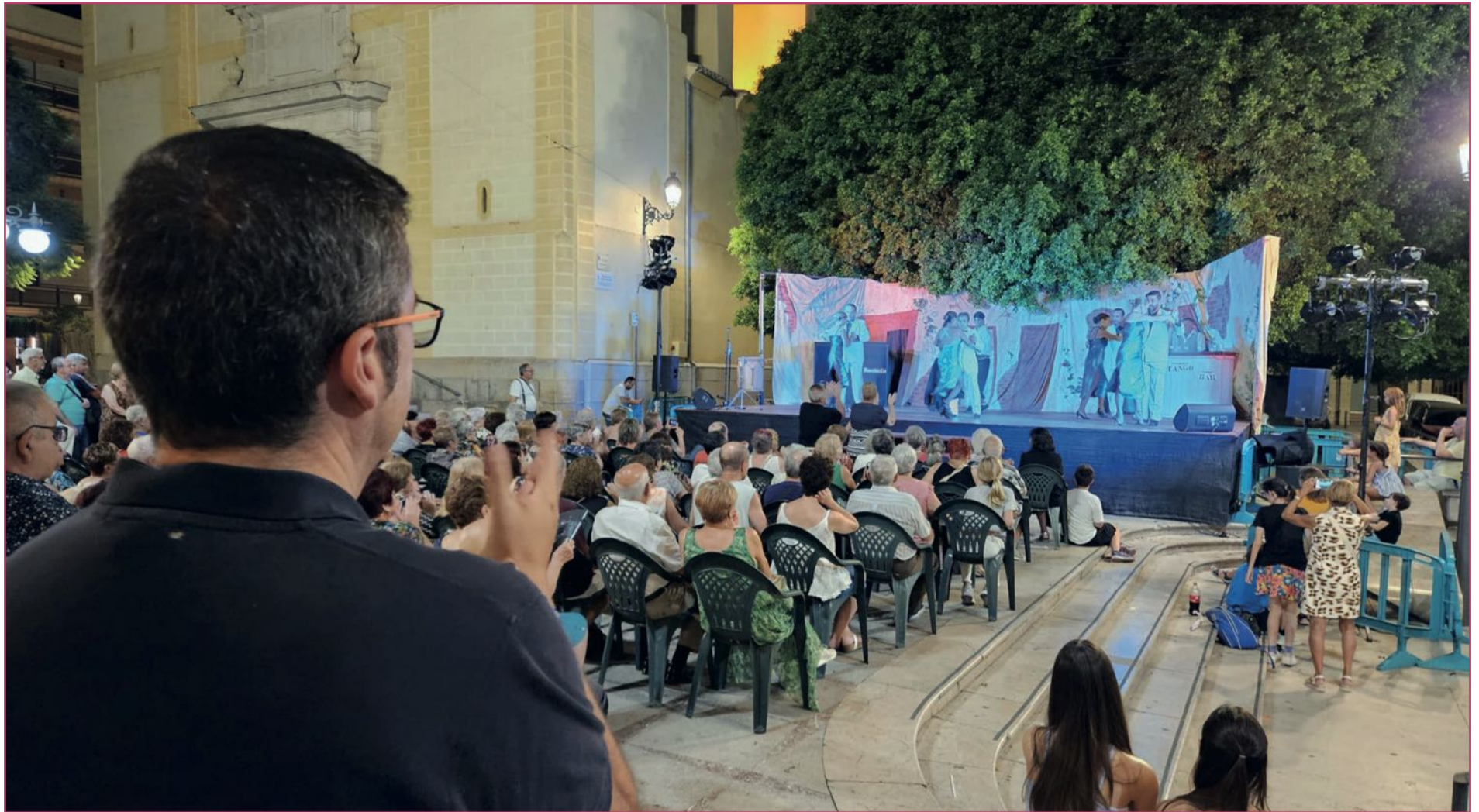
Lillo observando la actuación de las Jornadas Tangueras celebradas este agosto.

cabe un 0,5% de la población así que tenemos que conseguir llenarlo en todas las actuaciones.