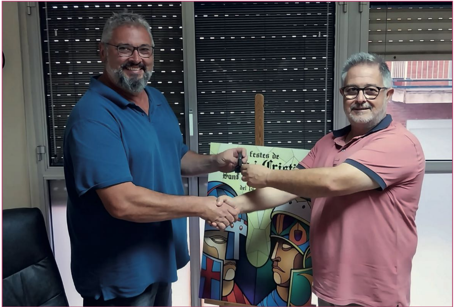
Traspaso de poderes entre el presidente saliente y el entrante (8 de agosto).

Más comparsas ya no puede haber porque los estatutos limi-