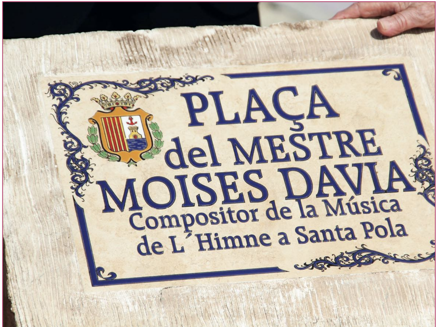
Placa conmemorativa de una plaza que consigue que el músico y compositor mire directamente al mar.

Chinchilla es hoy una población monumental con 4.497 habitantes censados en 2022, pero nada menos que 7.154 en