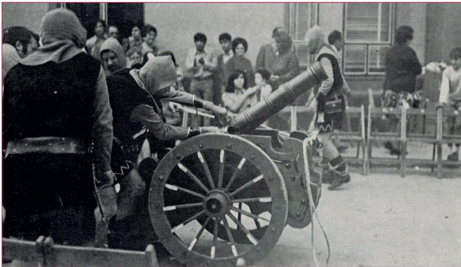
Comparsa Almogávares (1970).

Algunos apuntan a que estos actos festeros se realizaban como un complemento de la ya entonces muy potente Semana Santa crevillentina, pero que acabaron siendo eclipsados por