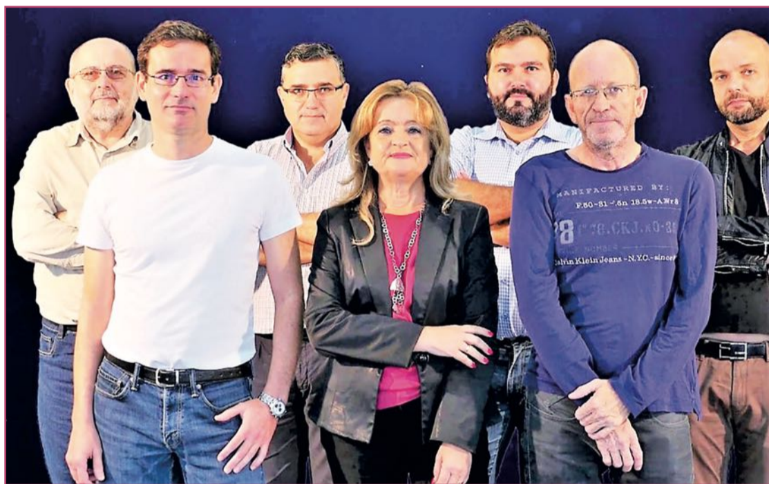
Los dos catedráticos con miembros de su equipo.

«Lograr aumentar el color rojo o morado de estos frutos, es un factor muy importante en su calidad y beneficios» D. Valero