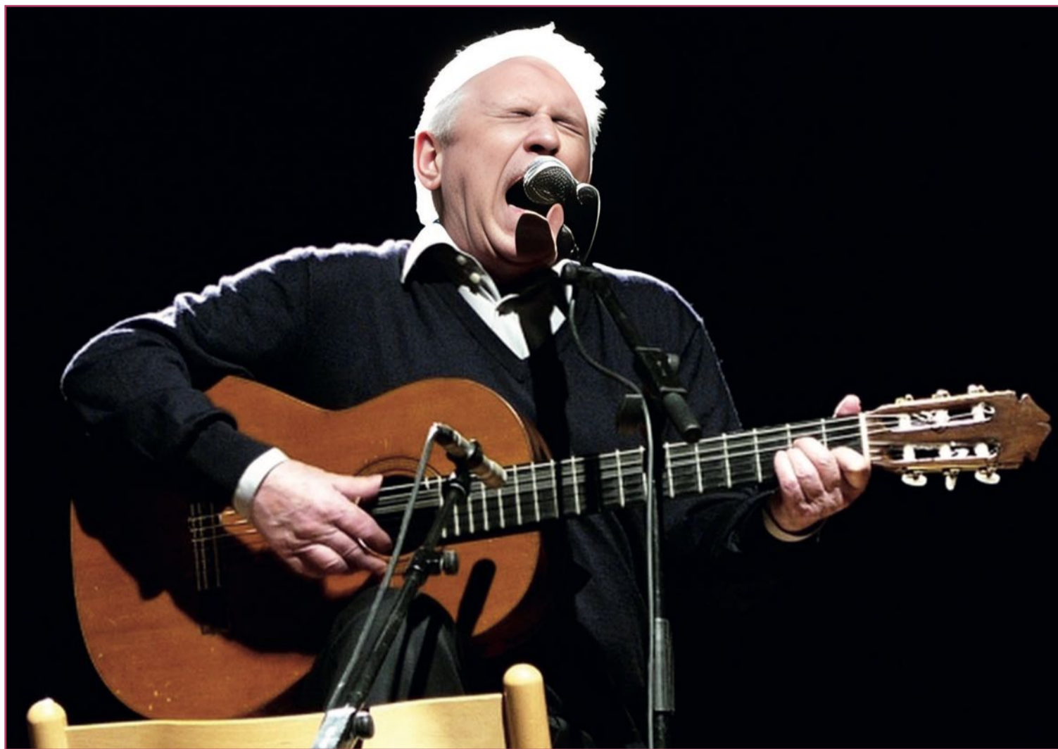
El valenciano Raimon es uno de los principales nombres de la Nova Cançó.

El franquismo (1939-1978), o sea, el régimen generado por el militar Francisco Franco, 1892-1975) comenzaba a enfrentarse a lo que, entre visillos del entorno del Pardo (el palacio donde vive el general), se denomina "el hecho biológico". O sea, que Franco era finito, que (y además con la salud tocada) podía morir. Diversas iniciativas, como las culturales, comenzaban a aflorar tanto desde la calle como desde sectores del propio gobierno.