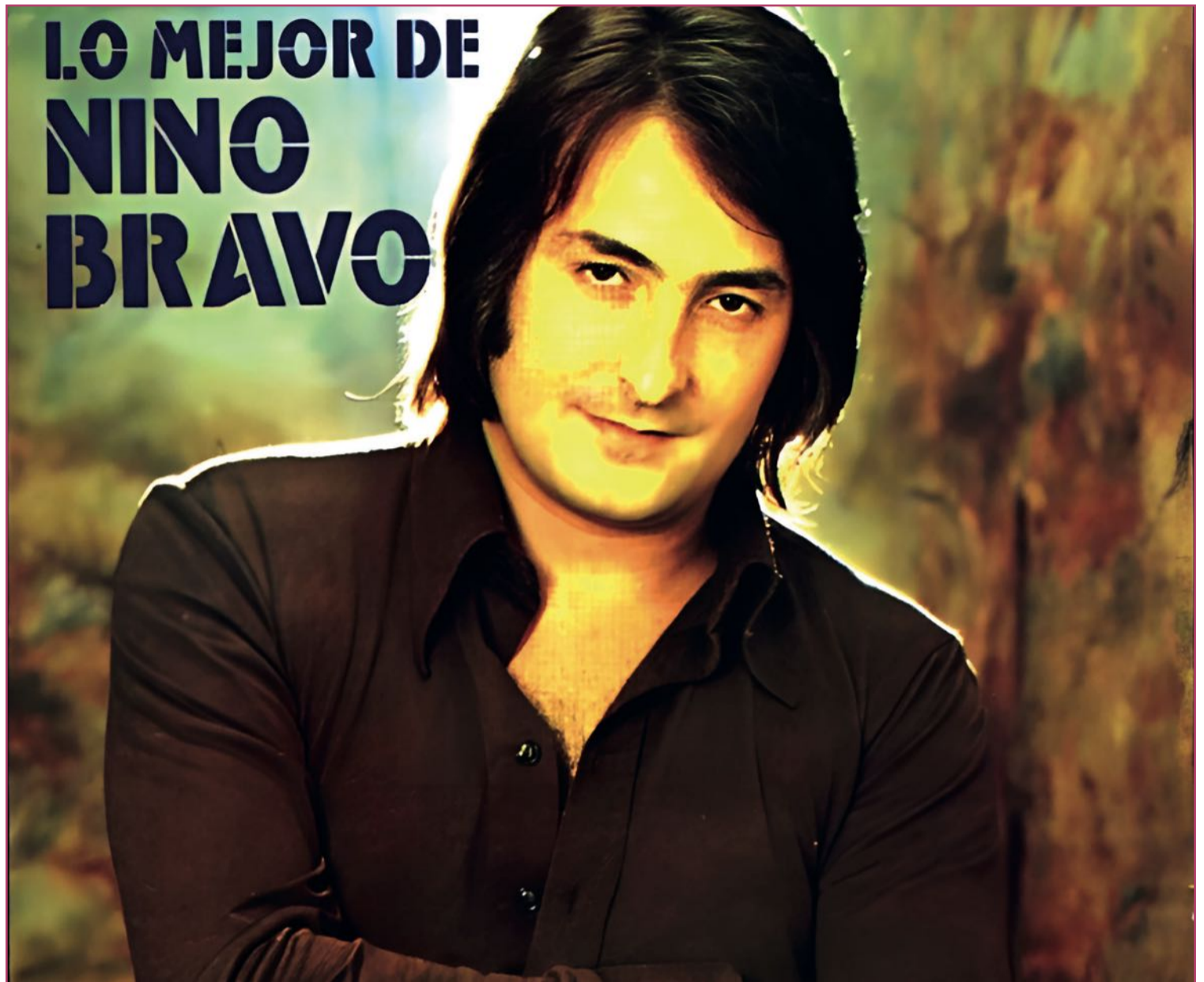
El cantante valenciano Nino Bravo vio su vida truncada en la carretera, aunque siguió el mito.

Juan Bau tuvo que grabar un vídeo para desmentir su muerte