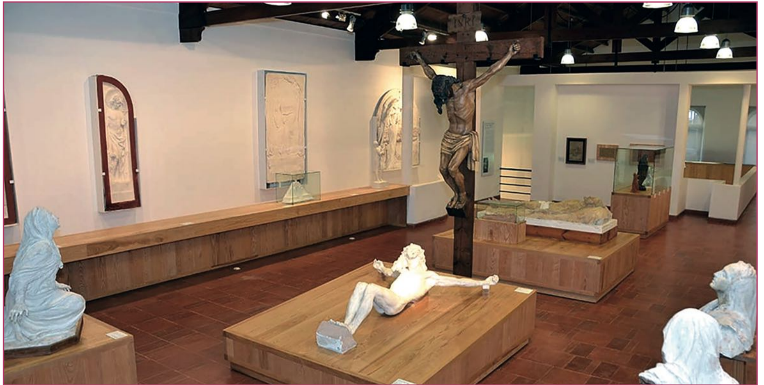
Obras de carácter religioso expuestas en el museo.

De hecho algunas de las piezas que están expuestas en el Museo de la Semana Santa tienen su modelo en el Museo Benlliure. Cabe recordar que ambos están al lado, por lo que se pueden visitar en un mismo día fácilmente.