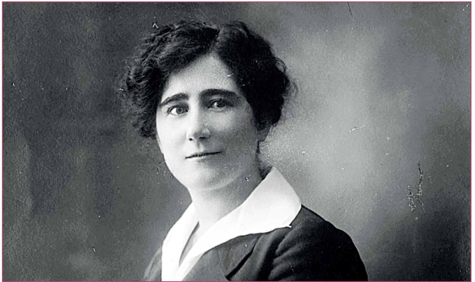
La diputada Clara Campoamor.

En esta ocasión sí se permitió el sufragio pasivo femenino.