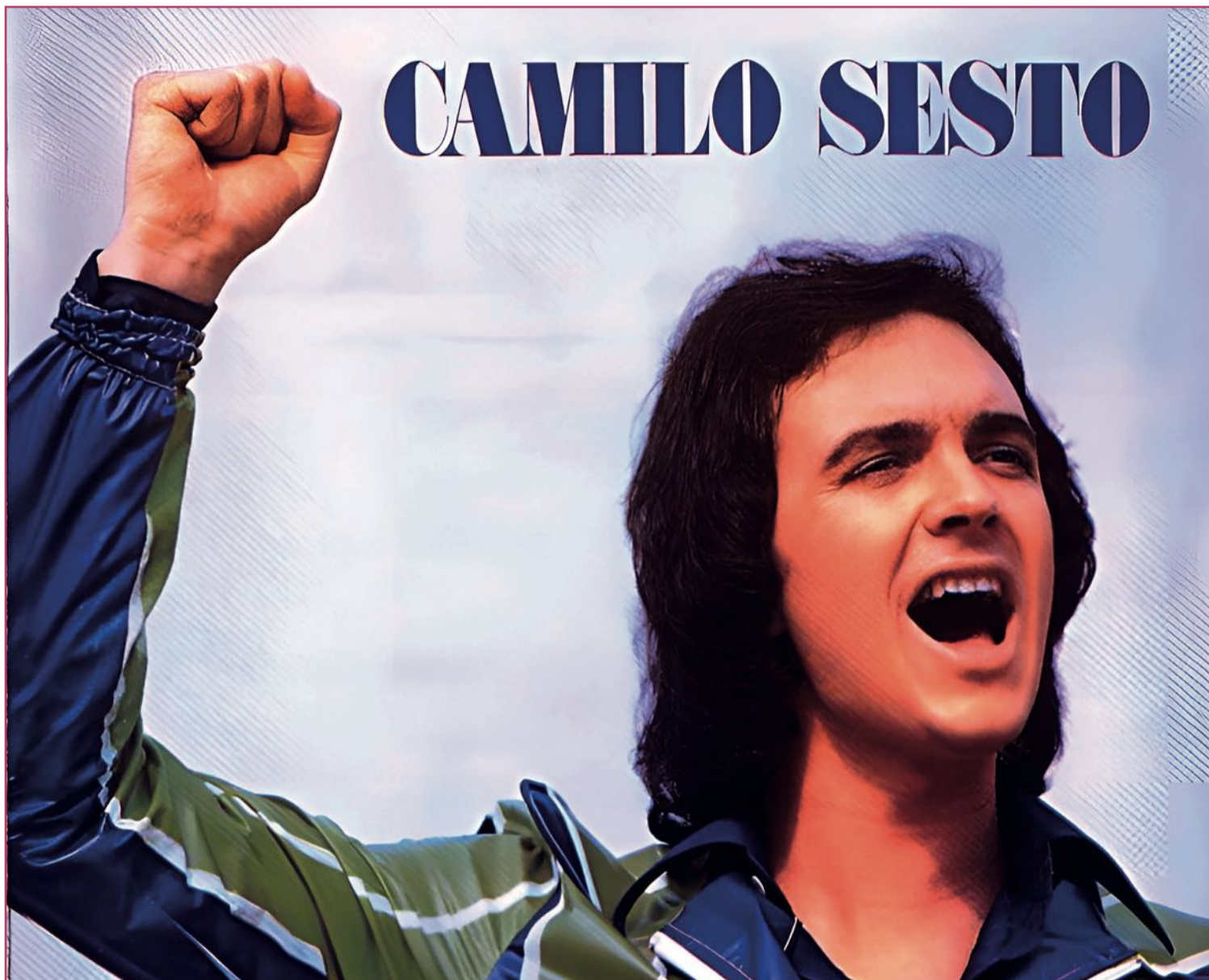
El alcoyano Camilo Sesto se convirtió en uno de los pioneros de la canción melódica.

Efectivamente, este hijo de familia humilde, que añadió el inglés a los idiomas de crianza, valenciano y castellano, y que comenzó con el disco 'Los Dayson' (1965), para el grupo del mismo nombre (que en septiembre del pasado 2022 dio un multitudinario concierto en el alcoyano Teatro Calderón), figura en un parna-