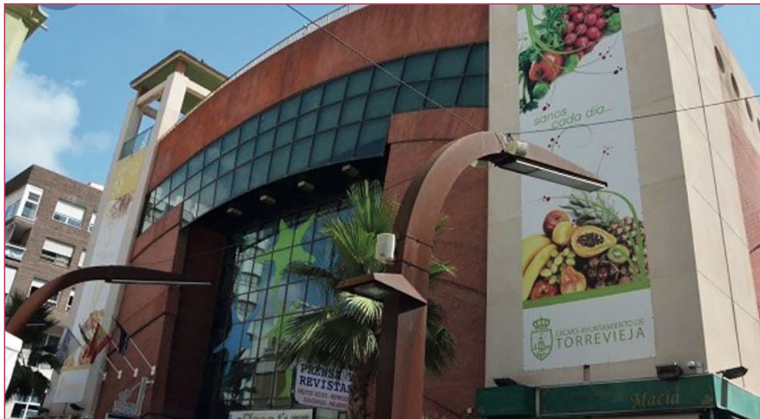
Foto reciente del mercado.

Todo ello irá acompañado de una importante modificación de la fachada exterior del edificio