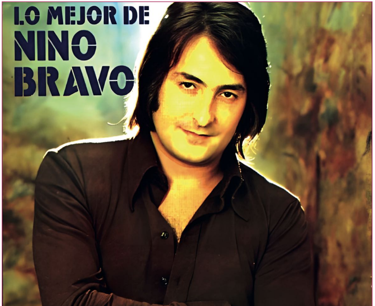
El cantante valenciano Nino Bravo vio su vida truncada en la carretera, aunque siguió el mito.

Juan Bau tuvo que grabar un vídeo para desmentir su muerte