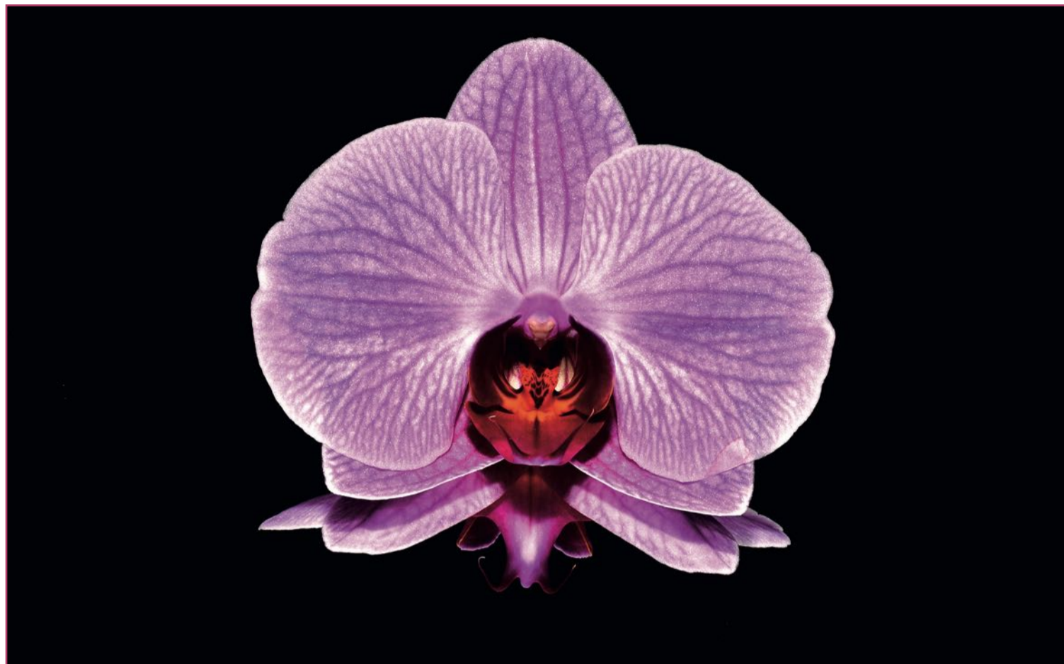
Las orquídeas, por sus peculiares formas, han ejercido siempre un poderoso influjo.

Esta especialización por, y valga la redundancia, especie, por otra parte, es lo que ha permitido que, por ejemplo, no exista un olor específico a orquídea. Las 'tretas' de las flores 'Orchidaceae' para conseguir su polinización las ha llevado a desarrollar, por especie, repetimos, los más dispares aromas, como el de cítricos de la orquídea limoncillo ('Eucheline karwinskii'). Y eso sin olvidarse