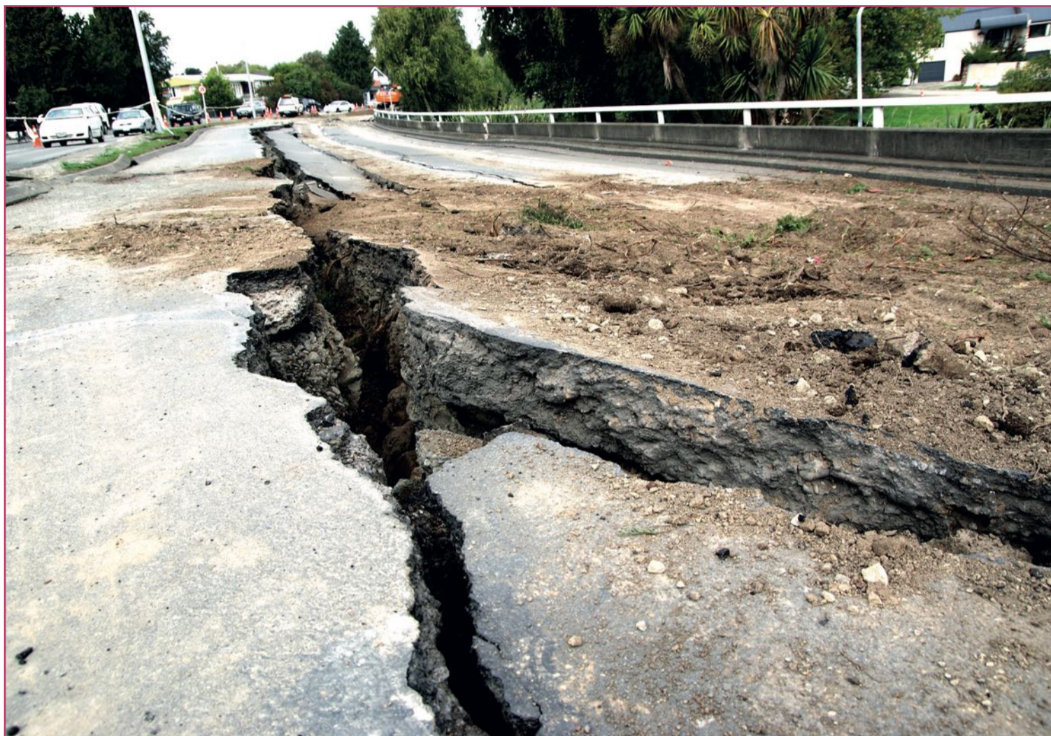
La tierra tiembla, se agrieta, el terremoto campa ya a sus anchas.

El caso es que el terremoto que aconteció en Lorca, en la vecina comunidad murciana,