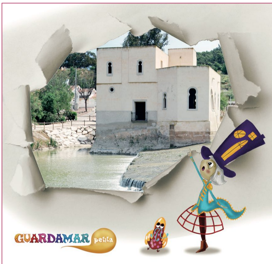
El personaje infantil Duna.

Ambas localidades contaron con fondos económicos para de-