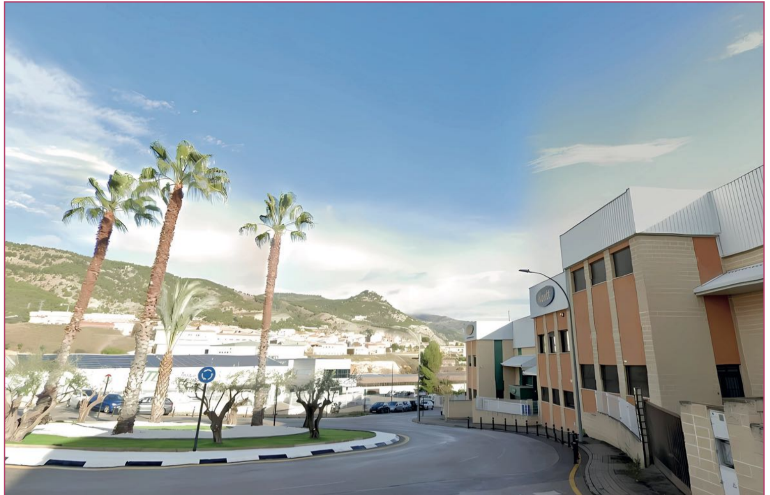
Uno de los polígonos industriales de Alcoy, capital de la multi industrializada comarca de l'Alcoià.

La siderurgia llegaba a Sagunto de la mano del político e industrial vasco, de origen cántabro, Ramón de la Sota y Llano (1857-1936), quien creaba en 1917 la Compañía Siderúrgica del Mediterráneo. Se habilitaba una especie de embarcadero de las materias primas, con primera transfor-