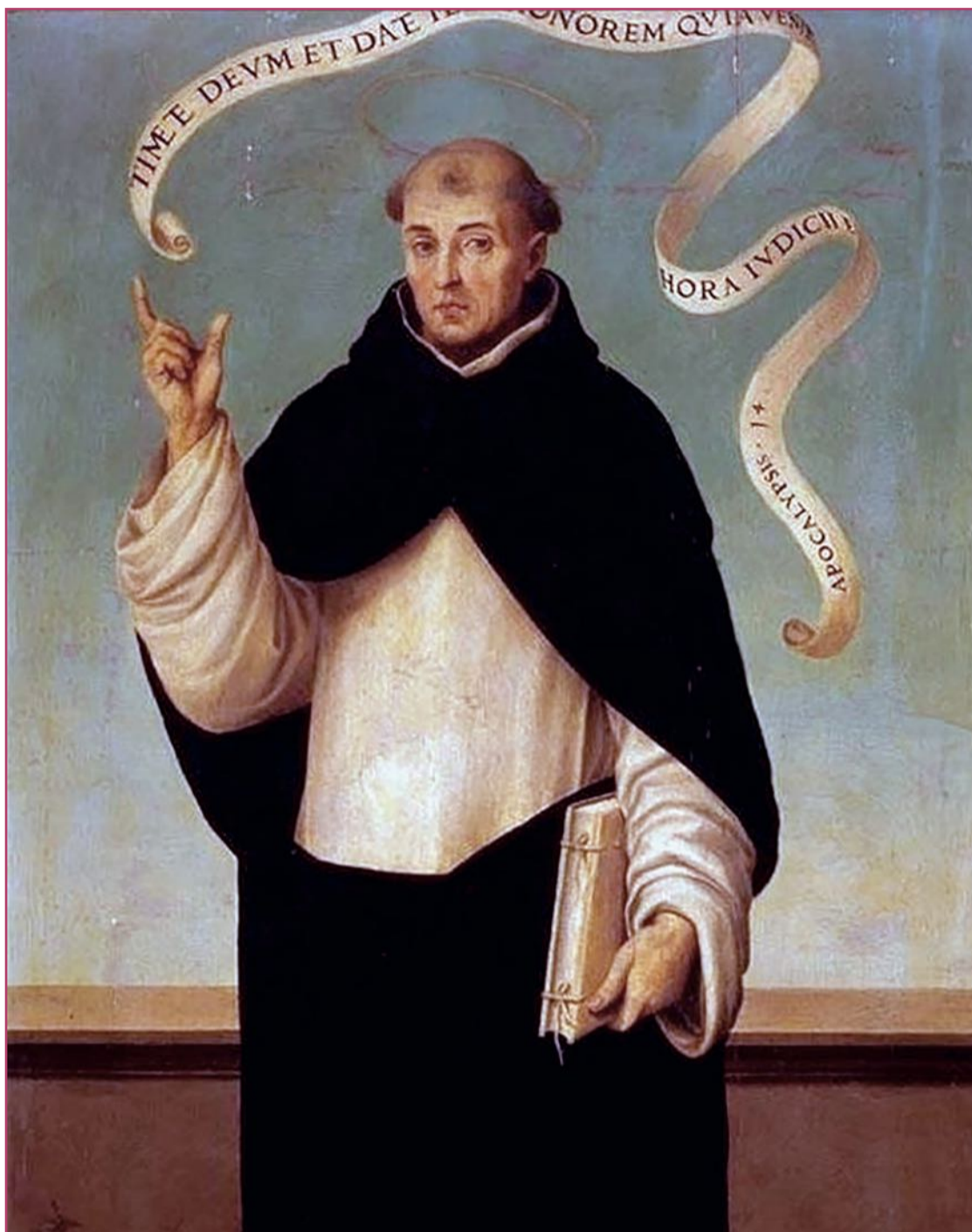
Retrato de San Vicente Ferrer.

Supuestamente el santo patrón habría dicho estas palabras para animar a los agricultores