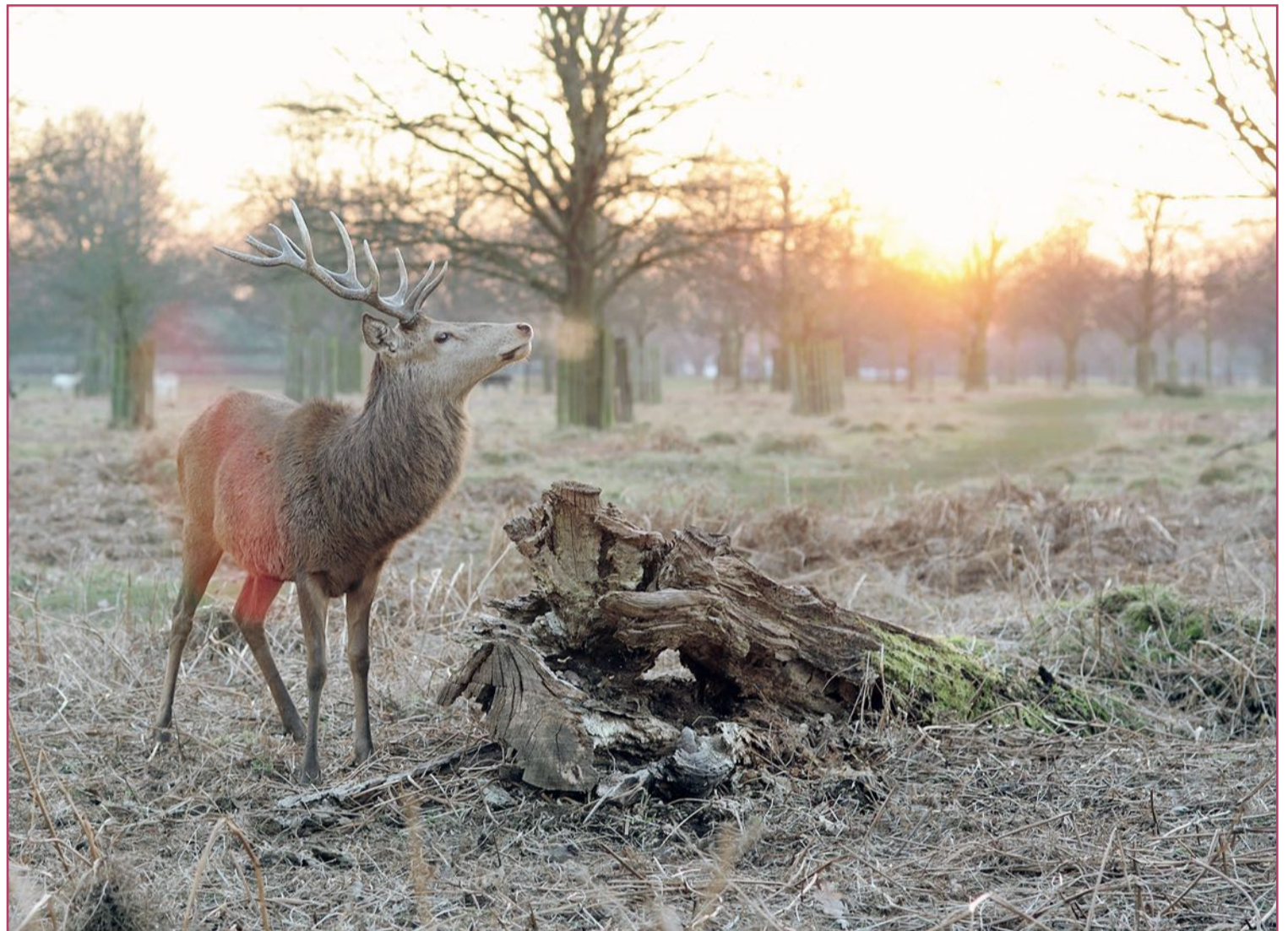
Tras desaparecer los ciervos fueron reintroducidos en la Comunitat Valenciana.

Para este grupo, adscrito a la International Union for Conservation of Nature (IUCN) o Unión In-