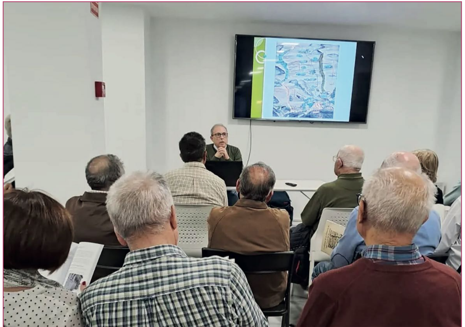
Presentación de una publicación del Cercle d'Estudis.

Actualmente los miembros del Cercle están dedicándose a trasladar todo el material del que disponen hasta su nueva sede. Según nos indican, su objetivo es que este espacio se convierta en todo un “centro de