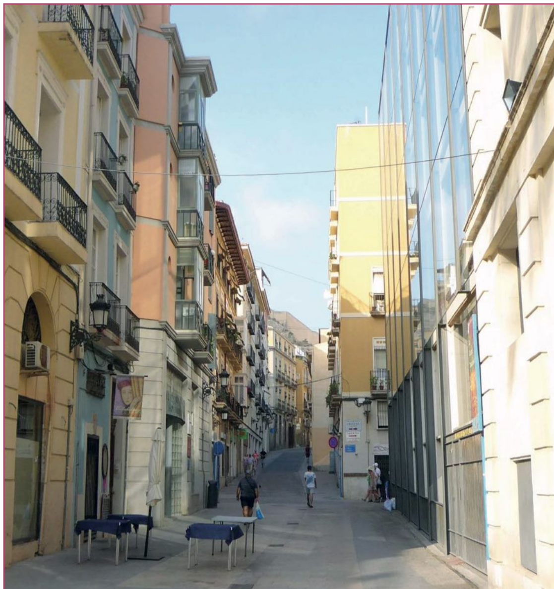
Vicente Inglada nació en la calle Gravina de la capital alicantina.

Tras unos años en Toledo, el alicantino aceptó un puesto como profesor en la Escuela Superior de Guerra en Madrid, donde tiempo antes había sido alumno. Aquí continuó participando en diferentes investigaciones en geografía, aritmética, geometría, astronomía... sobre todo centrándose en sus aplicaciones a la ciencia militar. De hecho representó a España en varios congresos científicos