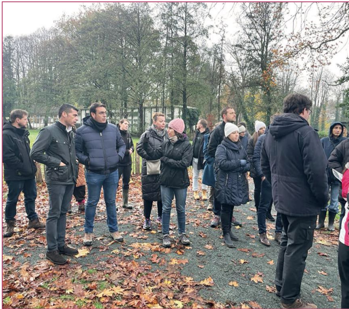
La delegación española en Bruselas.