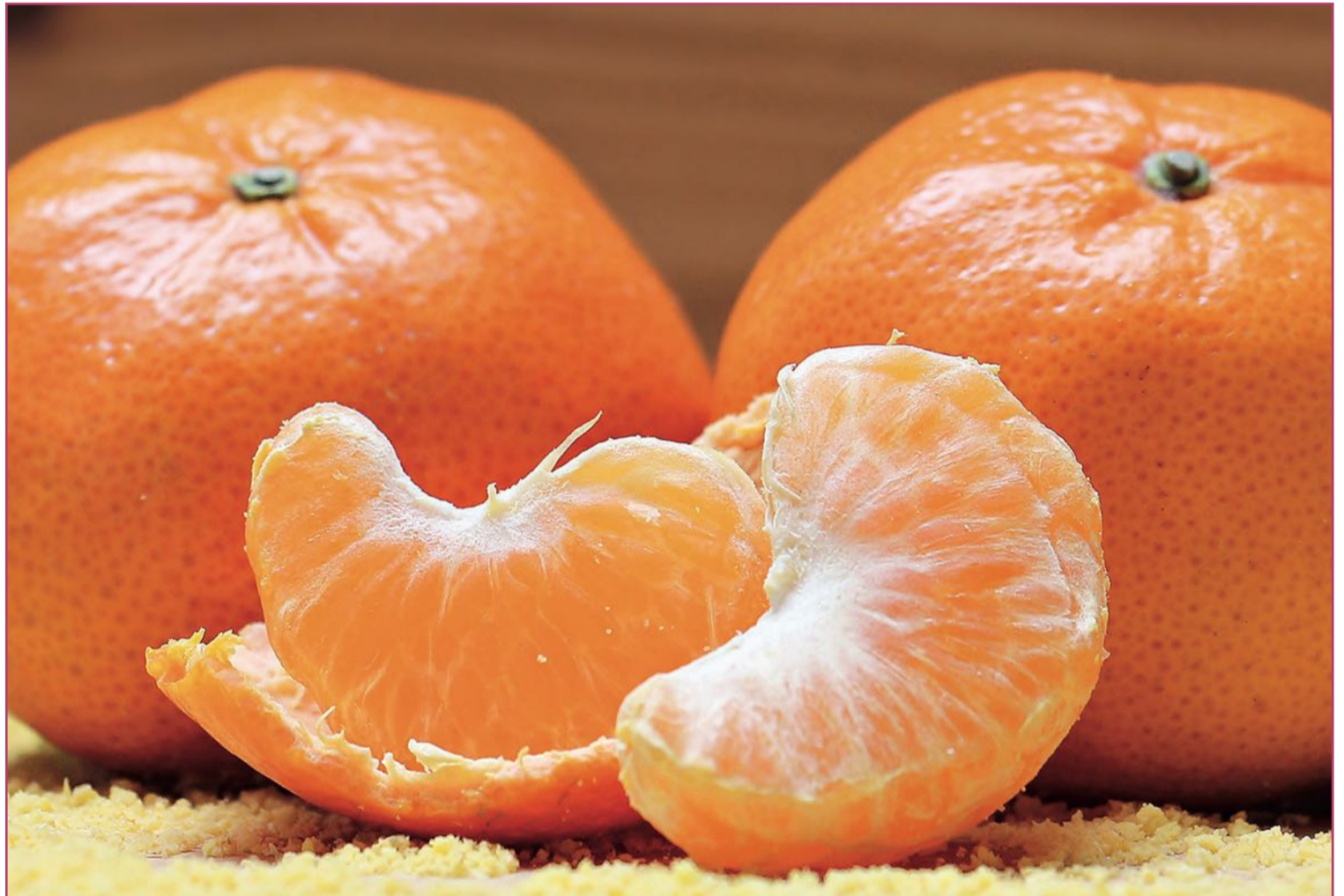
La mandarina continúa siendo uno de los cítricos con mejor cartel para la exportación.

Antes de continuar, aclaremos conceptos: ¿qué son cítricos? Todo un género (la principal clasificación taxonómica que anida entre familias y especies: orden, superfamilia, familia, subfamilia, tribu, subtribu, género, especie). Procedente del Asia tropical y la subtropical, en especial de China, en la actualidad agrupa un sinfín de especies,