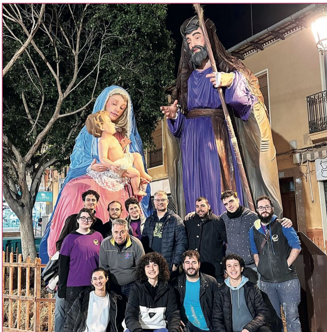
El equipo artístico que construyó el belén gigante.

«Estas obras artísticas contribuyen a recordar el sentido religioso de la Navidad»