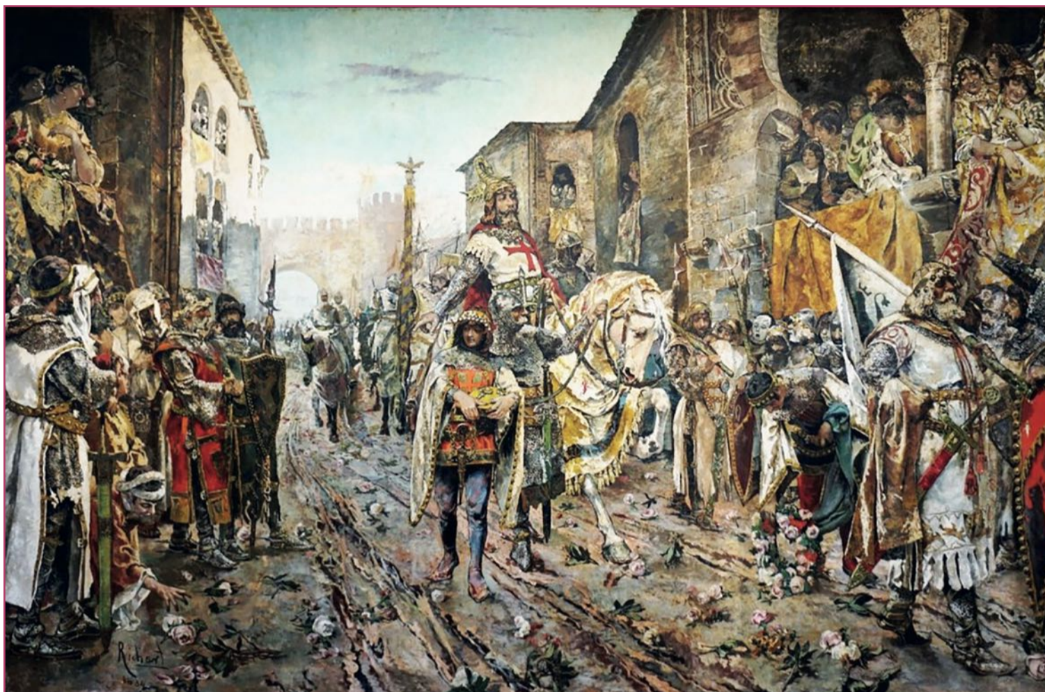
Imagen de Jaime I entrando triunfal en la ciudad de València.

Convertidos Jaime I y Alfonso X en poco más que polvo y