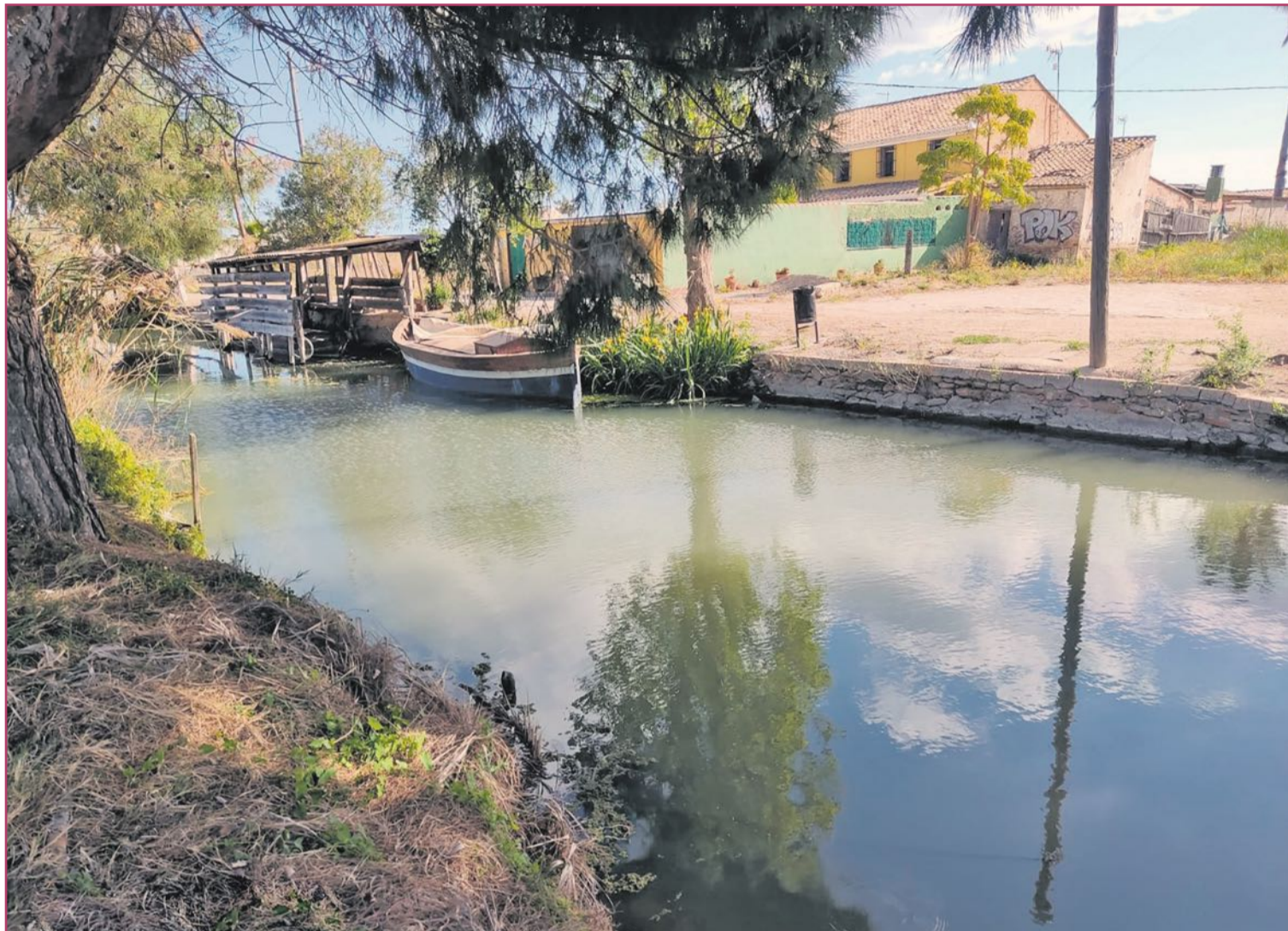
El embarcadero, desde el otro lado de la orilla.

Representa El Tremolar el clásico ejemplo de municipio urbano de l'Horta Sud diseminado y colindante entre varios municipios. Distintas administraciones municipales para un mismo espíritu, diríase. Con algunas casas situadas en Alfafar y otras en València es similar, a pequeña escala, con la situación de continuidad de Alfafar, Sedaví, Benetússer y Lloc Nou, del que ya hicimos un amplio reportaje en estas mismas páginas.