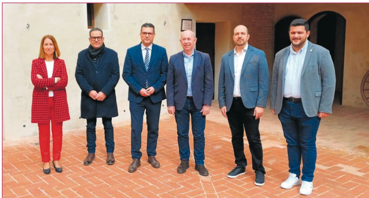
Encuentro de varios alcaldes de la comarca.

Si bien dicha dramática situación afortunadamente ya quedó atrás, desde entonces estos municipios han seguido colaboran-