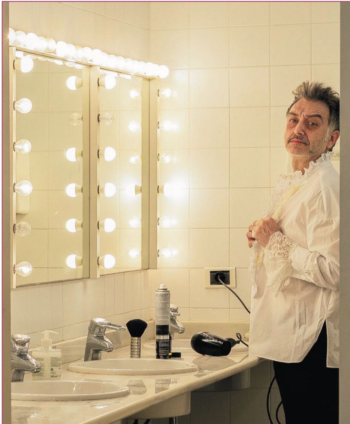
En el camerino previo a la función de 'El abrazo de los gusanos'.

Principalmente a nivel de castings, ahora mucho menos personal. La cámara se ha pue-