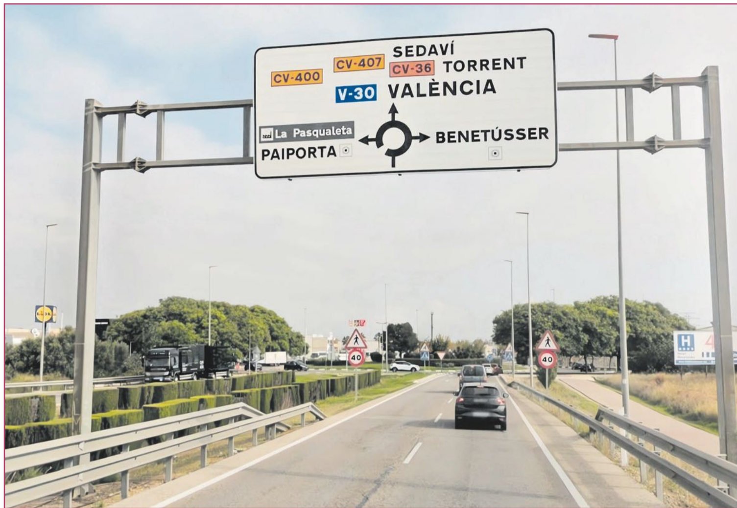
La intercomunicación en el área metropolitana es una necesidad fundamental.

¿Era necesario? La constitución del área metropolitana, como ya vimos ('Los populosos anillos de Saturno', agosto de 2023), ha sido un largo proceso que prácticamente arrancó con la misma fundación, allá por el 138 a.C., de la colonia Valentia Edetanorum (valor de los edetanos, de la Edetania: dos terceras partes de la provincia valenciana y el sur castellanense), la actual València capital.