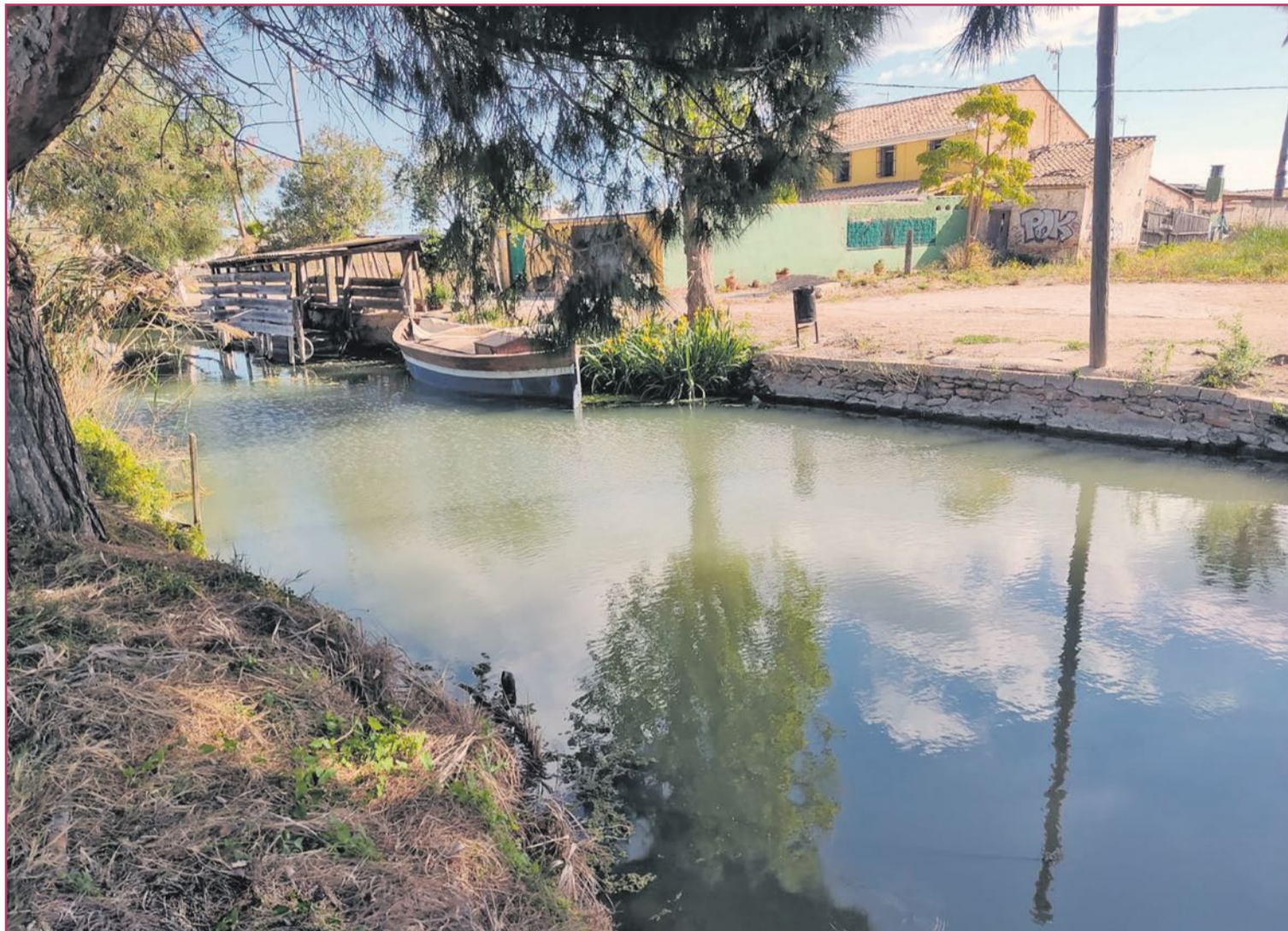
El embarcadero, desde el otro lado de la orilla.

Representa El Tremolar el clásico ejemplo de municipio urbano de l'Horta Sud diseminado y colindante entre varios municipios. Distintas administraciones municipales para un mismo espíritu, diríase. Con algunas casas situadas en Alfafar y otras en València es similar, a pequeña escala, con la situación de continuidad de Alfafar, Sedaví, Benetússer y Lloc Nou, del que ya hicimos un amplio reportaje en estas mismas páginas.