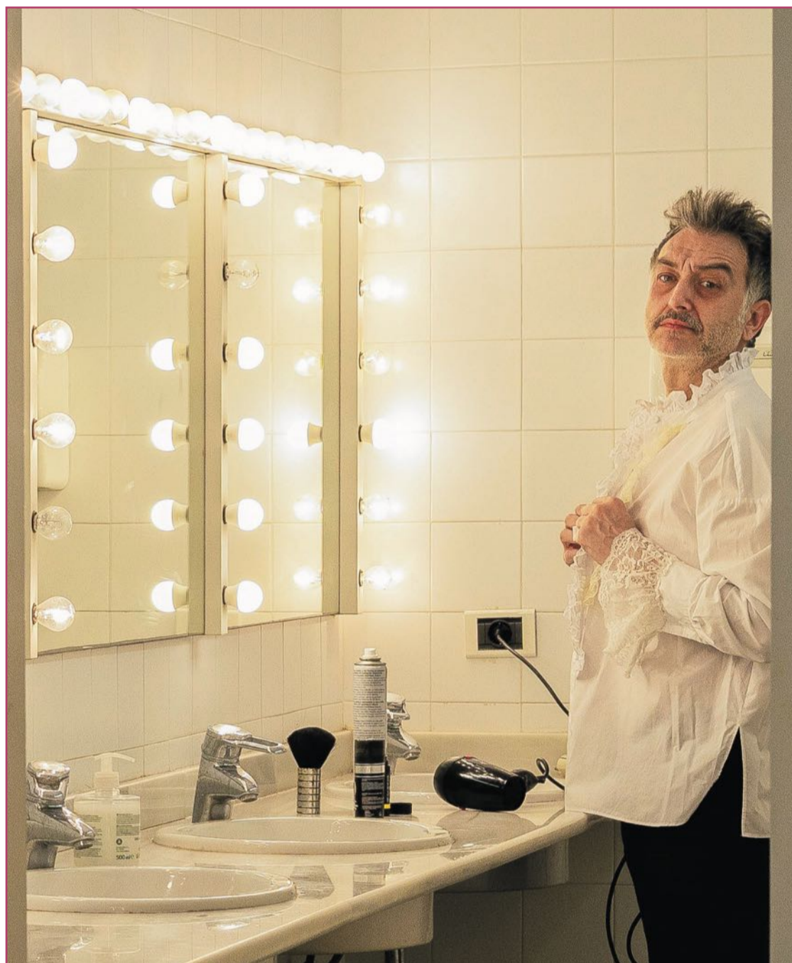
En el camerino previo a la función de 'El abrazo de los gusanos'.

Principalmente a nivel de castings, ahora mucho menos personal. La cámara se ha pue-