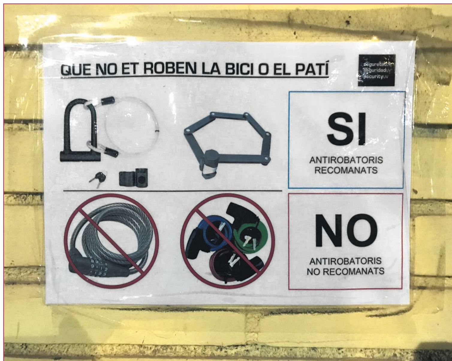
Cartel en la Facultad de Derecho con consejos de la Universitat de València.

Coincidencia o no, también hay colores más atractivos al robo según los datos. De todas las denuncias, el negro sobresalió al ser el tono de bicicleta más común en las denuncias