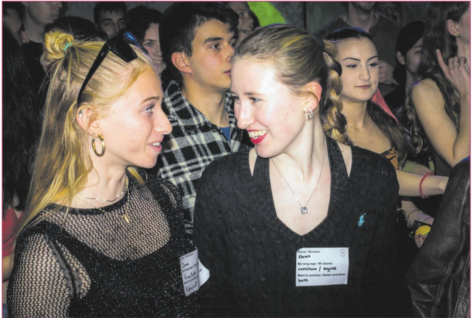
Dos extranjeras en un evento promovido en València para fomentar el intercambio de idiomas.

El sector privado reaccionó rápido. Por otro lado, el sector educativo ha ampliado sus líneas de docencia multilingüe en inglés, francés y alemán, tanto a nivel escolar como a nivel universitario. Los grados para extranjeros se han multiplicado