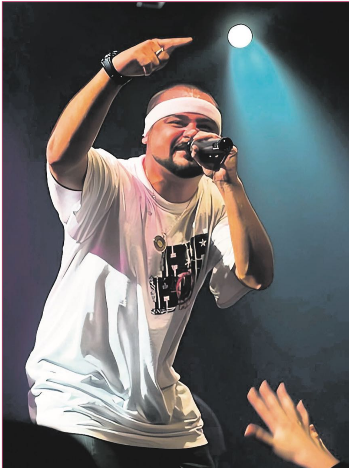
El alicantino Nach, durante uno de sus multitudinarios conciertos.

Según la mayoría, la cosa viene de ‘rythm and poetry’ (ritmo y poesía) o ‘recite a poem’ (recita un poema), o según sus detractores de ‘cháchara’ (palabrerío sin fin). En realidad, todo esto es una parte de la verdad,