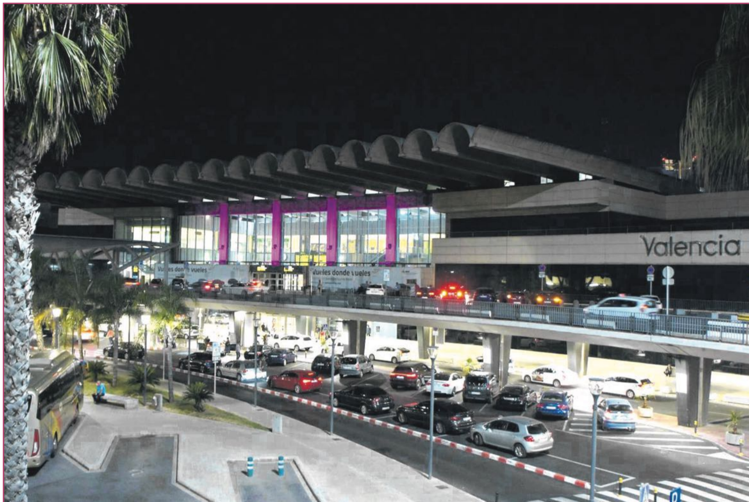
Los aeropuertos de la Comunitat, como el de València-Manises, se han convertido en importante lazo de unión con el mundo.

En 1933, pese a la crisis, València contaba con una fuerte burguesía