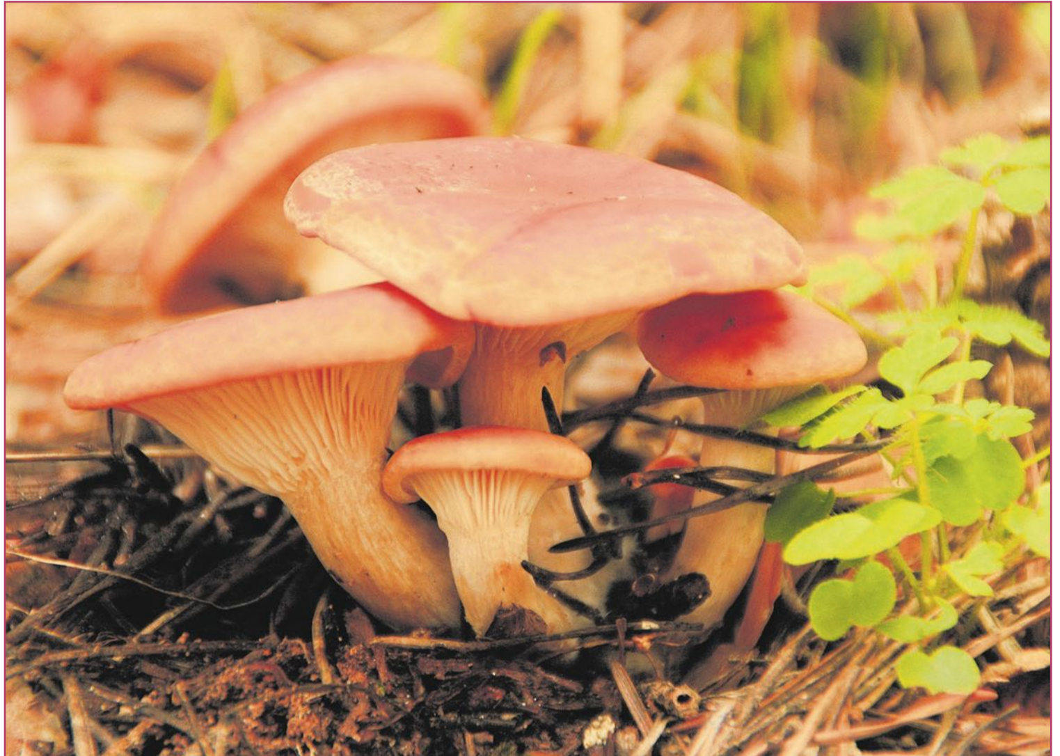
Los robellones son una de las setas estrella en la Comunitat Valenciana | Miguel Ángel García

España queda, eso sí, en buen lugar: el tercero europeo, tras Polonia y los Países Bajos (juntos, la mitad de la producción europea). Unas 130.700 toneladas anuales, según últimos recuentos. Pero esto en cuanto a setas cultivadas (un 90% el