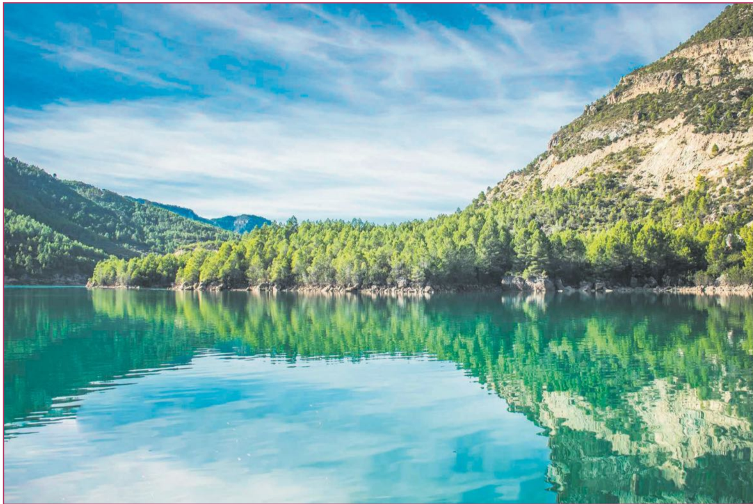
Cofrentes queda como el geotermal testigo de un antiguo volcán.

La otra es la ibérica, nacida hoy en la burgalesa La Bureba y asomada casi al mar por entre las provincias de València y Castellón. Pensemos en las poderosas fuerzas que agitaron entonces la hoy Comunitat Valenciana. Esa lucha contra el Mediterráneo, arrugando el manto peninsular, empujando, empujando más. Venía de lejos: de hace unos 575 millones de años, tenemos más movimiento aún, en pleno Precámbrico (entre 5.000 millones y 570 millones de años).