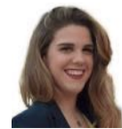
Alba Berenguer CORRECCIÓN DE TEXTOS