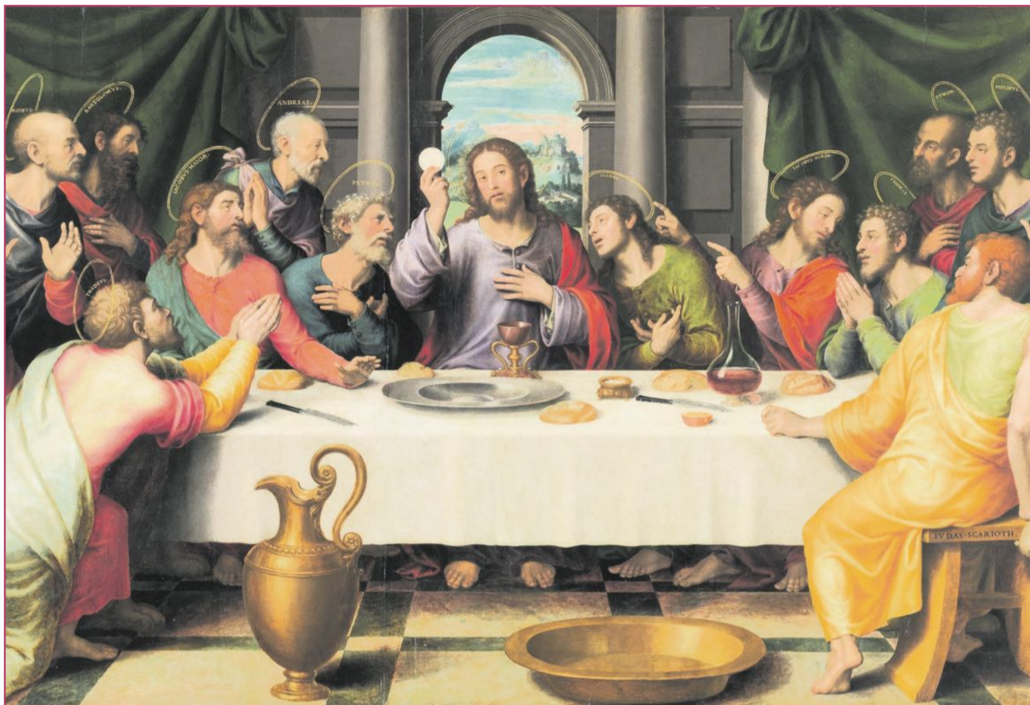
La 'Santa Cena', de 1562, actualmente en el Museo del Prado, es una de las cumbres pictóricas de Juan de Juanes.

Su estilo acabó sirviendo de plantilla por estos lares