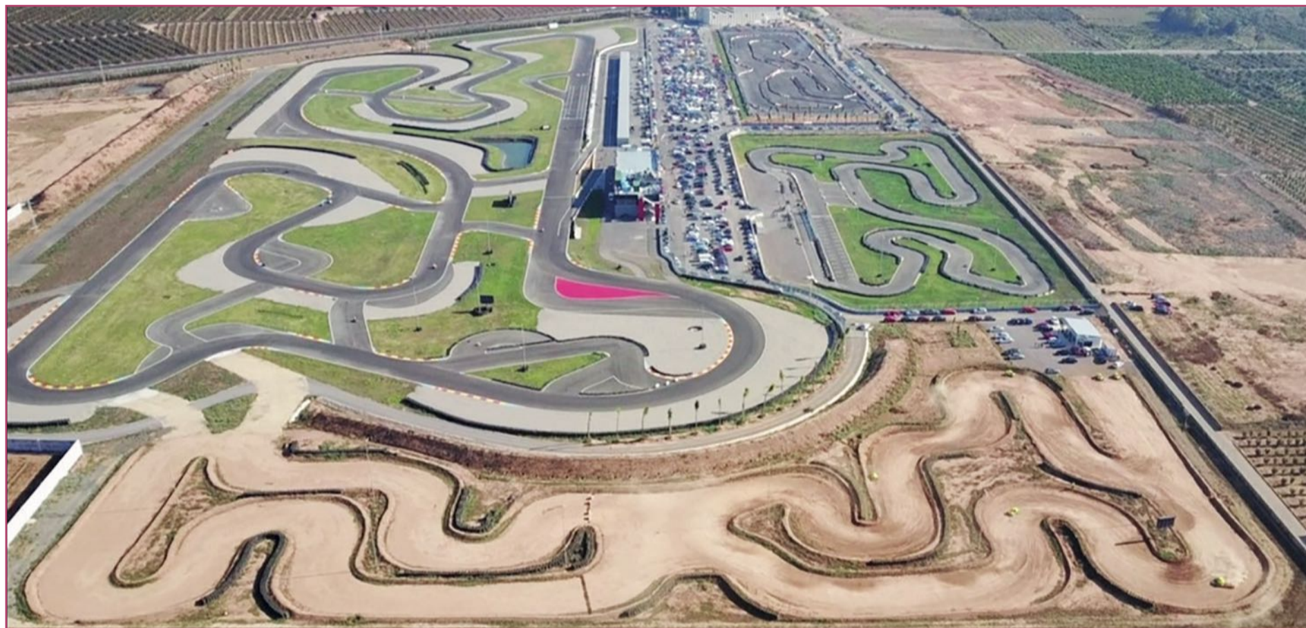
Imagen general del Aspar Circuit.

Anteriormente denominado Circuit de la Ribera, ahora es propiedad del legendario piloto de Alzira