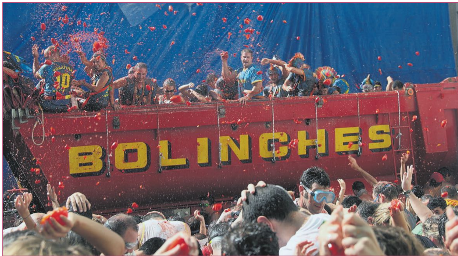
Tomatina de Buñol.

Dicha localidad cuenta también con sus Moros y Cristianos