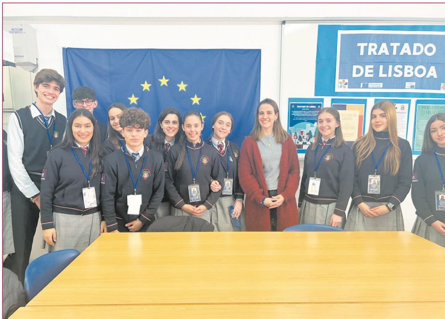
Alumnos del Colegio Diocesano San Juan Bautista de Alicante.

Persigue que los jóvenes tengan un conocimiento activo de la Unión Europea y el Parlamento Europeo