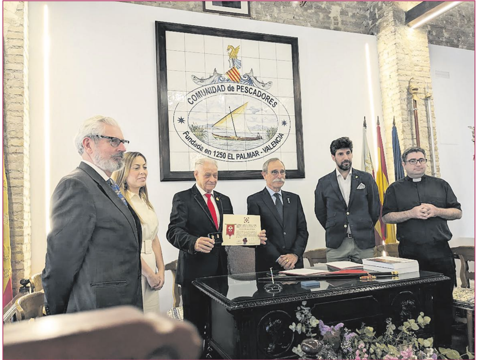
La concesión de la medalla 650 Aniversario a la Cofradía de Pescadores de El Palmar entra en las actividades de reivindicación de nuestra cultura.

Como recuerda el profesor, también miembro de la Real Academia de Cultura Valenciana, la bandera es algo fundamental para cualquier ejército: “si se pierde o se toma, se pierde la batalla”. De esta forma, la senyera también necesitó del suyo propio. Desde los mismos tiempos de Jaime I: “hombre, hoy sabemos que Jaime I instituyó la bandera, y que ya existía el cuerpo correspondiente, pero oficialmente arranca por privilegio real de Pedro IV el 3 de junio de 1365”.