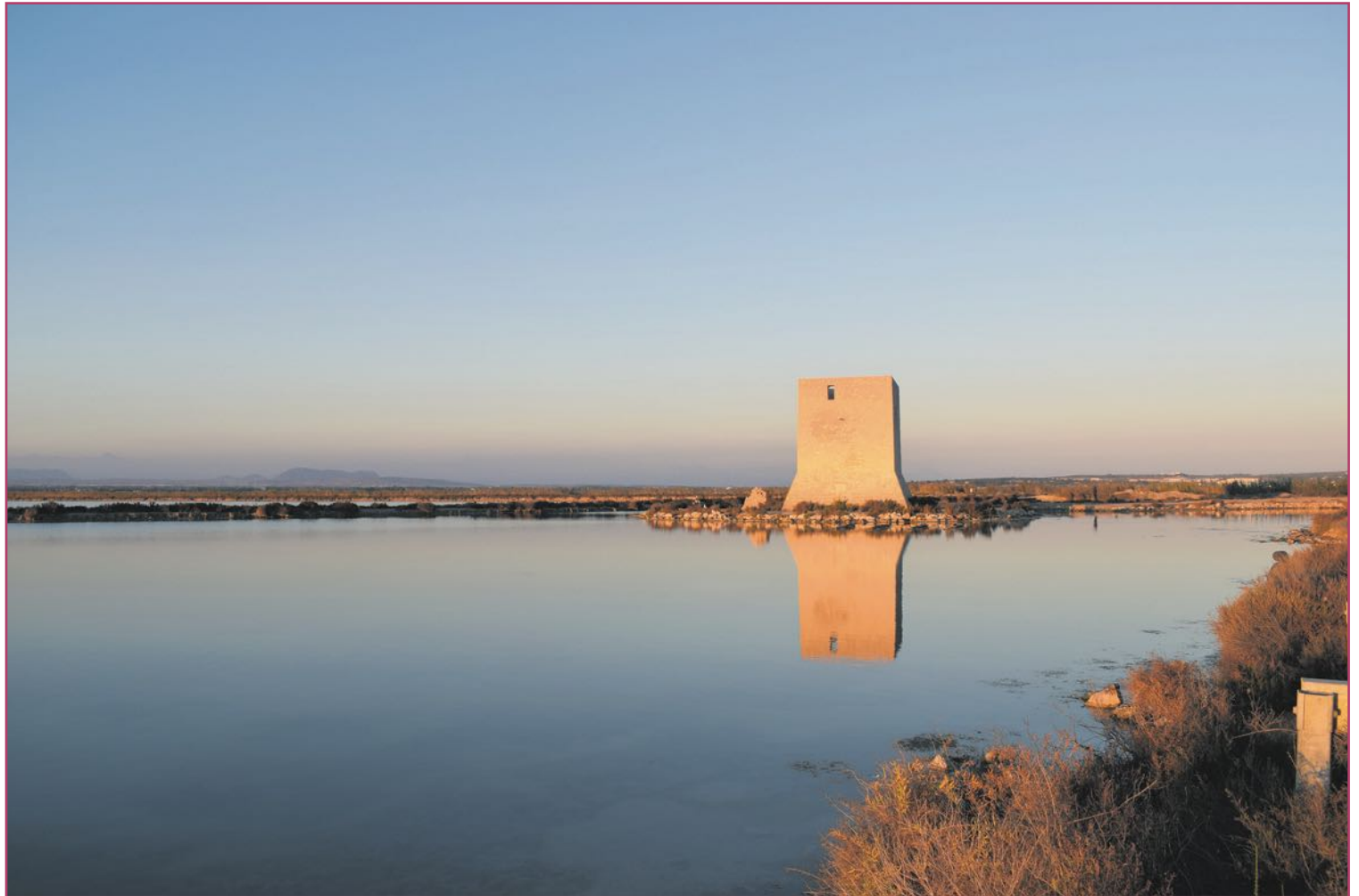
Las salinas santapoleras, un espacio natural cuyo ayuntamiento firmó el Pacto de los Alcaldes.

Los años setenta trajeron asuntos como la crisis energética de 1973