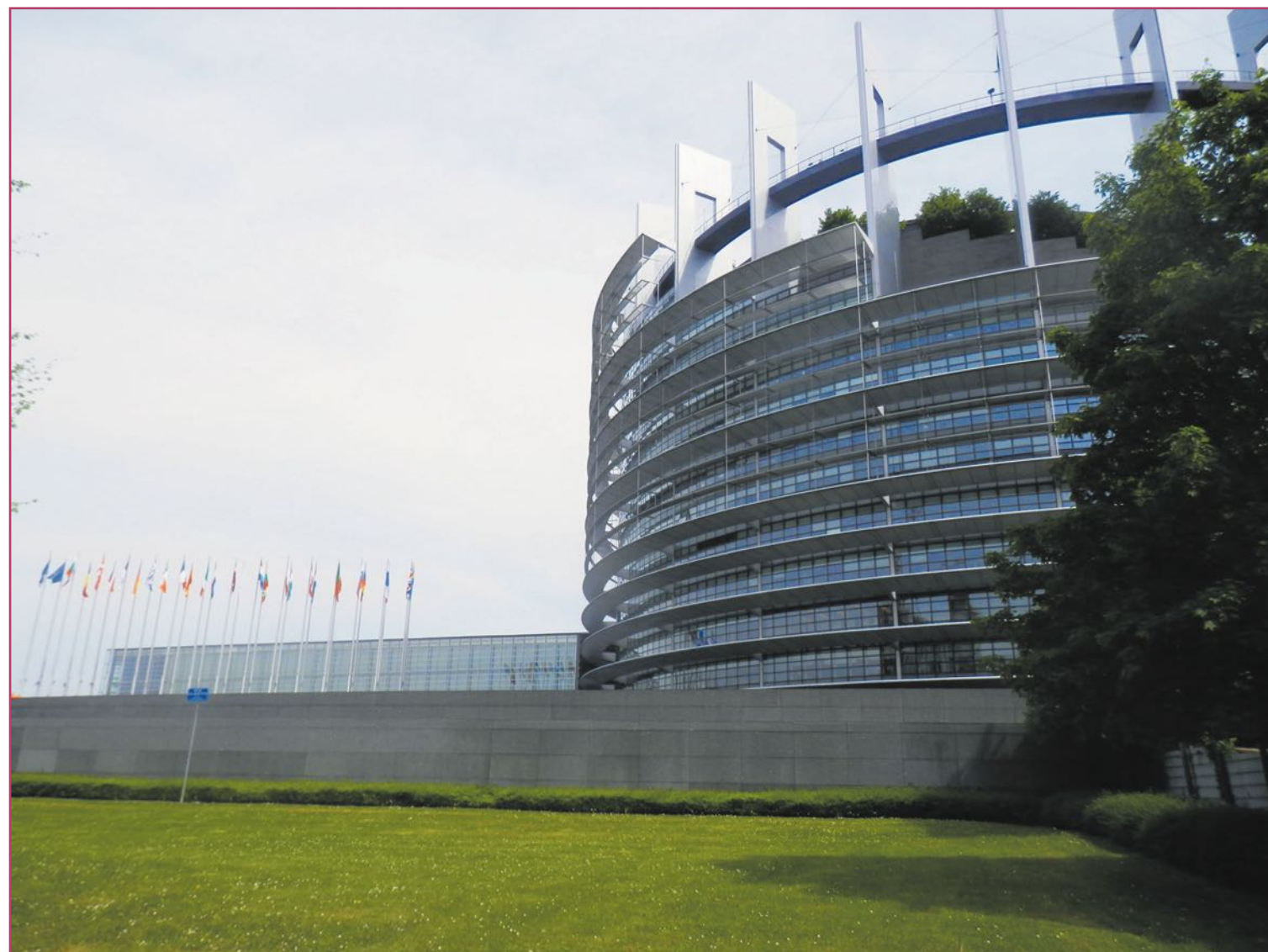
Exterior de la sede del Parlamento Europeo en Estrasburgo.