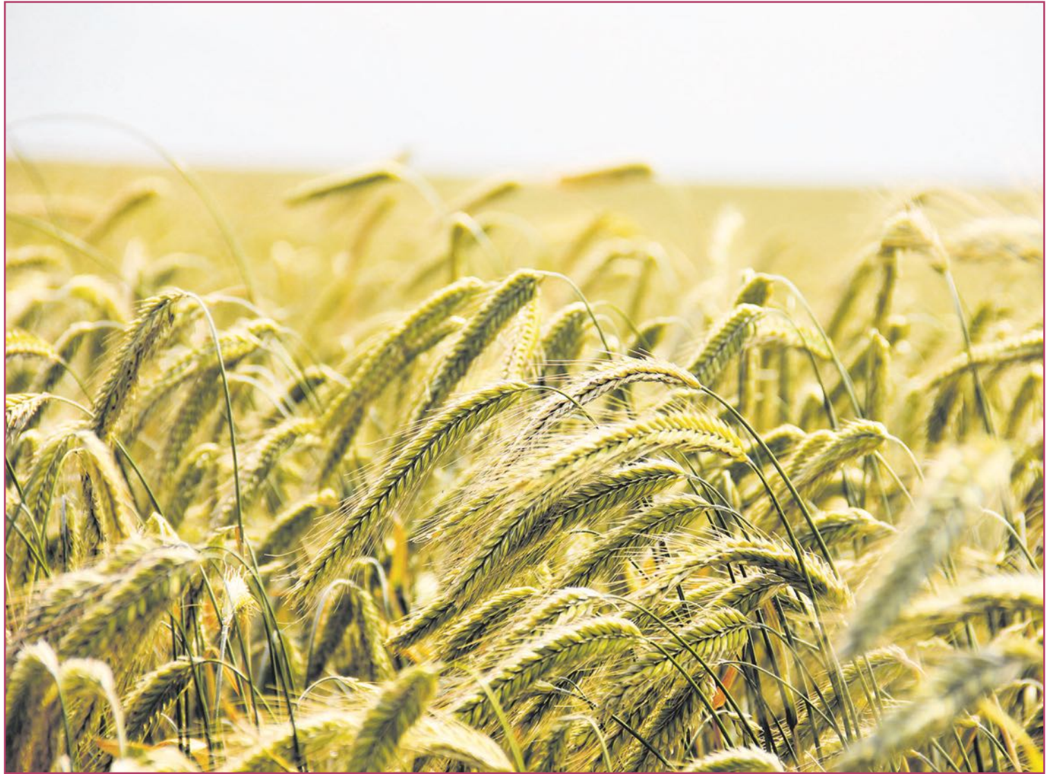
El trigo se ha convertido en un cereal indispensable para nuestras mesas.

Aunque, globalmente, siendo importante la capacidad cerealista de los campos autóctonos (arroz incluido), la Comunitat Valenciana se encuentra alejada, por ejemplo, de las grandes zonas dedicadas a ello en España: Castilla y León, Castilla-La Mancha y Aragón. La producción europea está liderada por Francia, Alemania y Polonia (Ucrania fue apeada de este carro de manera