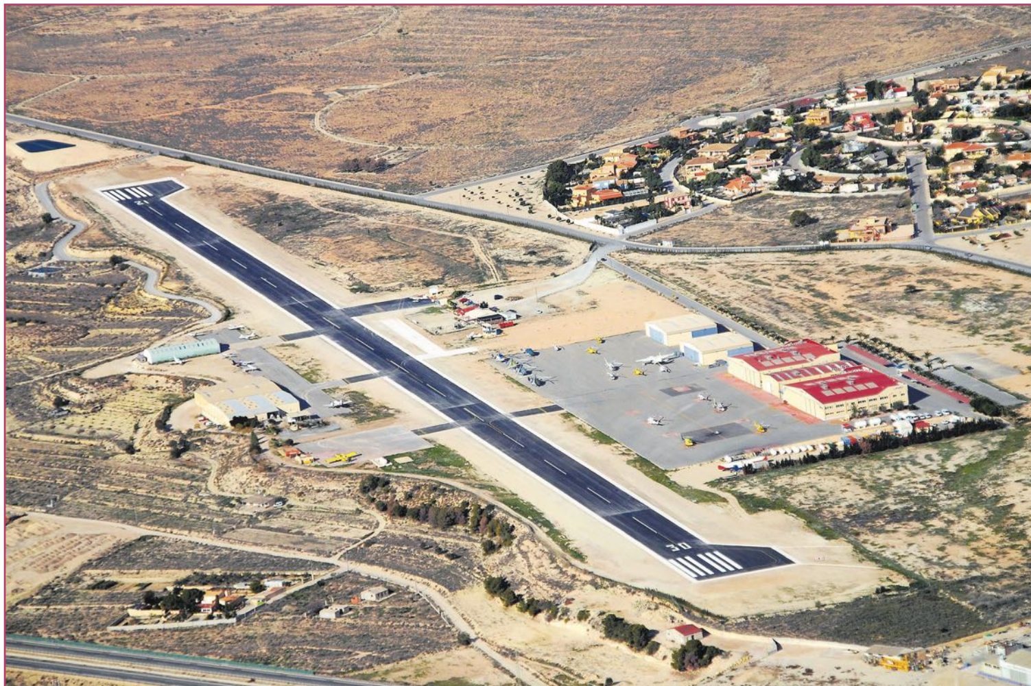
Un aeródromo siempre supone una inversión, más si se trata de instalaciones como las de Mutxamel | Aeródromo de Mutxamel

Ahora bien, ¿bajo qué criterios distinguimos aeródromo de aeropuerto? Para la Real Academia Española de la Lengua (RAE), un aeropuerto es un “área destinada al aterrizaje y despegue de aviones dotada de instalaciones para el control del tráfico aéreo y de servicios a los pasajeros”. ¿Y un aeródromo? “Terreno llano provisto de pistas y demás insta-