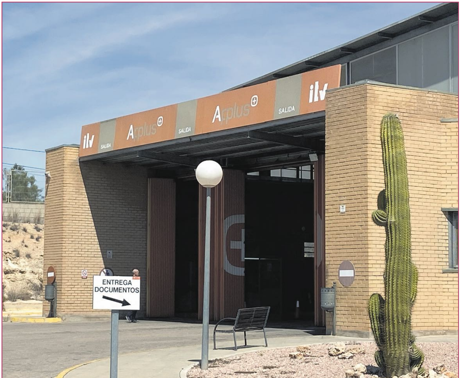
Muchos meses después aún siguen los identificativos de la concesionaria anterior.

Montes anunció la contratación de noventa inspectores fijos, para equiparar la plantilla de Sitval