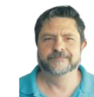
Fede Romero MAQUETACIÓN