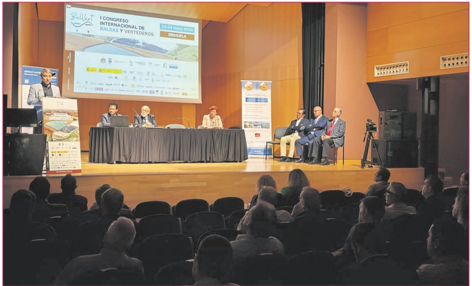
I Congreso Internacional de Balsas y Vertederos (23 de mayo).

Tenemos un cronograma anual, y ahora estamos en los seis meses centrales desde la primavera hasta septiembre. Además, si se detecta algún brote también se intensifican