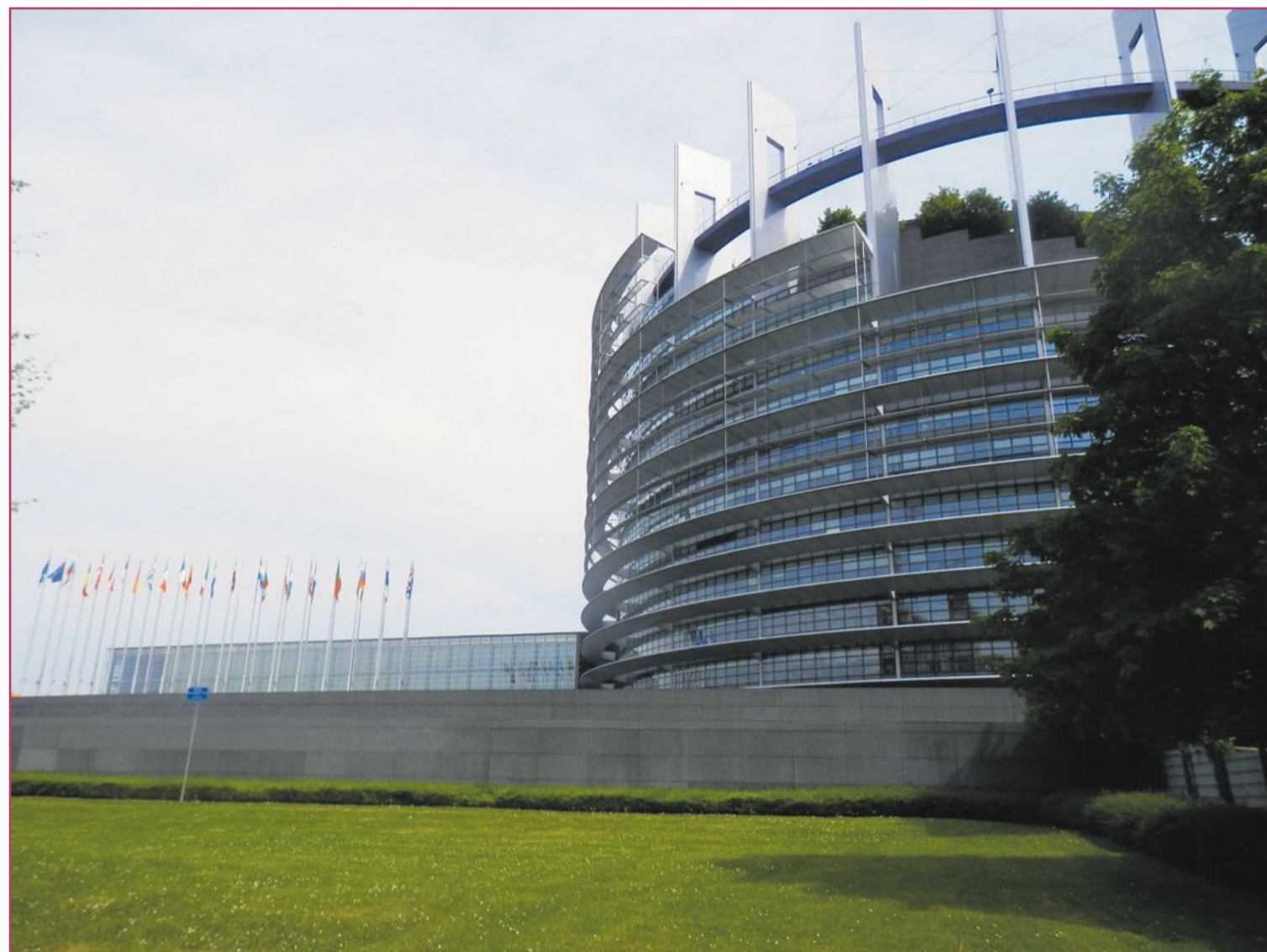
Exterior de la sede del Parlamento Europeo en Estrasburgo.