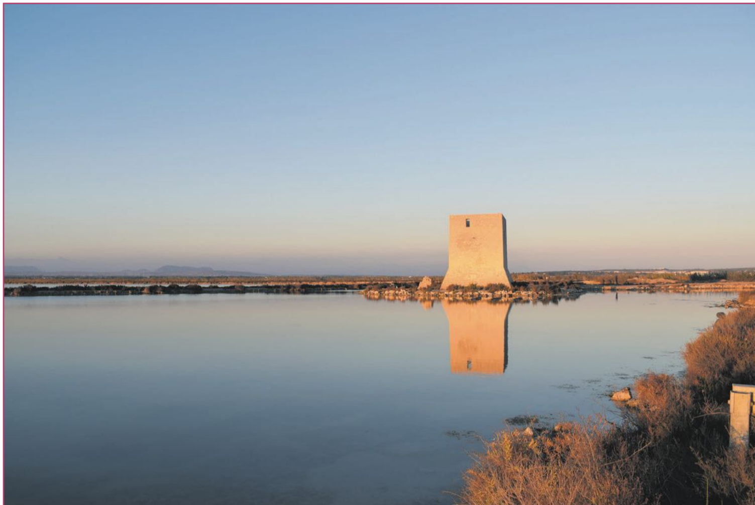
Las salinas santapoleras, un espacio natural cuyo ayuntamiento firmó el Pacto de los Alcaldes.

Los años setenta trajeron asuntos como la crisis energética de 1973