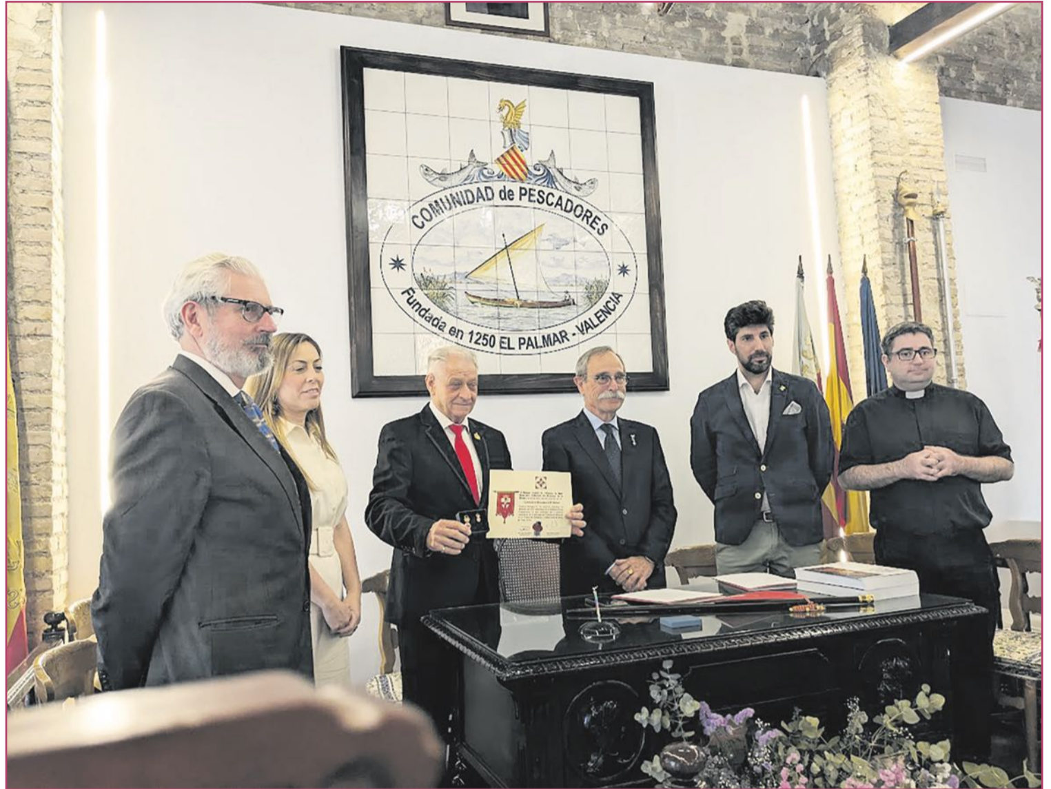
La concesión de la medalla 650 Aniversario a la Cofradía de Pescadores de El Palmar entra en las actividades de reivindicación de nuestra cultura.

Como recuerda el profesor, también miembro de la Real Academia de Cultura Valenciana, la bandera es algo fundamental para cualquier ejército: “si se pierde o se toma, se pierde la batalla”. De esta forma, la senyera también necesitó del suyo propio. Desde los mismos tiempos de Jaime I: “hombre, hoy sabemos que Jaime I instituyó la bandera, y que ya existía el cuerpo correspondiente, pero oficialmente arranca por privilegio real de Pedro IV el 3 de junio de 1365”.