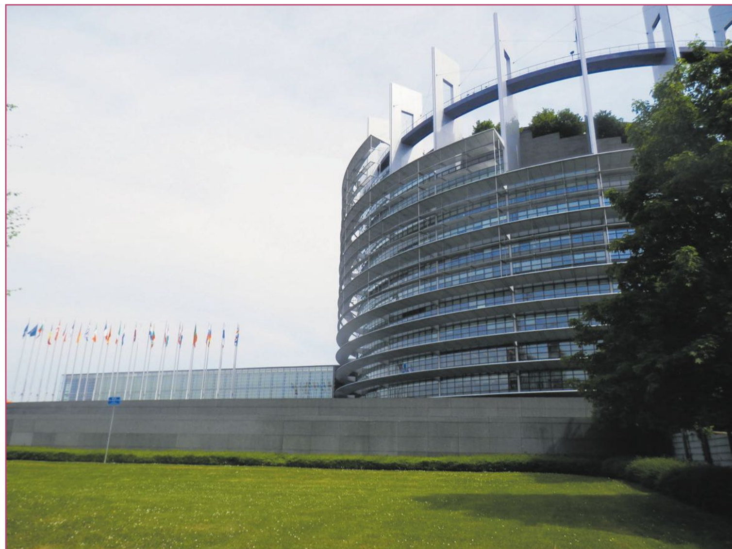
Exterior de la sede del Parlamento Europeo en Estrasburgo.