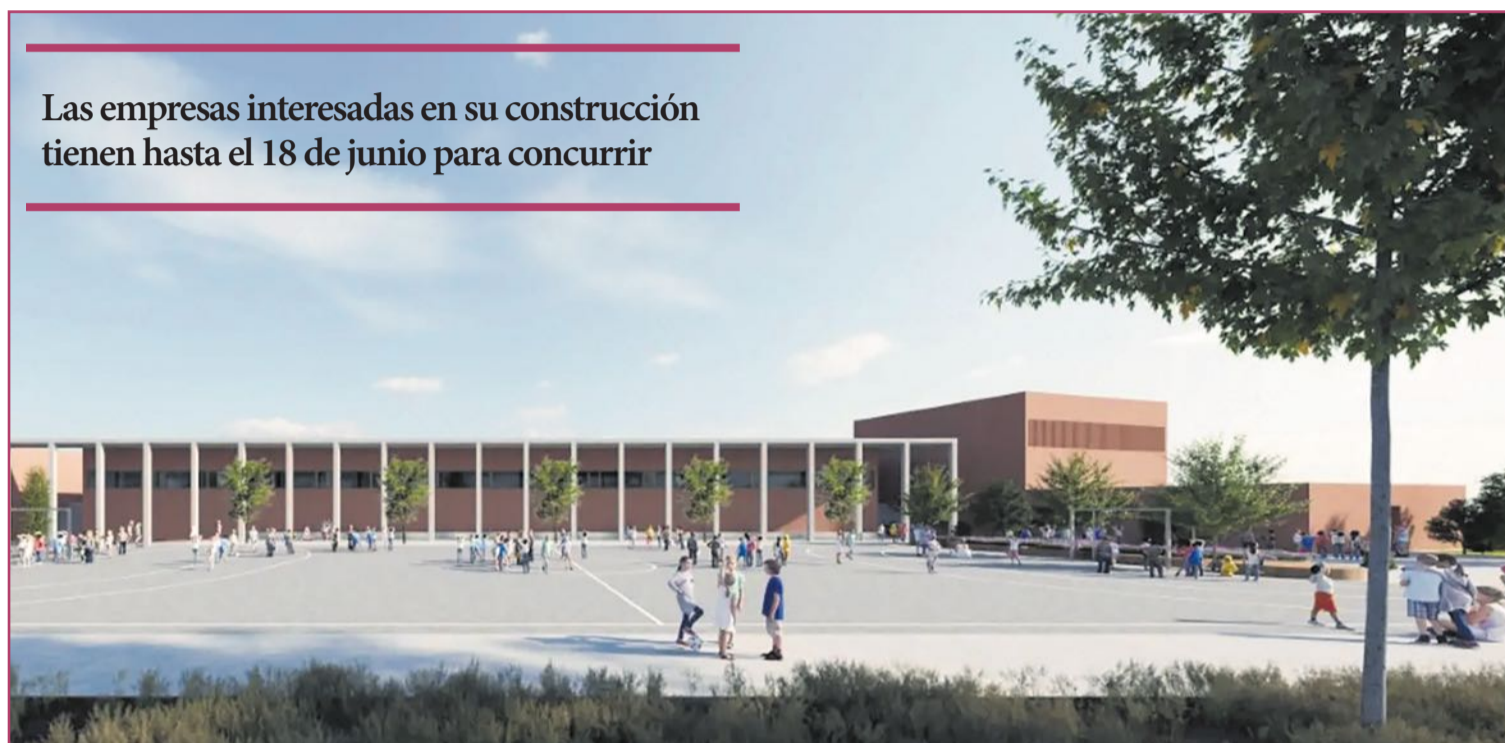
Recreación del futuro colegio Hispanidad.

Sin embargo dicha provisionalidad está durando ya más de una década. Cuando por fin la Conselleria de Educación presupuestó 4,1 millones de euros en 2021, a través del Plan Edificant, para construir el nuevo colegio, la vertiginosa inflación provocó que dicha cantidad se quedara insuficiente y hubiera que rei-