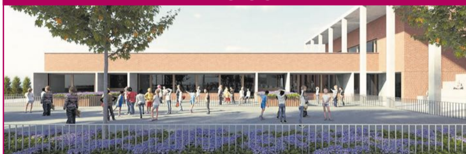
Desde el Ayuntamiento de Santa Pola se espera que el nuevo colegio Hispanidad esté funcionando para el curso 25-26, junto al segundo colegio de Gran Alacant. Págs. 30 y 31