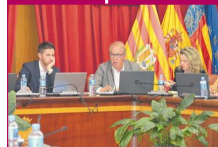
Los presupuestos municipales fueron aprobados en el pleno del pasado 6 de mayo. Págs. 2 y 3