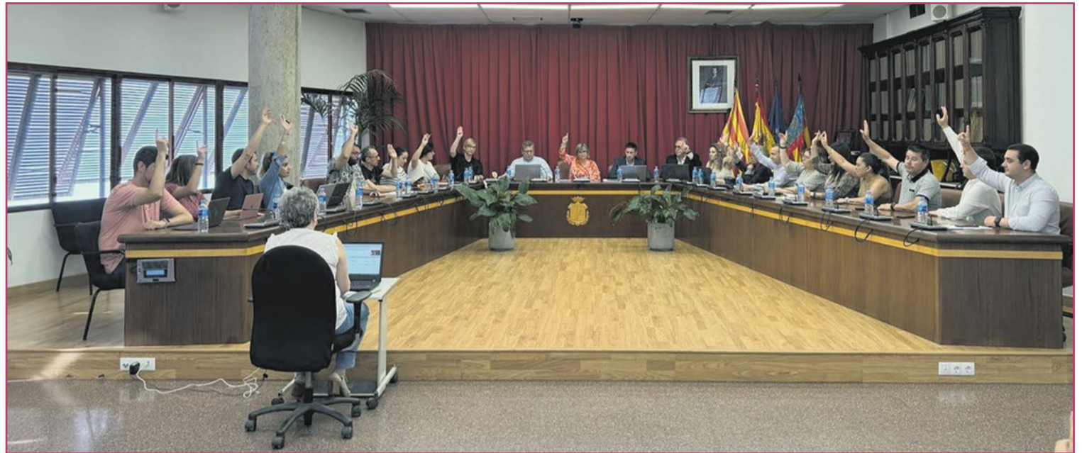
Aprobación en el pleno municipal de la licitación de la construcción del CEIP Hispanidad.

Mientras tanto algunos adolescentes de Gran Alacant ya están dando clases sin necesidad de trasladarse al casco urbano santapolero, dado que desde este curso se habilitaron unos módulos -conocidos popularmente como 'barracones'- en la zona de Monte Faro donde se imparten clases de primero, segundo y tercero de ESO. La idea