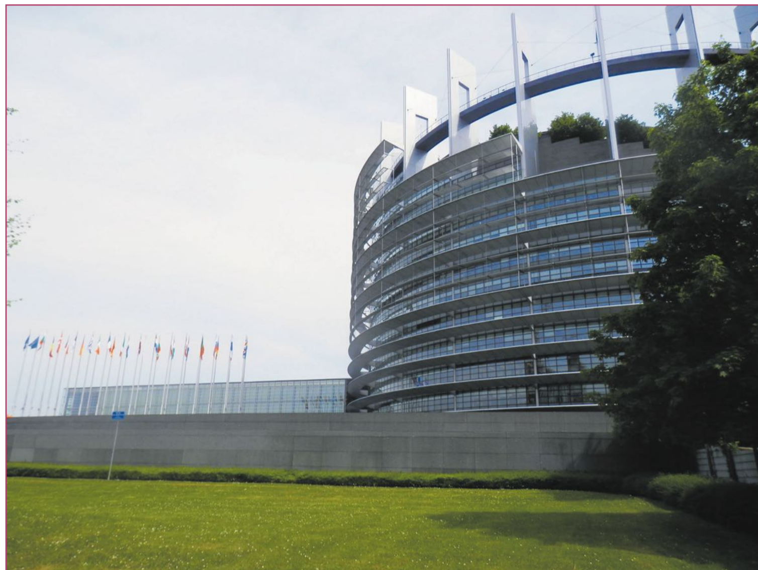
Exterior de la sede del Parlamento Europeo en Estrasburgo.