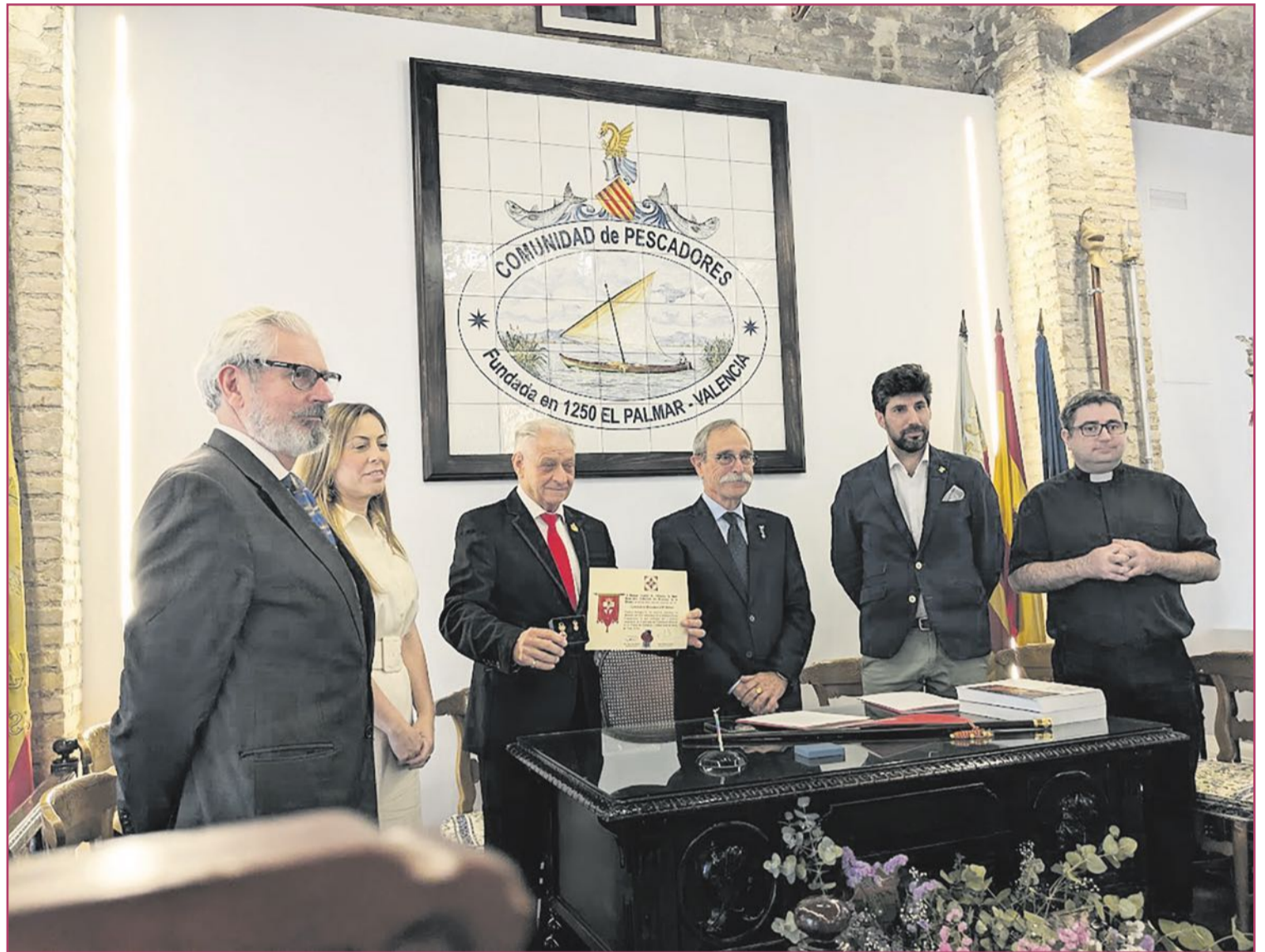
La concesión de la medalla 650 Aniversario a la Cofradía de Pescadores de El Palmar entra en las actividades de reivindicación de nuestra cultura.

Como recuerda el profesor, también miembro de la Real Academia de Cultura Valenciana, la bandera es algo fundamental para cualquier ejército: “si se pierde o se toma, se pierde la batalla”. De esta forma, la senyera también necesitó del suyo propio. Desde los mismos tiempos de Jaime I: “hombre, hoy sabemos que Jaime I instituyó la bandera, y que ya existía el cuerpo correspondiente, pero oficialmente arranca por privilegio real de Pedro IV el 3 de junio de 1365”.