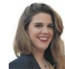
Alba Berenguer CORRECCIÓN DE TEXTOS