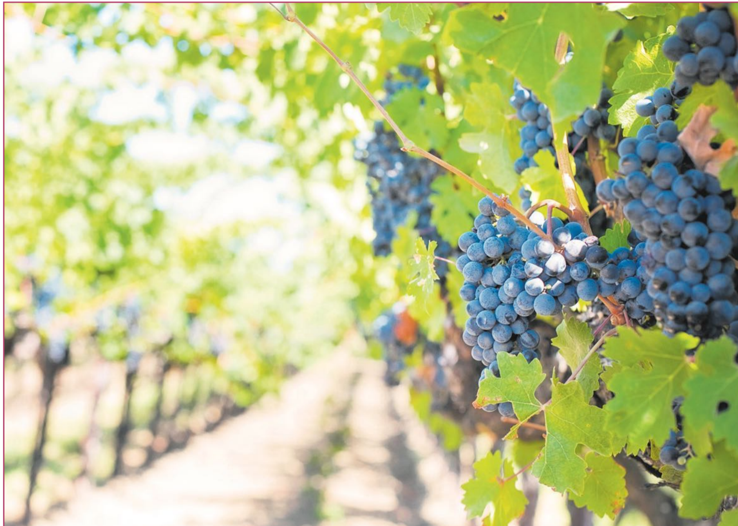
Son varias las zonas por denominación de origen que aparecen sembradas en nuestra Comunitat.

En el Imperio romano, por ejemplo, lo deglutían generosamente. Se llegaron a consumir, aseguran las crónicas (basadas en los registros comerciales y