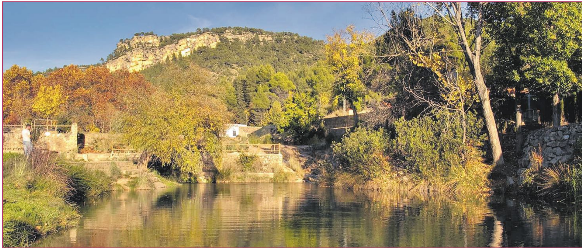
El azud de Tuéjar, un ejemplo de piscina natural con gran afluencia turística | Turisme Comunitat Valenciana

Las piscinas públicas, naturales o artificiales, suponen una generosa oferta paralela a la masificación turística que inunda nuestras playas