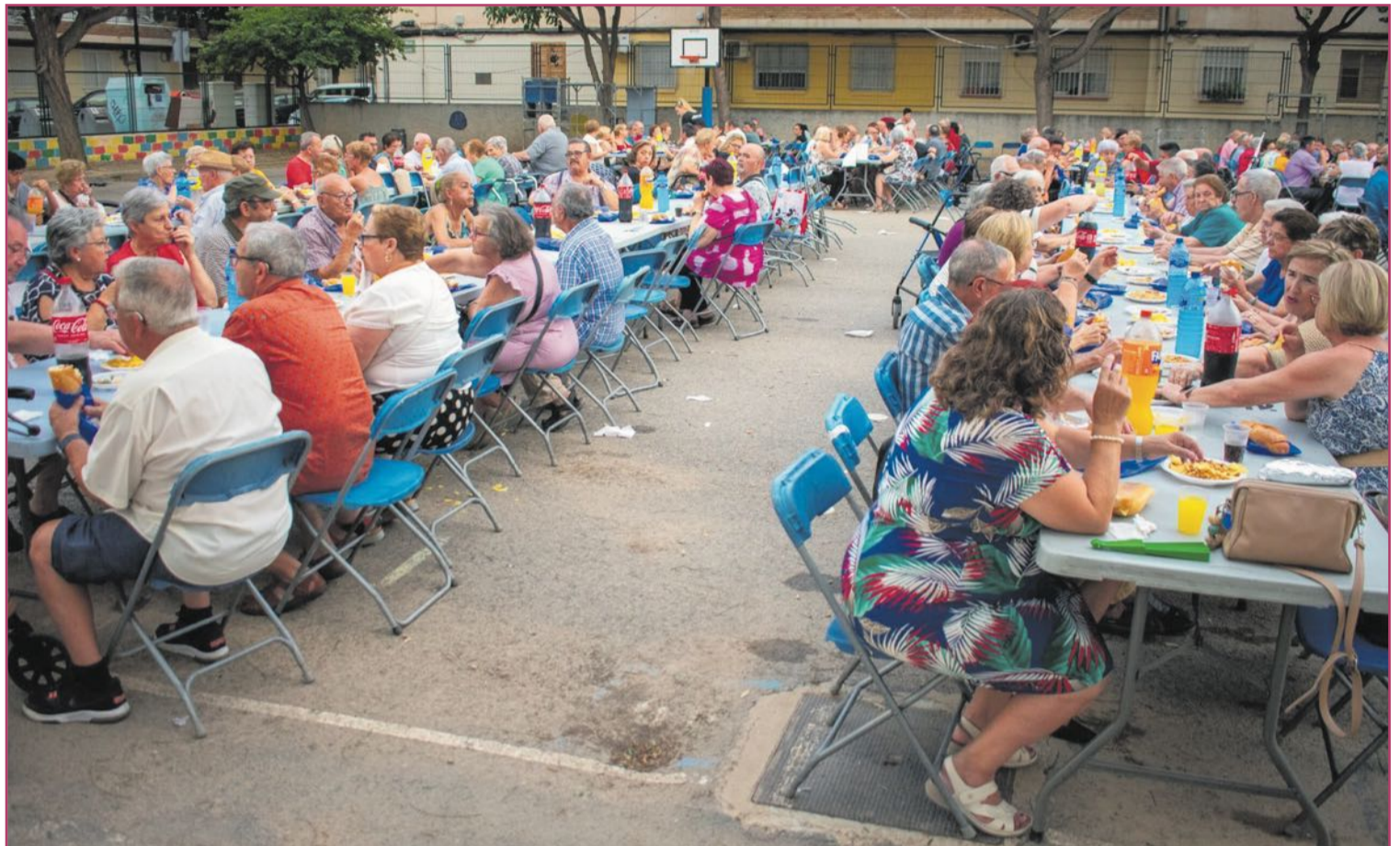
'Sopar d'entrepà' dedicado a la tercera edad.

En la jornada posterior se organizará un torneo de ajedrez. Además esa noche habrá un 'sopar d'entrepà' con baile en el colegio Orba dirigido a la tercera edad, y se proyectará al aire libre,