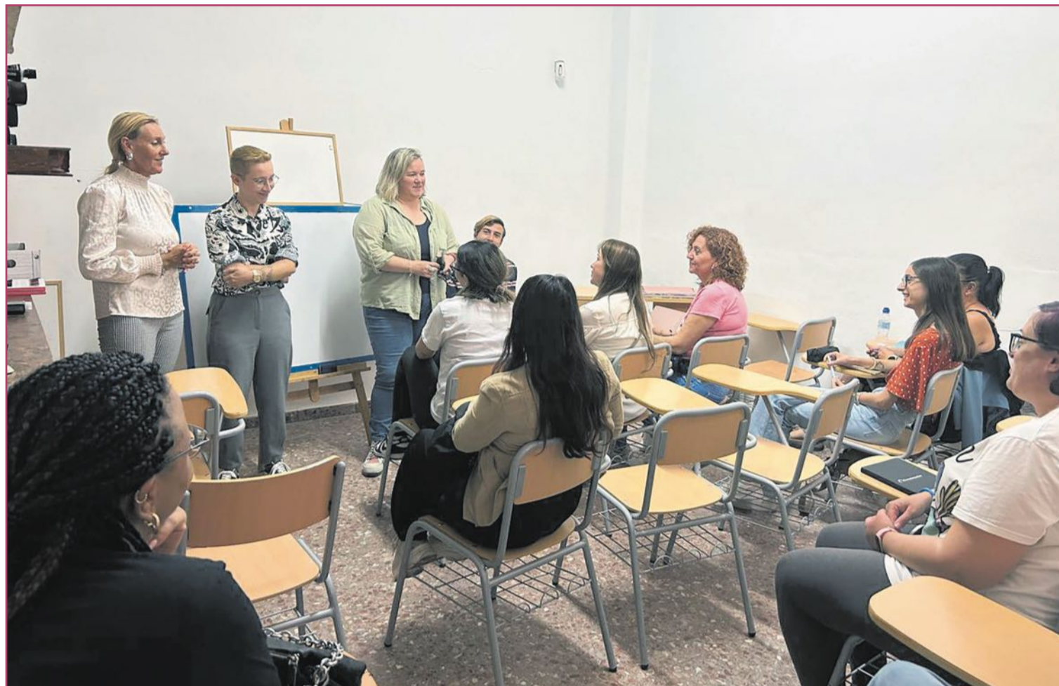
Vecinos de Alfafar participando de una de las charlas de la ADL.

Estos 'tips' (consejos/trucos) también abordan el campo léxico adecuado: “Es importan-