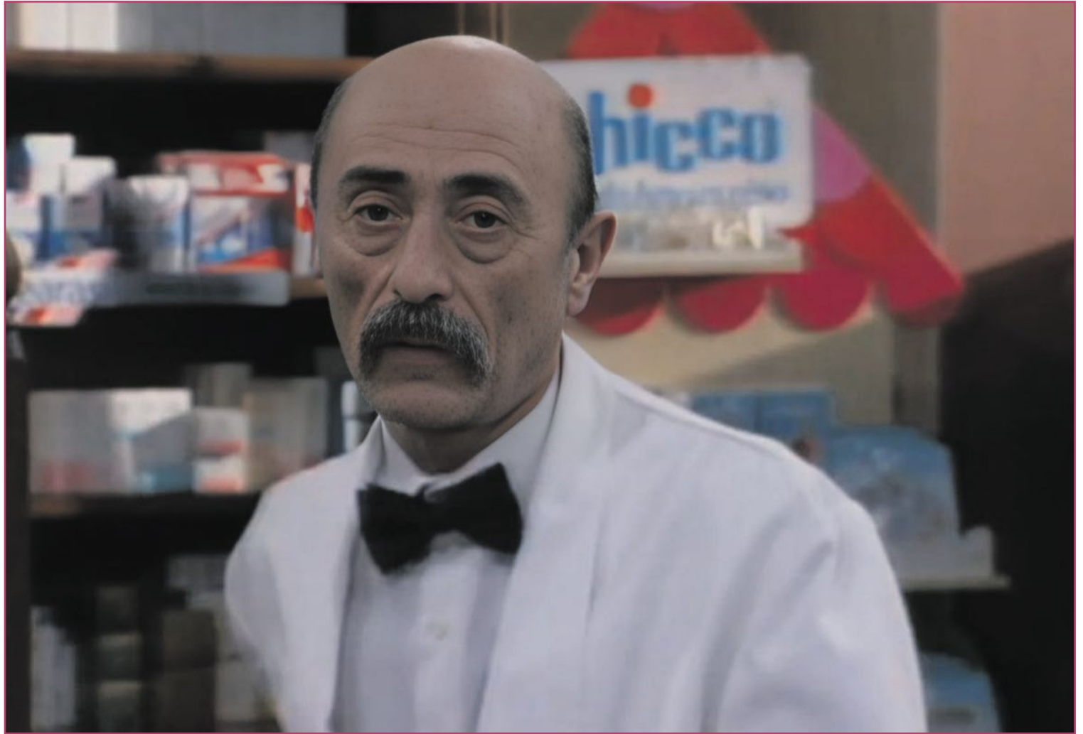
Un momento de su participación en la serie de televisión 'Farmacia de guardia'.

En este caldo de cultivo cultural (añadamos también la otra sala teatral paternerera, la Antonio Ferrandis, el Gran Teatro de