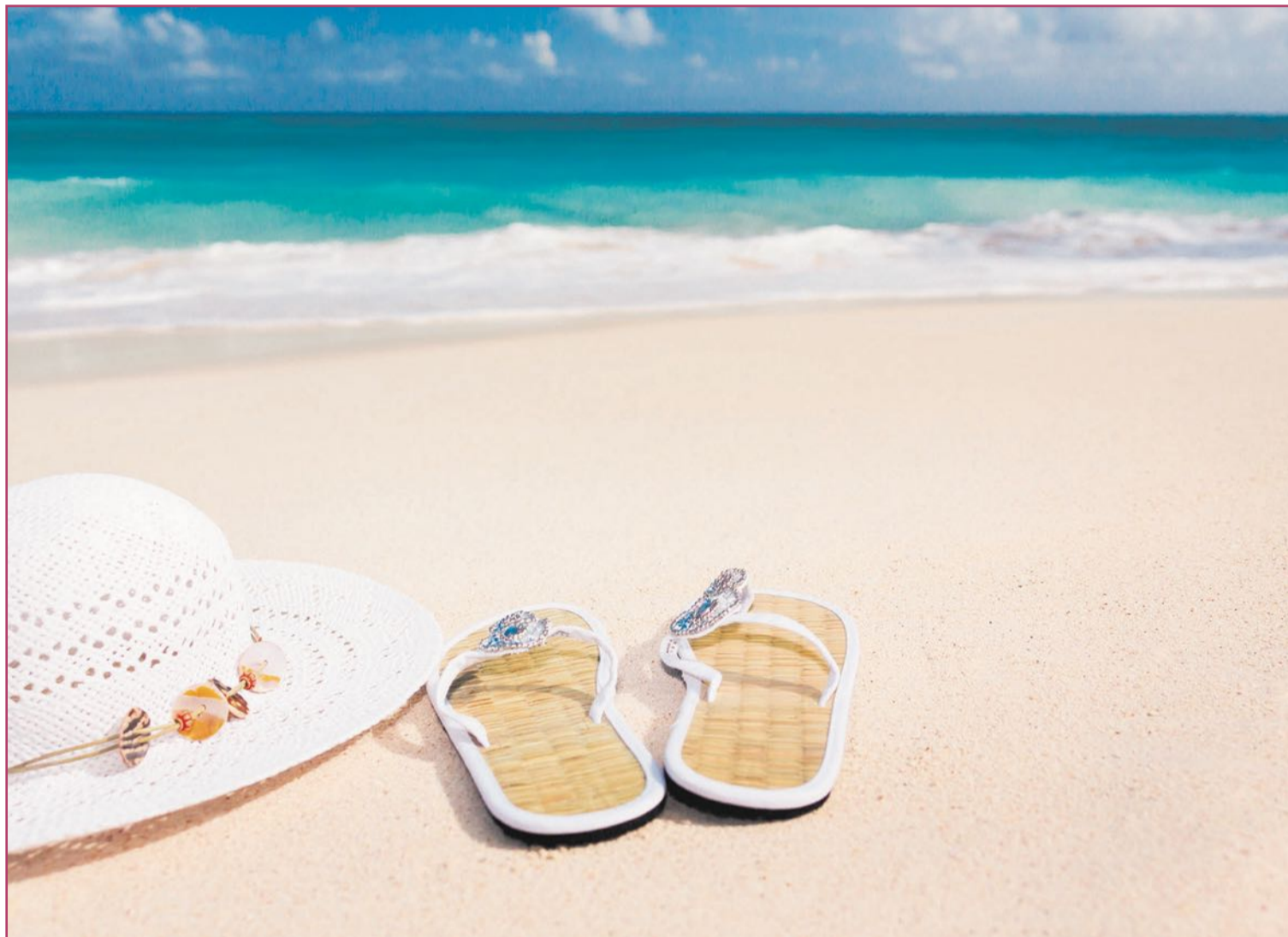
Existe un montón de adminículos necesarios para pasar un buen día de playa.

No lo tenemos fácil cuando hablamos de un censo de la industria turística. Repitamos: no nos referimos a la habitual, restauración y hostelería, sino a quiénes fabrican o nos venden esos productos concretos que compramos, además de en