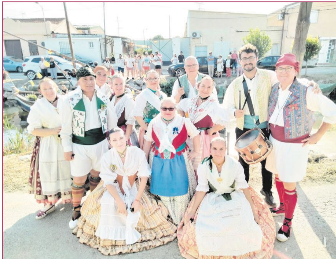
La agrupación Alfafar Bella Danses en las pasadas Fiestas del Tremolar.

«Estamos preparando por nuestro décimo aniversario un bolero especial dedicado a Alfafar»