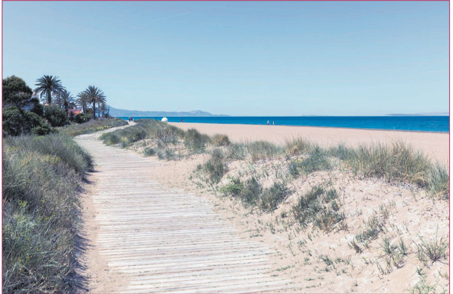
La playa de Les Marines, en Dénia, ofrece extensiones relajantes para disfrutar de soledad costera

Volviendo a Mareny Blau, en realidad suecana (Ribera Baixa), sepamos que este pe-