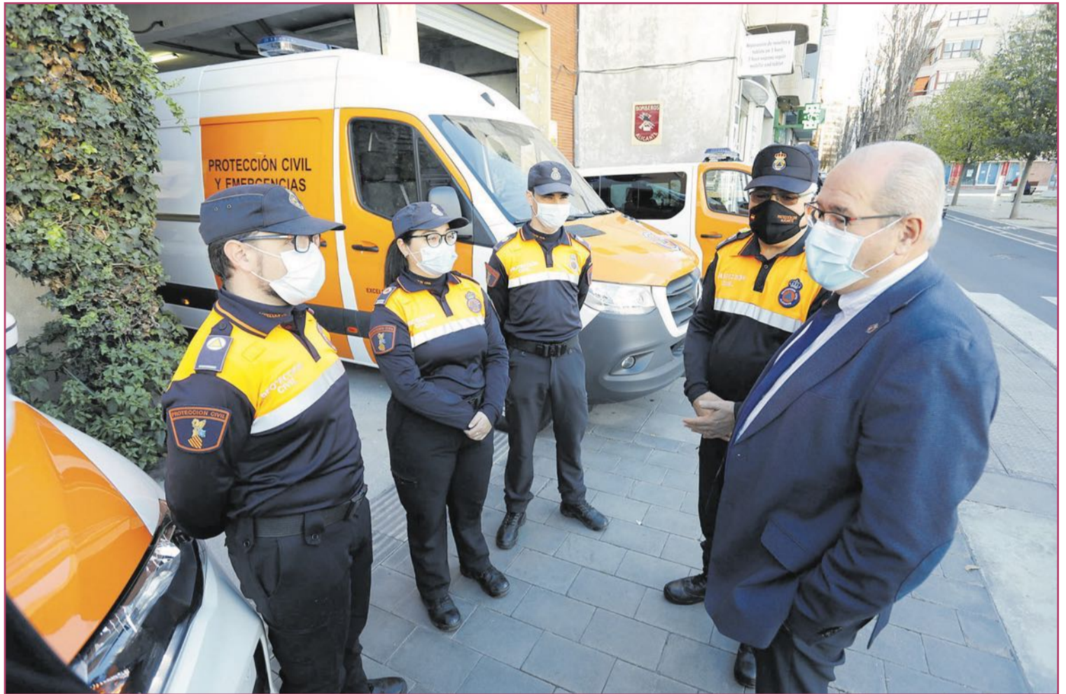
Grupo de Protección Civil.

Para controlar el tráfico los policías realizan pruebas de alcohol a los conductores y si dan positivo no se les permite seguir conduciendo. Entonces, ¿por qué en esta circunstancia, en la que la propia persona es quien transmite la enfermedad, no se com-