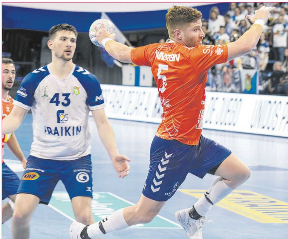
El jugador argentino ha disputado sus terceros Juegos Olímpicos.

Río me pilló ocho años más joven. La verdad es que uno