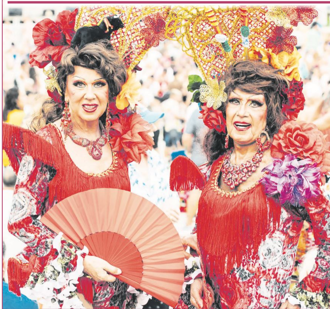
Imagen de dos participantes del desfile de 2023.

«La joya del evento y de la semana es el desfile, porque es esa fusión entre los que reivindicamos y la gente que está disfrutándolo»