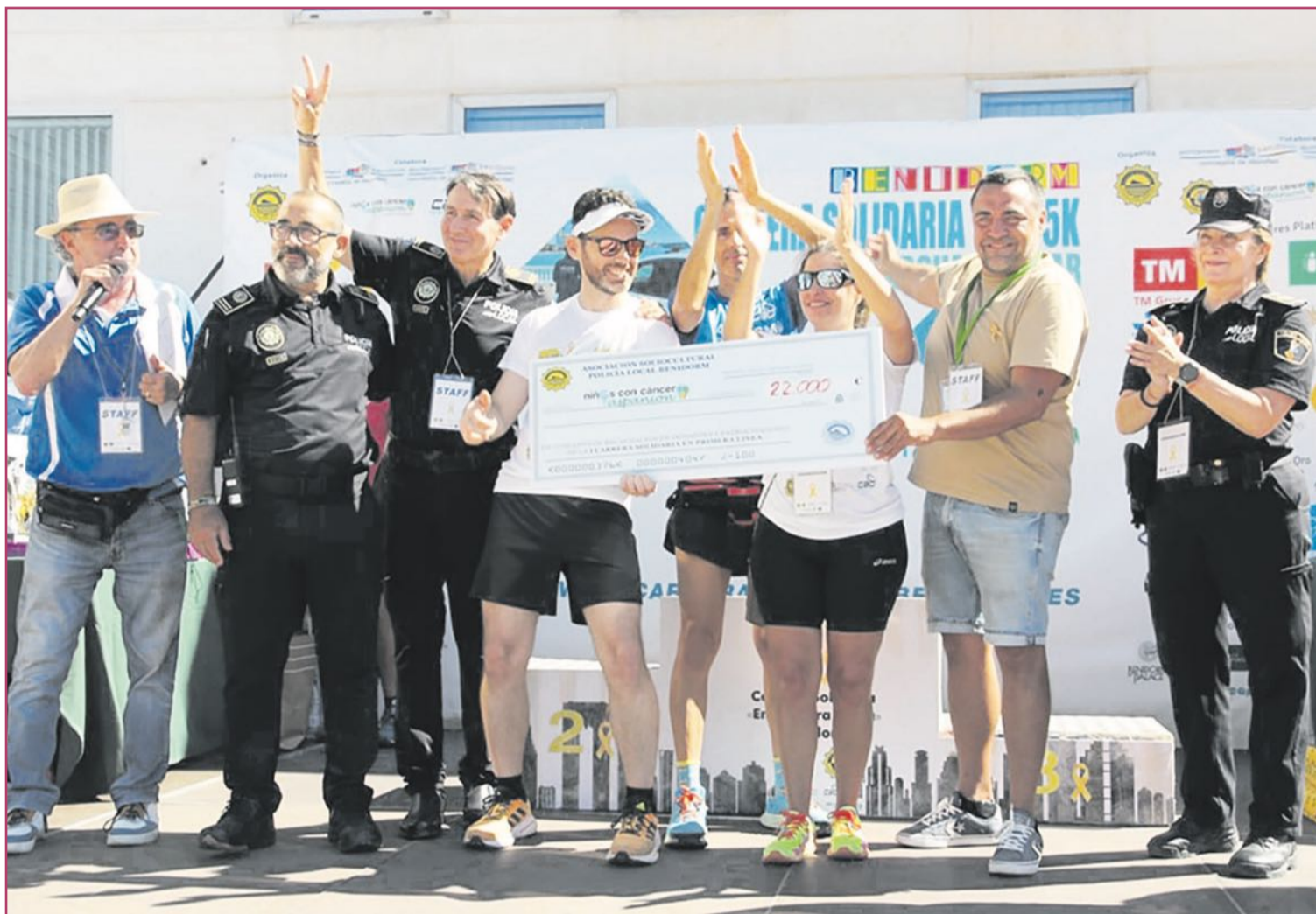
Imagen del podio de la pasada edición.

Esta carrera, organizada por la Asociación Sociocultural de la Policía Local, volverá a desarrollarse, como ya lo hiciera en su temporada de debut, por los paseos de las playas de la capital turística de la Comunitat Valenciana, y volverá a ofrecer distintas opciones de participación con el objetivo de poder abarcar al mayor número de participantes posible y, de esa manera, recaudar la mayor cantidad de ayuda para Aspanion.