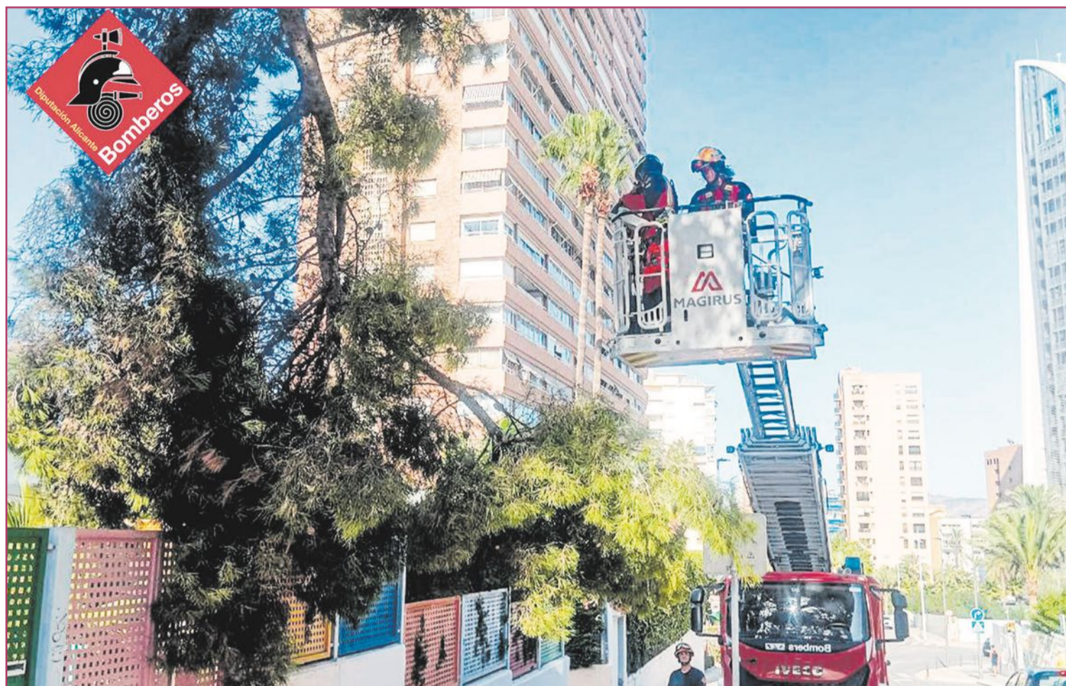
Por el momento no se han producido heridos por las caídas de árboles.

Se trata de un gusano microscópico que ataca a las coníferas y que podría comportar la devastación de los bosques de pinos de toda Europa, y al que, oh desgracia, le encanta el clima seco para hacer estragos en la madera de