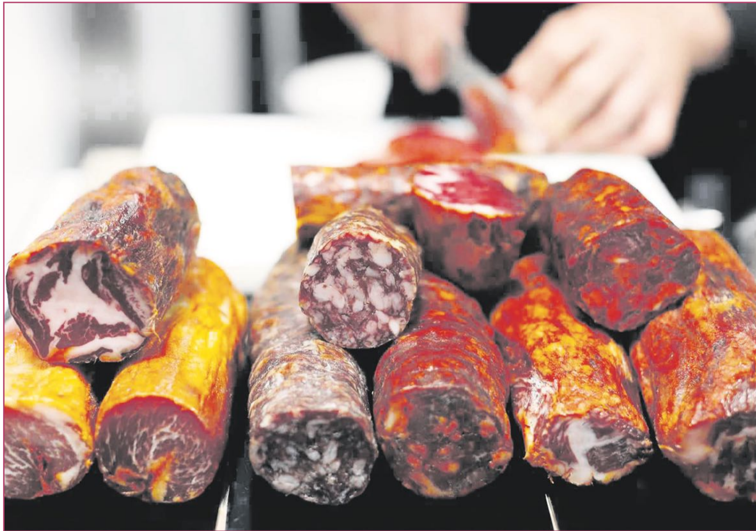
La feria gastronómica del valle de Pop (Marina Alta) supone una de las citas ineludibles para conocer nuestra producción gastronómica | Turisme Comunitat Valenciana

Bien, en esto, el rey por estos pagos puede decirse que es el 'blanquet', blanco o 'blanqui-