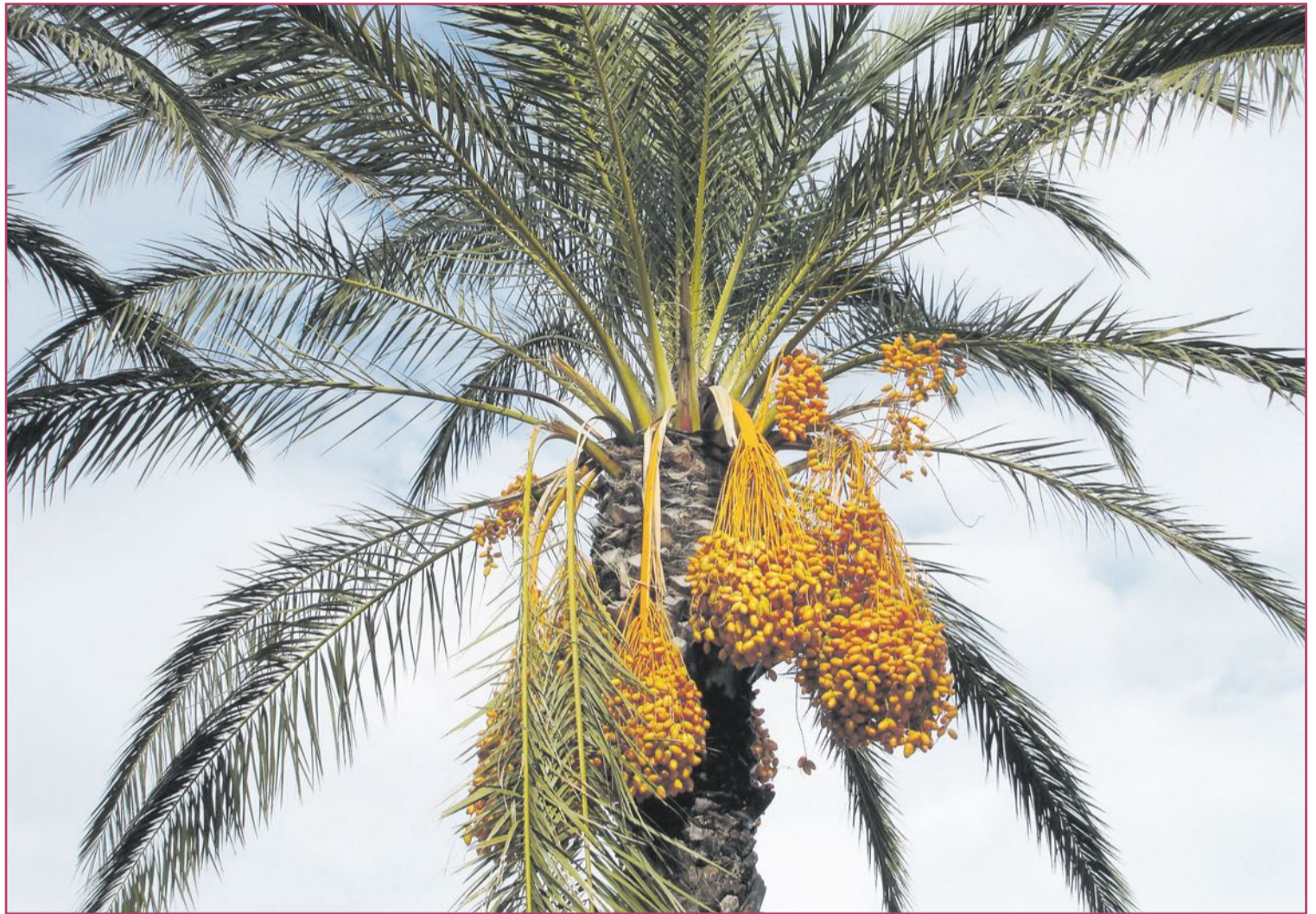
Las datileras se han convertido en enseña para la Comunitat Valenciana.

¿Y cómo fueron a parar aquí, por estas tierras? Podemos ser-