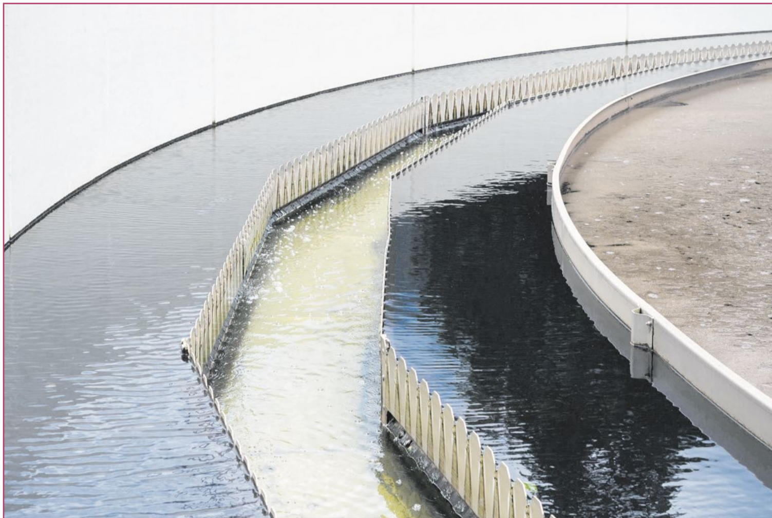
Convertir el 'agua bruta', la ya usada o la salobre en agua potable es uno de los retos de estas plantas.

El microscopio desarrollado por Van Leeuwenhoek, a quien no sin razón se le considera como 'padre de la microbiología', nos permitía comenzar a explorar la rica 'fauna' que, de tamaño minúsculo, puede bucear en una simple gota de agua. Entre aquellos microbios (del griego 'micrós', pequeño, y 'bíos', vida; aunque el holandés los llamaba en sus escritos 'animáculos'), 'infusorios'