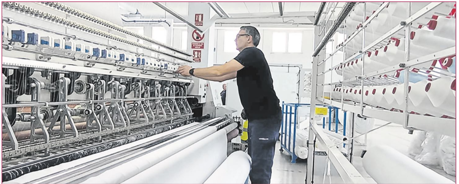
La producción industrial valenciana está creciendo.