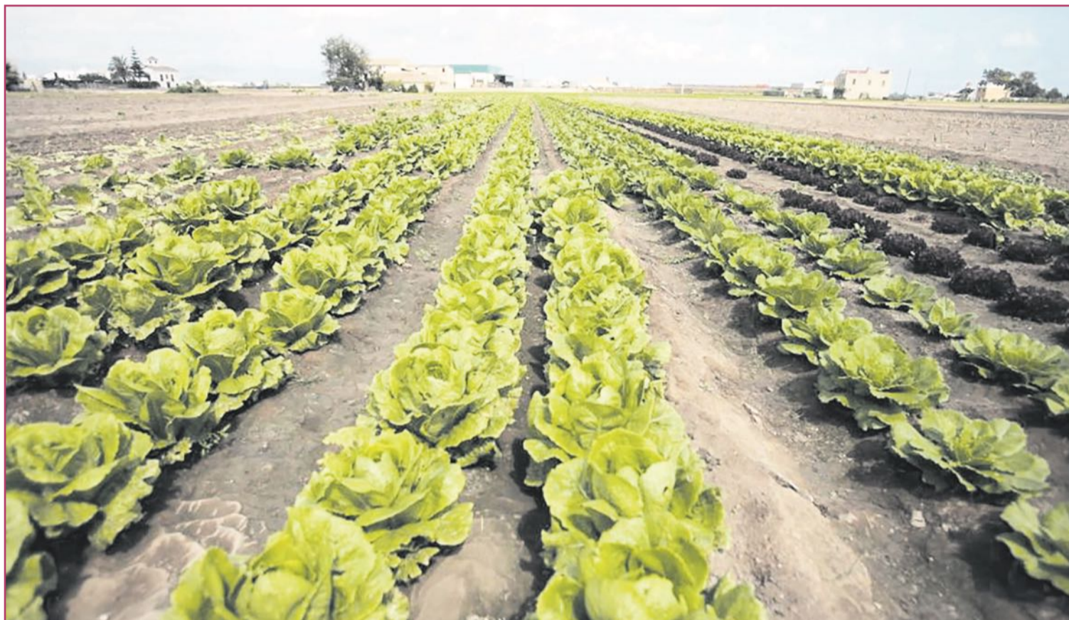
La Comunitat Valenciana es una de las regiones españolas más agrícolas.

Analizando la presencia de extranjeros, nos encontramos que nuestra comunidad es la tercera con mayor porcentaje de España solo superados por Baleares y Cataluña. Los datos nos dicen claramente que estamos asumiendo inmigrantes a un ritmo superior a la media nacional, de hecho hace