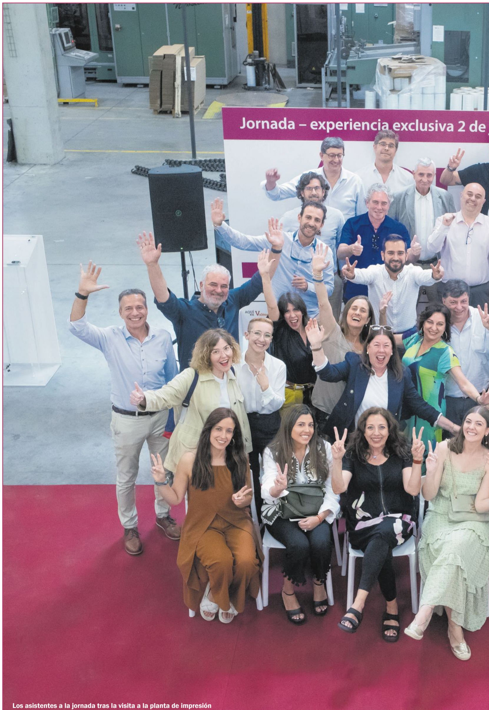
Los asistentes a la jornada tras la visita a la planta de impresión

«Es algo fundamental que no debe desaparecer nunca» M. García