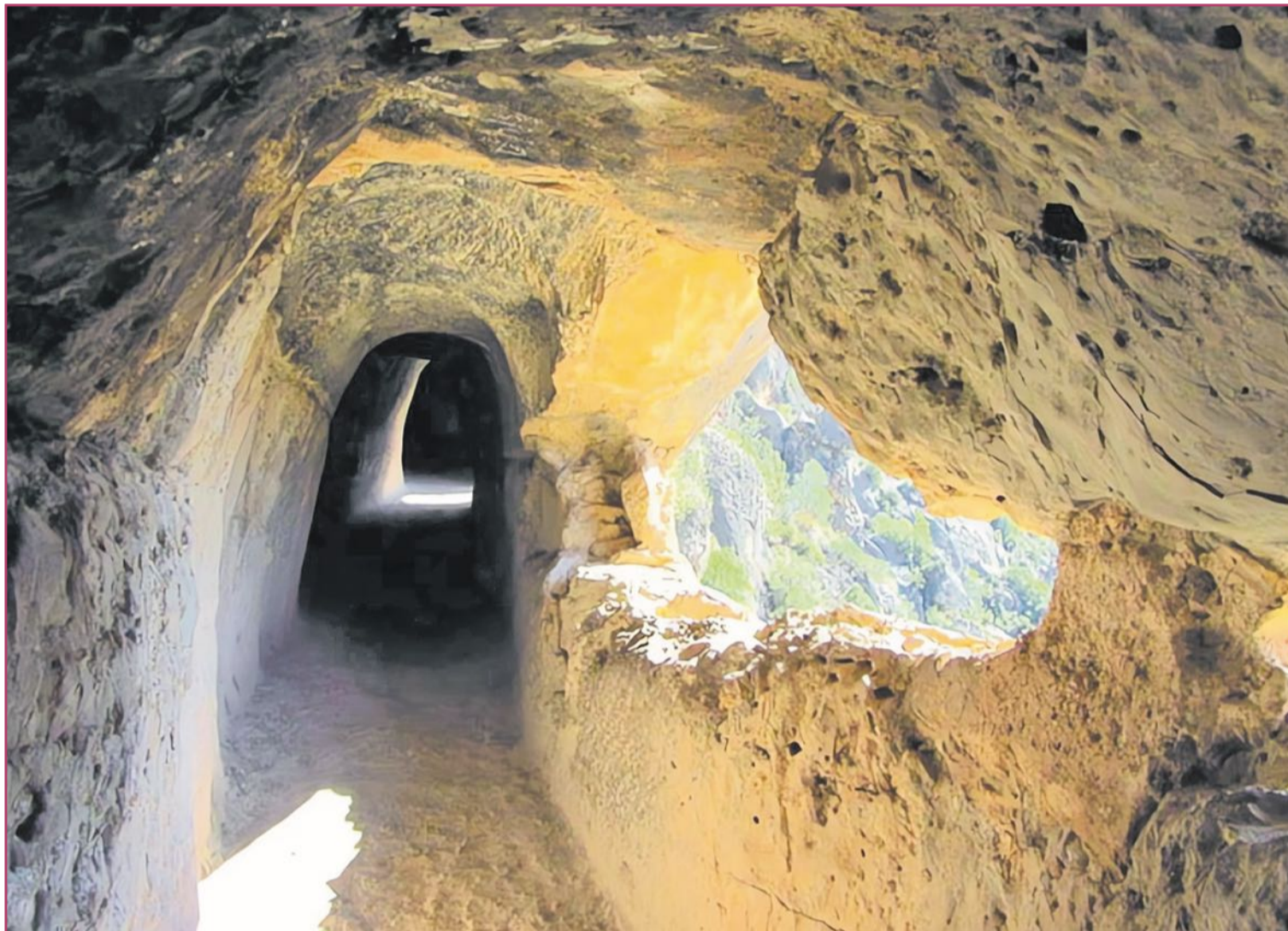
El turismo interior sin agobios nos permite descubrir parajes como las cinceladas interioridades de Peña Cortada, en Chelva

Pero queremos ahora algo peculiar, vaya, singularidades, siguiendo esa estela moderna de que no apreciamos ya una película con mensaje, sino que nos revelen tal cual el mensaje. Pues en paisaje eso no existe. Ya no hay espacio para ponerse el sombrero, el látigo y la cara de Harrison Ford y descubrir arcaicas perdidas llenas de efectos especiales. No obstante, lo suyo