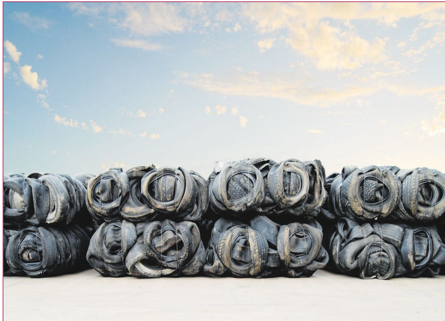
El reciclaje se ha convertido en fundamental para nuestra supervivencia, con instalaciones como esta planta dedicada a los neumáticos.

Hay que tener en cuenta que estas reutilizaciones estaban motivadas por la escasez de