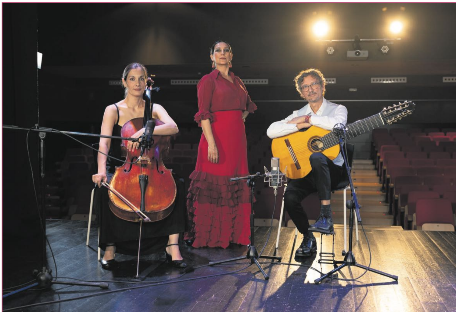
El día 14 será el turno de Fuego Fatuo con un homenaje a la escritora María de la O Lejárraga.