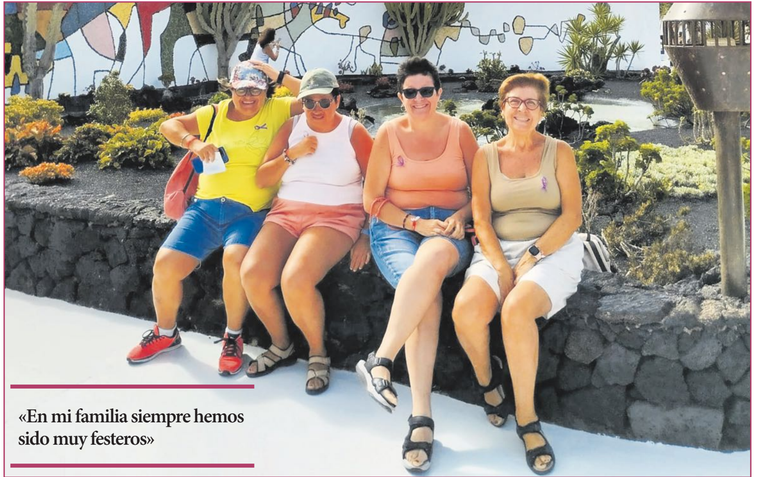
«En mi familia siempre hemos sido muy festeros»

Desde el principio tuve clarísimo que quería ser enfermera. Estudié en Valencia porque por aquel entonces, te hablo de los años setenta, ni siquiera había escuela en Alicante, se creó después. He tenido la suerte de que mis padres eran bastante abiertos y siempre me apoyaron, así que cuando terminé mis estudios me fui a Barcelona a trabajar. Allí estaba mi novio, que también era de Petrer, y ya que tenía que salir