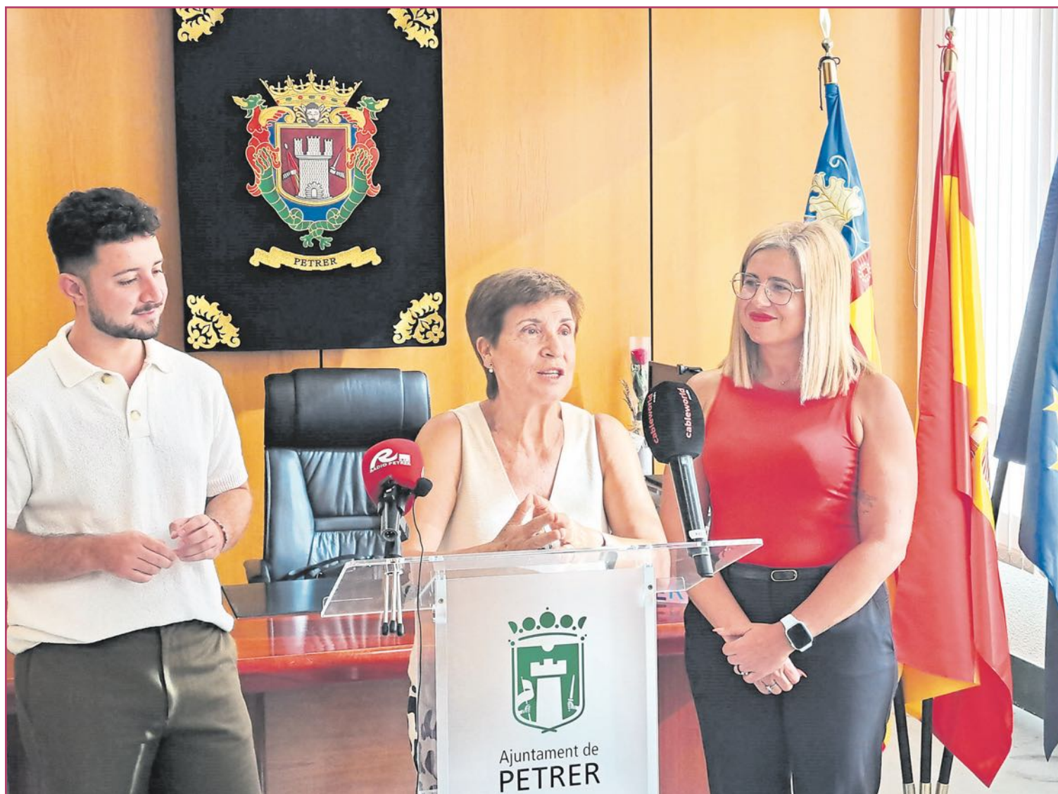
Presentación de la pregonera en el salón de alcaldía | Javier Díaz

Nunca pensé que me fueran a llamar como pregonera. Era lo último que me esperaba, porque mi trabajo siempre ha sido estar detrás. Pero tampoco iba a decir que no. Así que estoy feliz, a tirar para adelante, y a intentar hacerlo lo mejor que pueda.