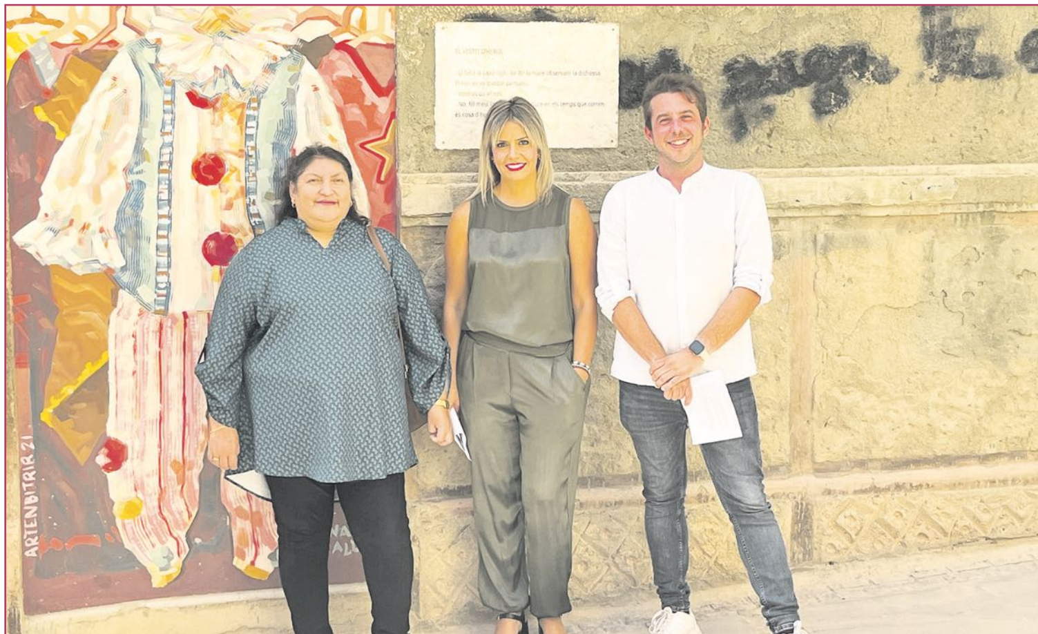
Acto de presentación de las ayudas.

Estas subvenciones están dirigidas a cubrir dos tipos de necesidades, relacionadas con las mejoras y el coste del alquiler de locales comerciales para la puesta en marcha de nuevos negocios. Para ello, se dividen en dos líneas principales y complementarias entre sí. La primera