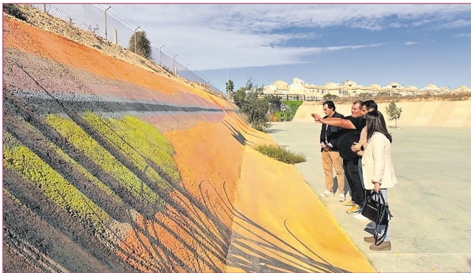
Balsa de laminación en Torreta Florida.

Una de las actuaciones se producirá en la avenida Roentgen junto a la playa de los Locos