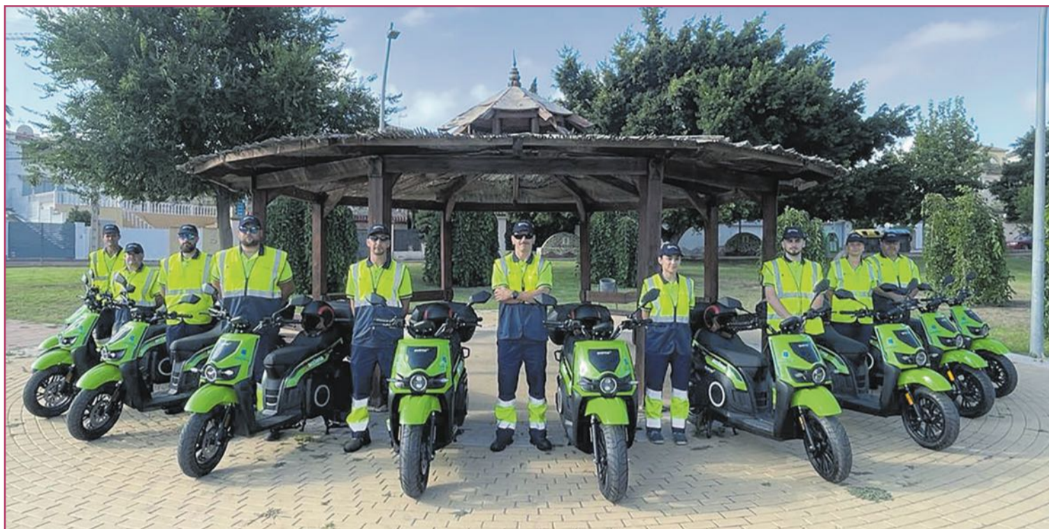
Controladores medioambientales de Torre vieja.