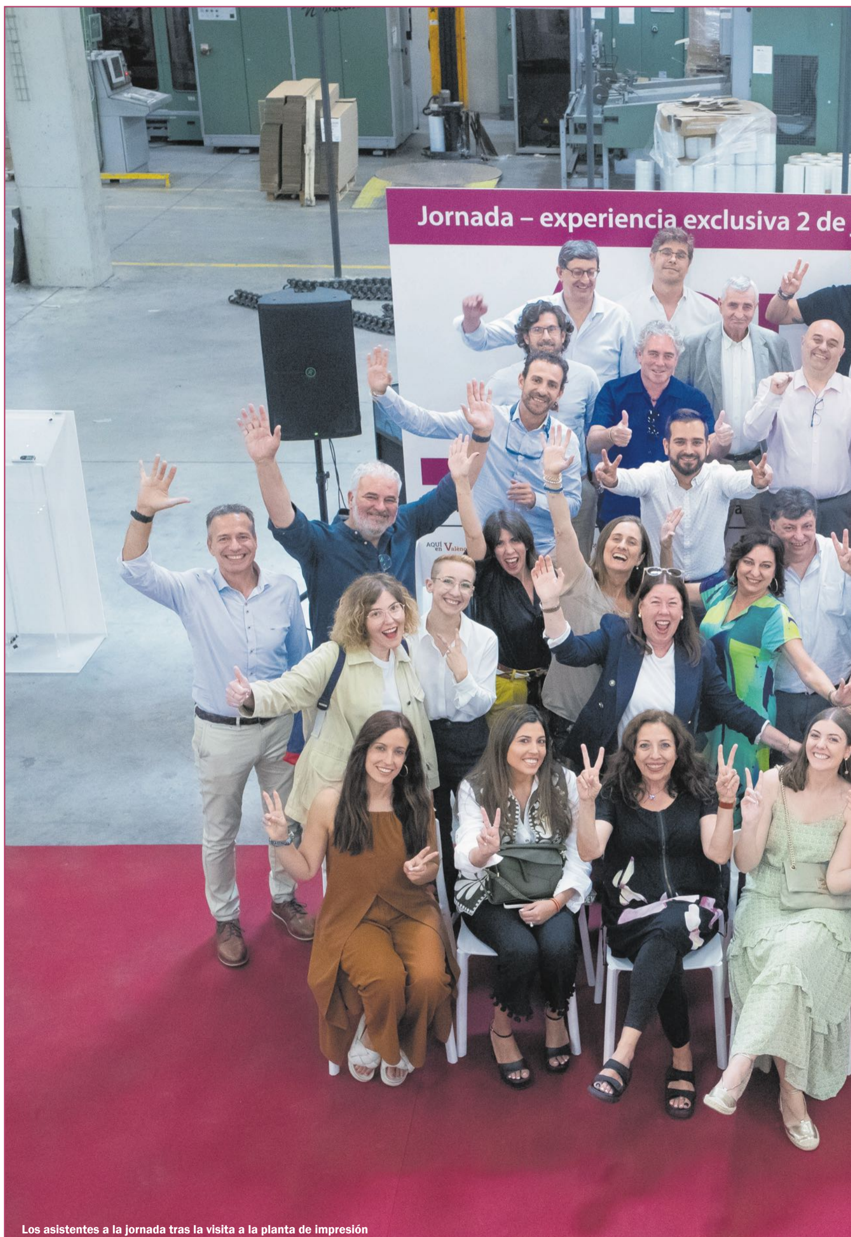
Los asistentes a la jornada tras la visita a la planta de impresión