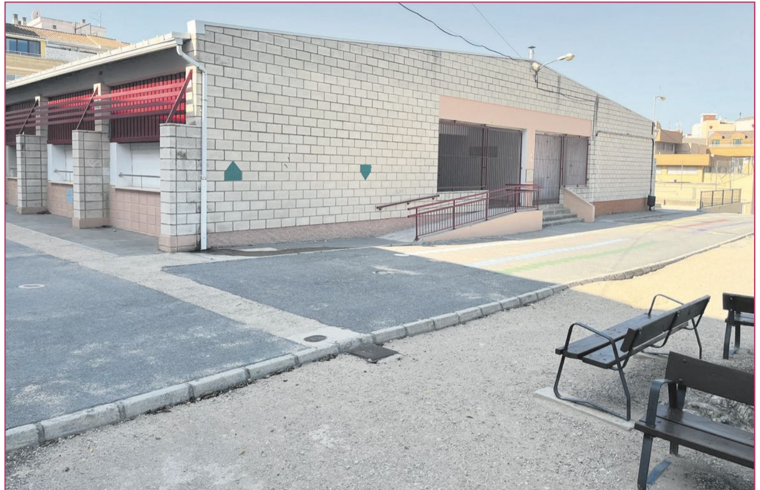
El edificio de Educación Infantil no reúne las condiciones necesarias.

El CEIP Príncipe Don Juan Manuel atraviesa un particular viacrucis que ya se alarga durante muchos años, sin visos de solución aparente. El alumnado de primaria se encuentra actualmente ubicado en aulas prefabricadas, será el tercer curso que arranquen en estas dependencias temporales y se desconoce hasta cuándo se mantendrá esta situación.