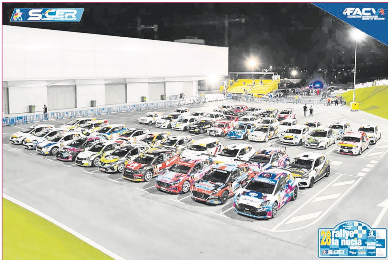
La Nucía volverá a ser la sede de la competición.

Así, los pilotos deberán enfrentarse a tramos con cambios de altitud, curvas cerradas y zonas rápidas que requieren de una precisión milimétrica en la conducción. Una de las sec-