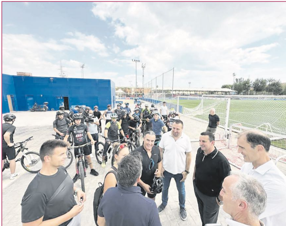
El proyecto educativo es uno de los mejor valorados.

Con el fin de dar este gran salto cualitativo, el consistorio nuciero se ha dado la mano con otras instituciones de gran relevancia,