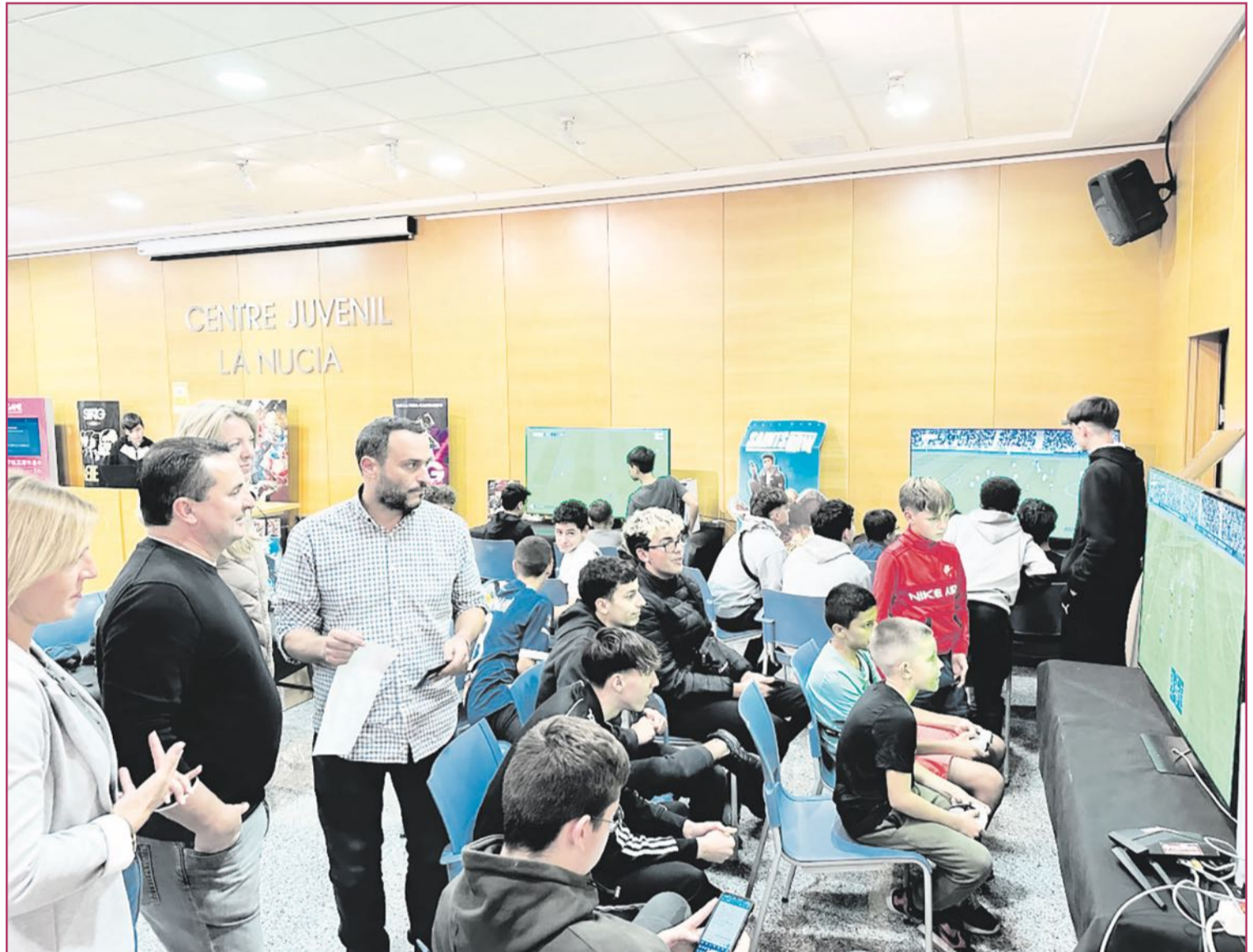
El Centro Juvenil acogerá la iniciativa.

Y si se dejan caer por allí, descargados de prejuicios y con la intención, siempre sana, de aprender de ese mundo nuevo en el que viven y se relacionan los más jóvenes, podrán encontrar un evento dividido en cinco zonas diferentes: realidad virtual, simuladores de conducción, zona LAN, campeonatos Mobile, Xbox, PS5 y consolas de uso libre.