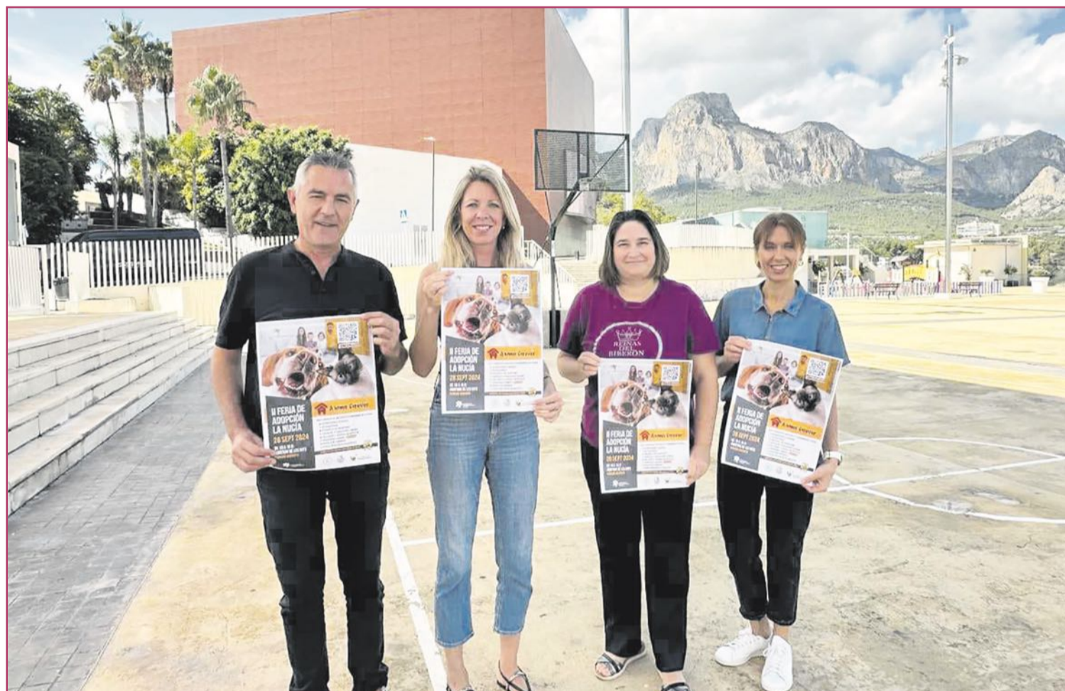
Imagen de la presentación de la Feria de la Adopción.

Entiendo que vuestra asociación surge porque había una necesidad, más allá de una protectora al uso. ¿Existía esa necesidad concreta?