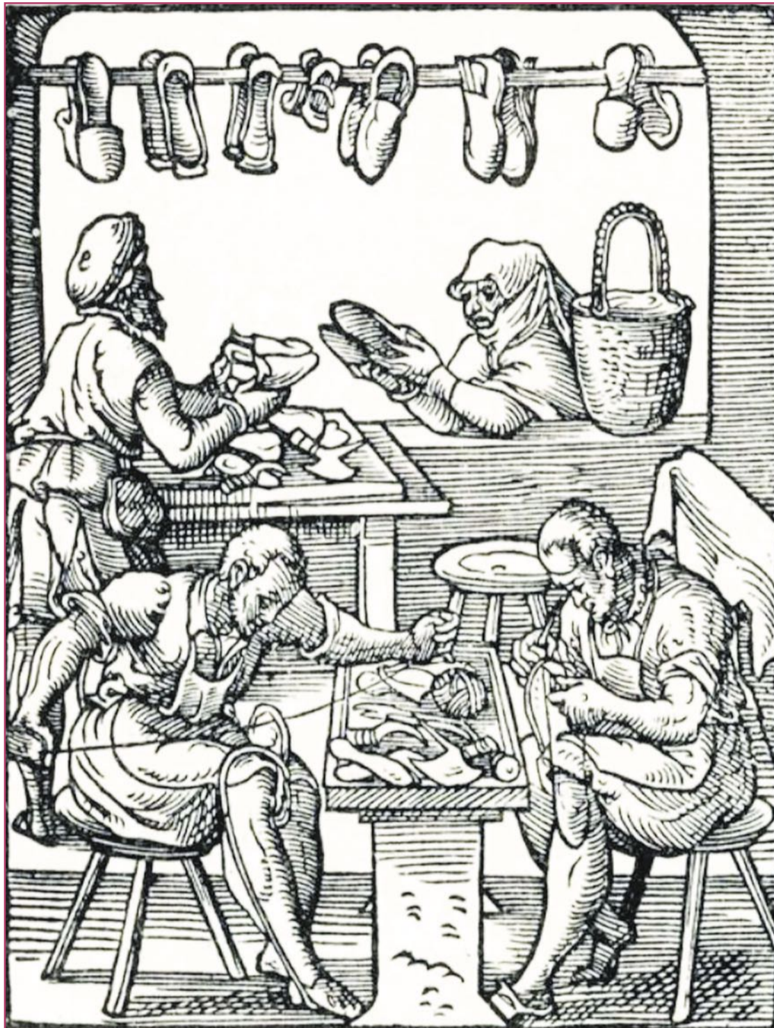
Sembrado en la misma Edad Media, el gremio de zapateros poseía un gran poder organizativo.

Fue el mismísimo rey Jaume I (1208-1276) quien en 1242 les concedía tierras y 'obradors'. El monarca, de hecho, ya había comenzado las anotaciones que correspondían, desde julio de 1237 a junio de 1245 (al menos