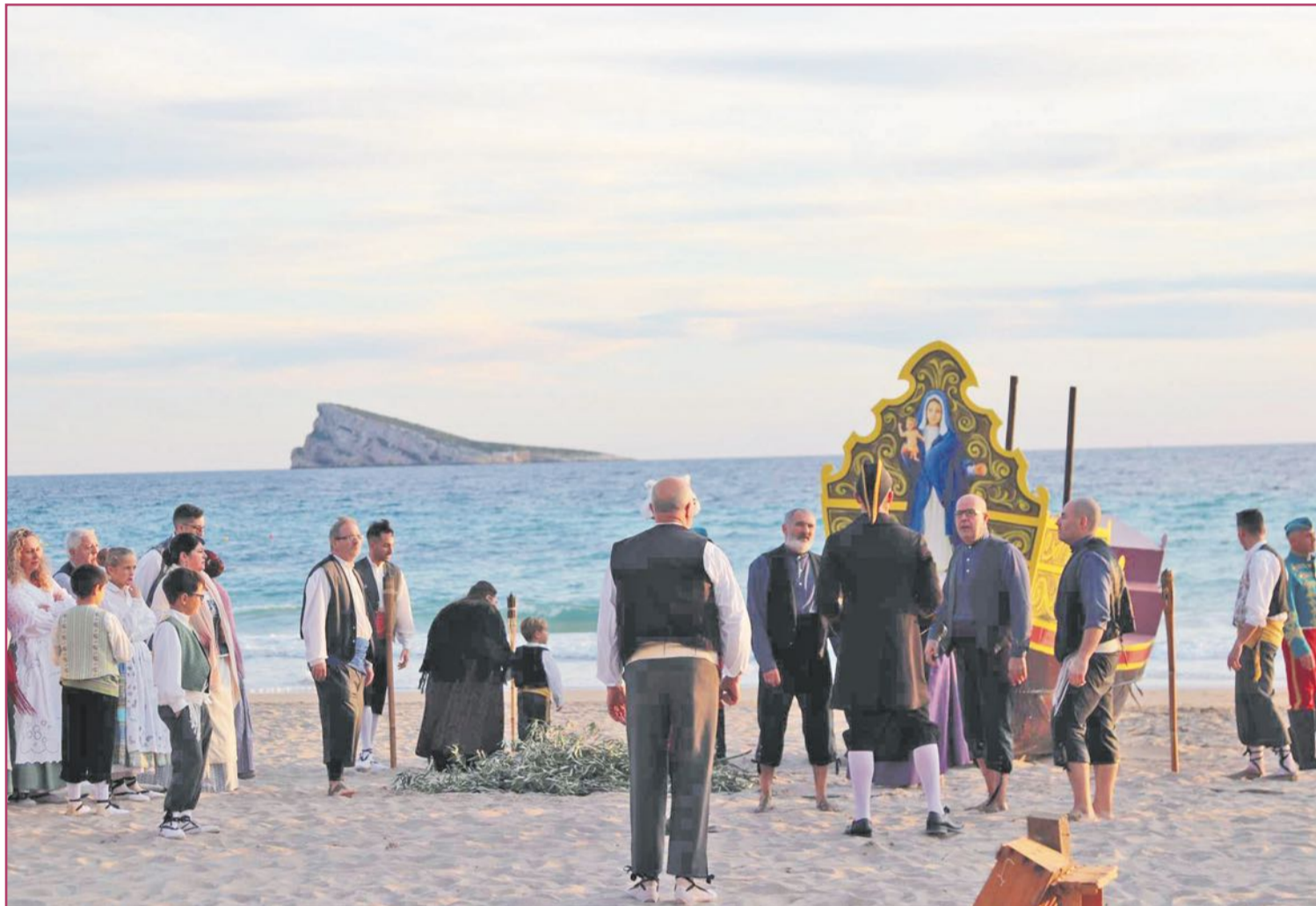
Terminaba la faena en la almadraba y las gentes benidormenses se implicaban con su Virgen del Sufragio

También hay una Festa La Carxofa el 16, con una especie de alcachofa o magrana, que aquí se quema. Pero esto también define una serie de actividades, como los típicos 'bollos', para degustar, que acompañaban lo anterior. Si tenemos hasta sardinada. No obstante, el plato fuerte, del 9 al 13, lo marcan las Fiestas Mayores Patronales.