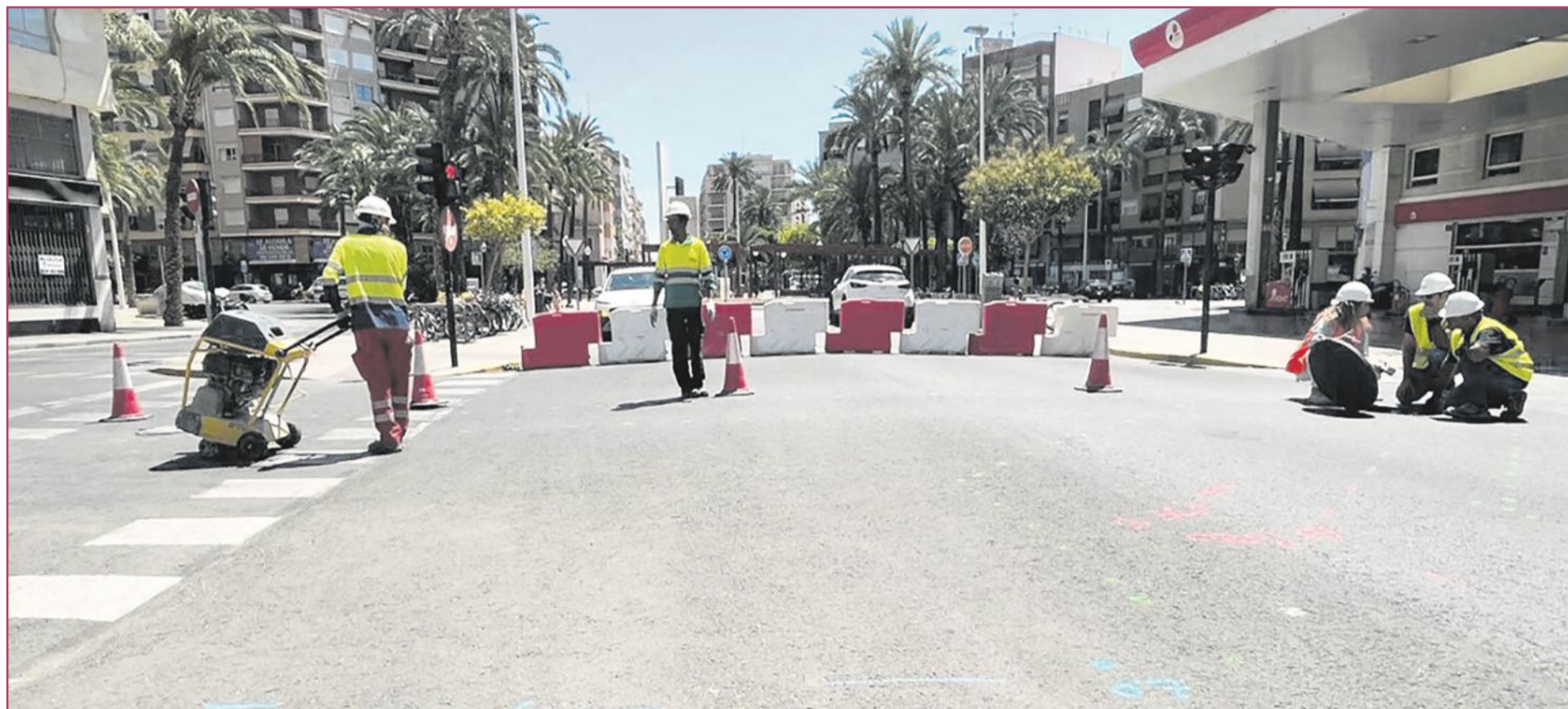
Trabajos de renovación del alcantarillado en la calle Antonio Machado.

Este noviembre se iniciarán la construcción de una conducción entre la depuradora y el pantano