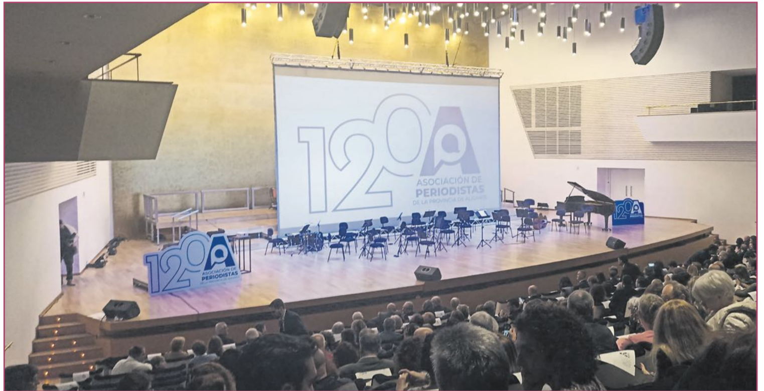
Celebración del 120 aniversario de la APPA en la presentación del anuario.

En 1922 la asociación se integró oficialmente en la recién fundada Federación de Asociaciones