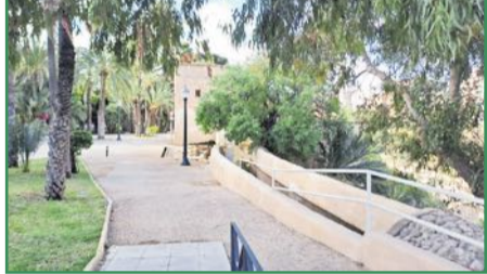
El agua regenerada llegará hasta más huertos datileros de Elche. Pág. 2