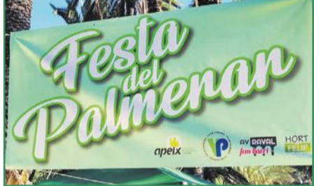
La 'Festa del Palmerar' conmemorará el 24 aniversario como Patrimonio de la Humanidad. Pág. 16