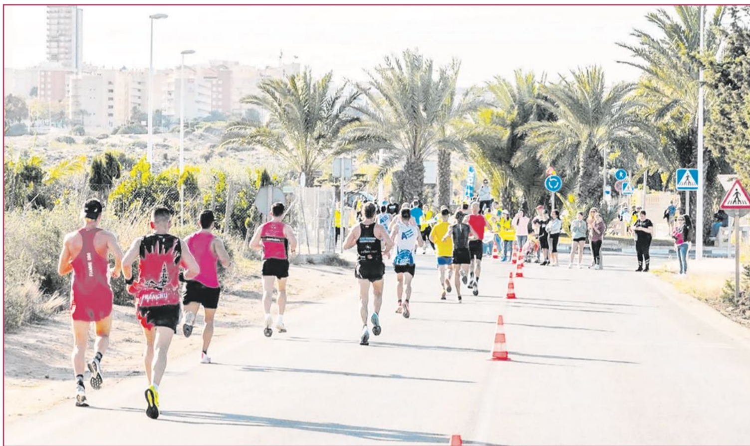
La carrera a su paso por los Arenales del Sol.

La organización se encargará de facilitar la logística. Los participantes pueden ceder sus mochilas y pertenencias antes de empezar la carrera, en Alicante, para su transporte, a través de tres camiones, hasta Santa Pola, donde podrán recuperarlas al cruzar la meta.