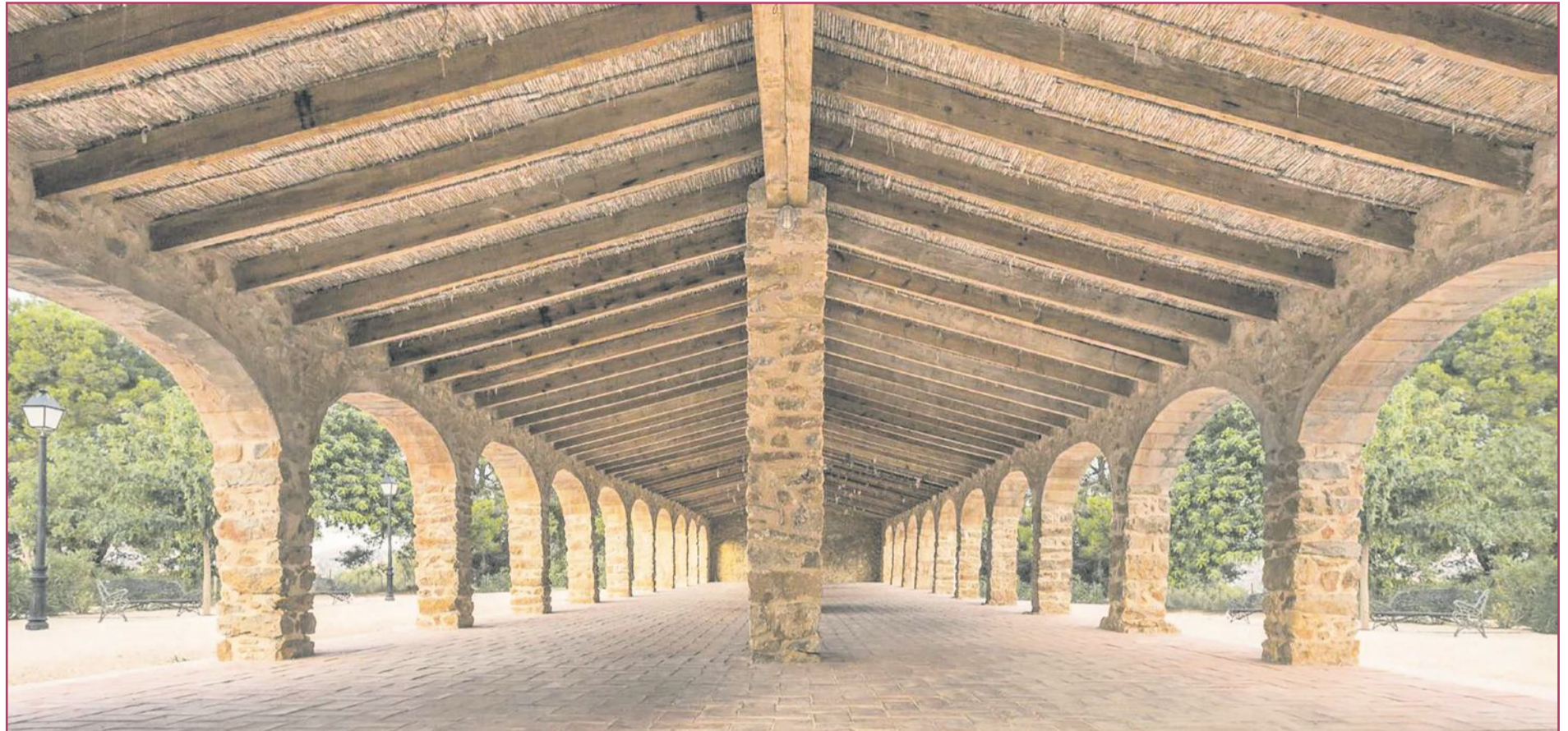
Alguno de los riu-raus supervivientes, y rescatados, resultan verdaderamente espectaculares

Los riu-raus, o 'riuraus' en valenciano, son unas construcciones bajo las que durante décadas se produjo el milagro de la uva pasa