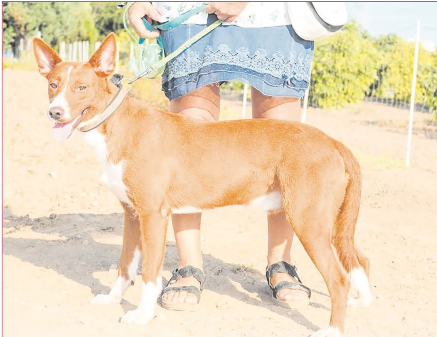
Bobi, perro de tres años que hace poco fue rescatado en Modepran.

PACMA denuncia que en España se abandonan más de 300.000 animales cada año