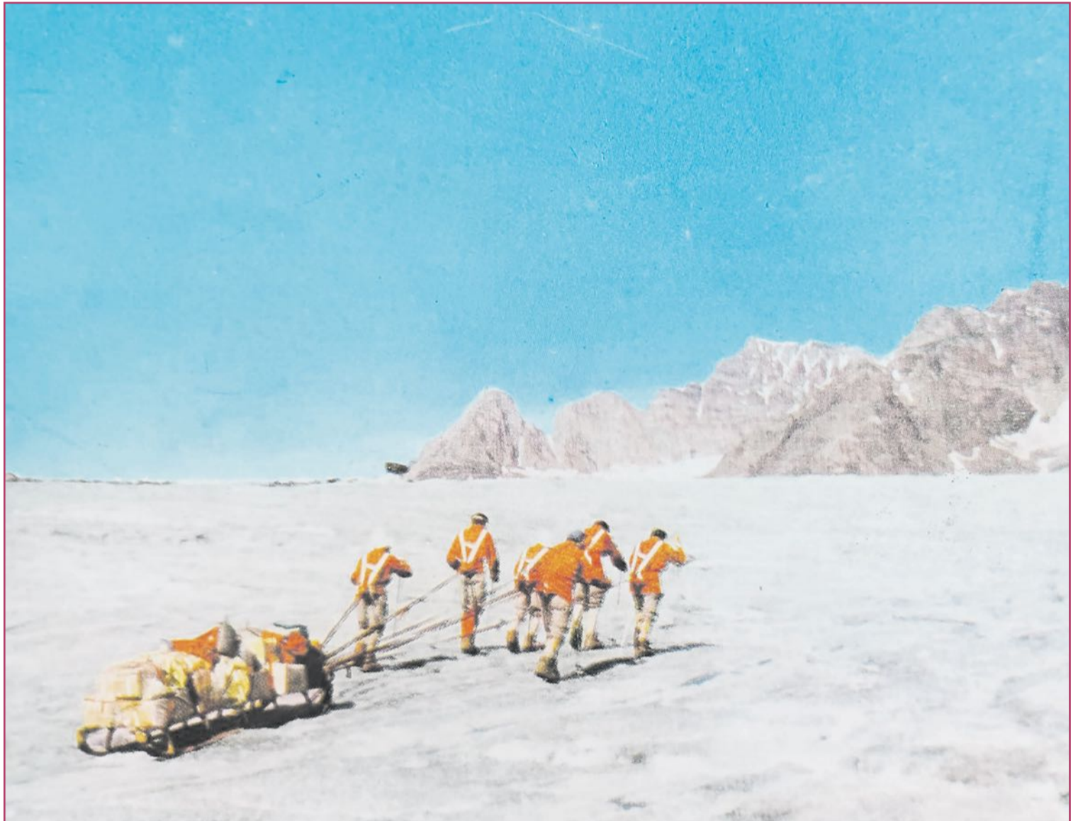
Los aventureros arrastrando un trineo con sus víveres y materiales.

Se trataba de un contratiempo que podía dar al traste con la expedición, porque el hielo,