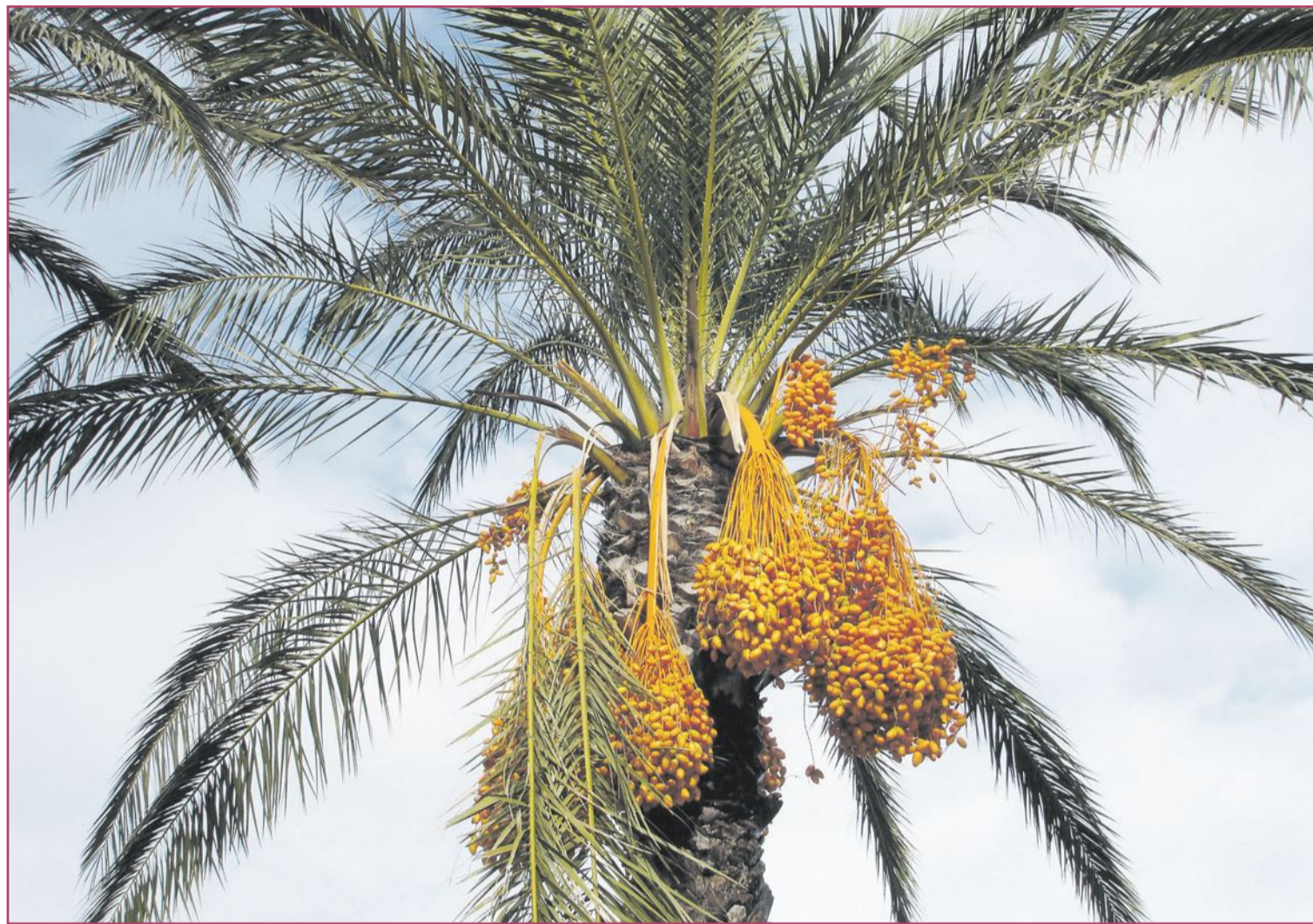
Las datileras se han convertido en enseña para la Comunitat Valenciana.

¿Y cómo fueron a parar aquí, por estas tierras? Podemos ser-