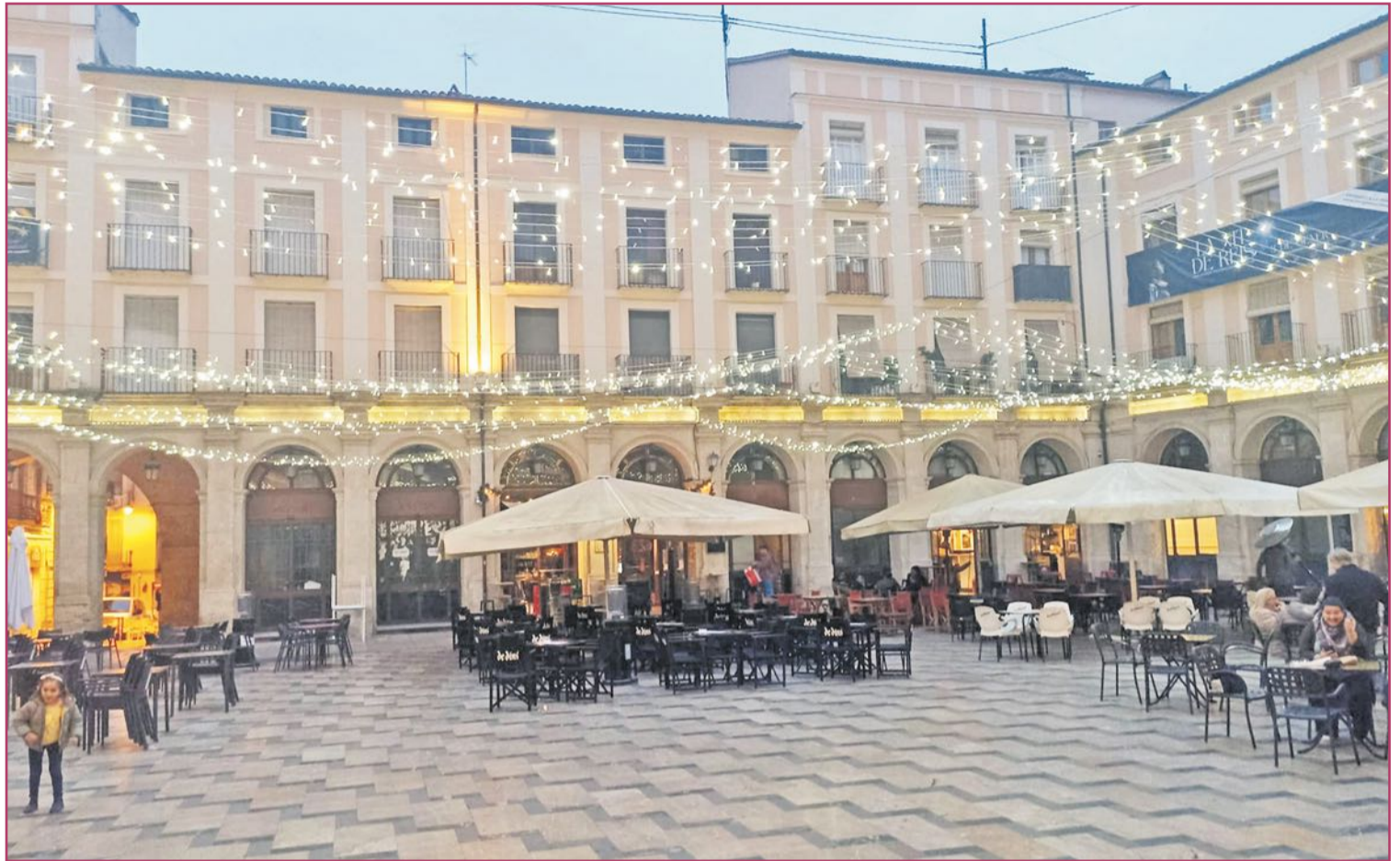
La Plaza de Dins en la pasada Navidad.

De hecho nosotros siempre sacamos la programación navideña a principios de noviembre, mucho antes que otros