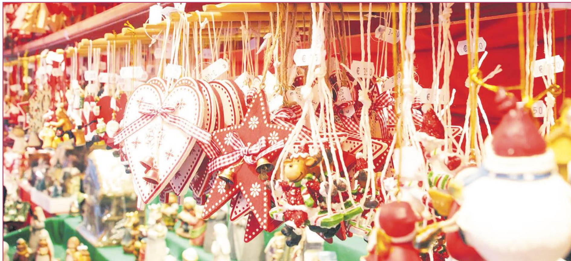
La industria de la Comunitat Valenciana se ha dedicado también a la producción de complementos navideños | Turisme Comunitat Valenciana

Las industrias jugueteras y otras en la Comunitat Valenciana se han impuesto también en la fabricación de complementos navideños