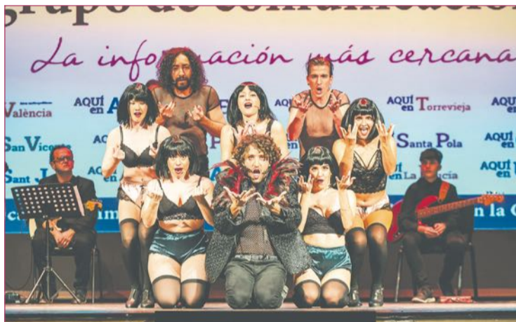
Compañía Teatro Musical de España.

tenemos en marcha planes de emergencia".