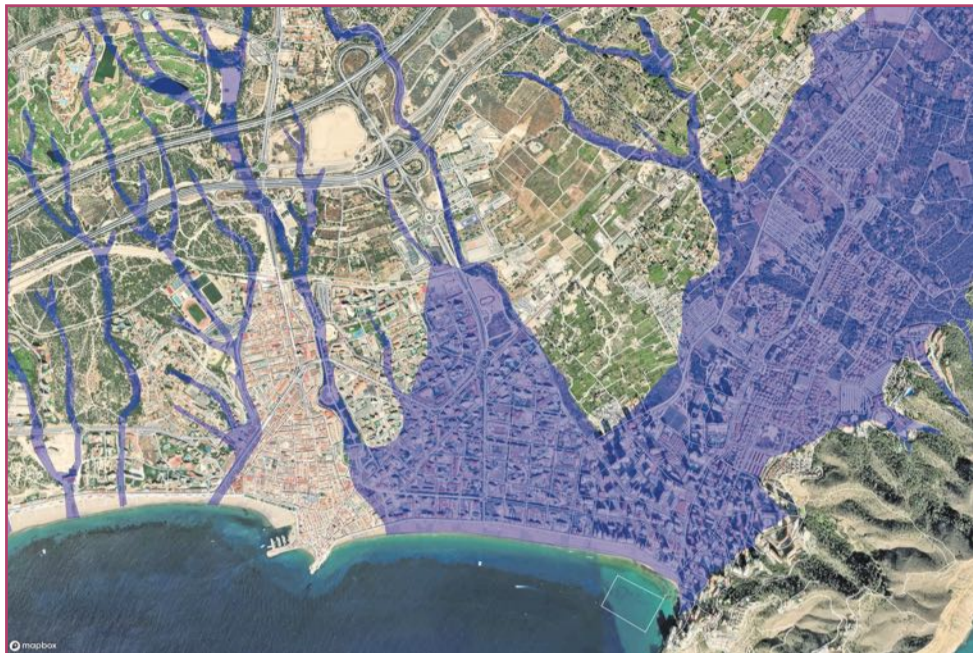
Imagen del Patricova para el municipio de Benidorm.