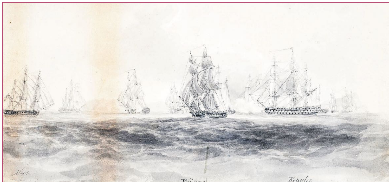
Imagen de una flota de la época.

Las crónicas de la época cifran en 1.500 soldados la fuerza imperial que comenzó su camino desde Dénia hacia Alicante en el mes de enero y, aunque mucha documentación de aquellos días se ha perdido con el paso del tiempo y, por lo tanto, no existe