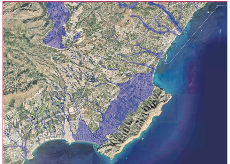
Levante, Albir, La Nucía y algunos puntos de Altea, señalados como inundables en el Patricova.

y turístico de la región nos ha llevado a afrontar crecimientos, como mínimo, cuestionables.