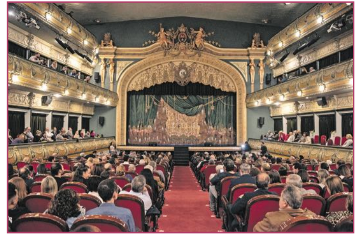
El teatro, antes de comenzar el espectáculo, con un lleno total.

La gala de AQUÍ grupo de comunicación, AQUÍ y ÚNICOS, reunió en el Gran Teatro de Elche a políticos, empresarios y un gran número de invitados que llenaron por completo las más de 700 plazas del espectacular lugar.