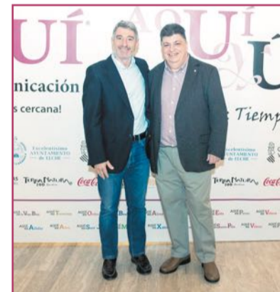
Pepe Vegara, alcalde de Orihuela.