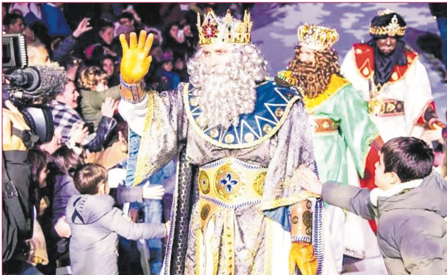
Las fiestas se cerrarán con la visita de los Reyes Magos.

Desde la primera semana de diciembre, todavía con la resaca de las Festes Majors Patronals muy presente, y hasta la visita de Sus Majestades los Reyes Magos, el recinto, ubicado bajo ese 'rascacielos tumbado' que es el edificio del Ayuntamiento, será el gran punto de encuentro de benidormenses, turistas y vecinos de