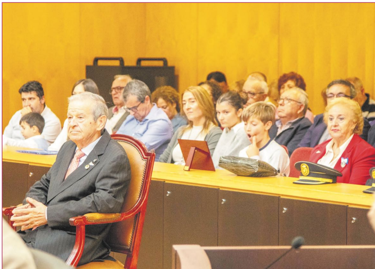
Olmo durante el acto de entrega de su reconocimiento.

Como tú mismo has dicho antes, todo eso fue un gran trabajo en equipo.