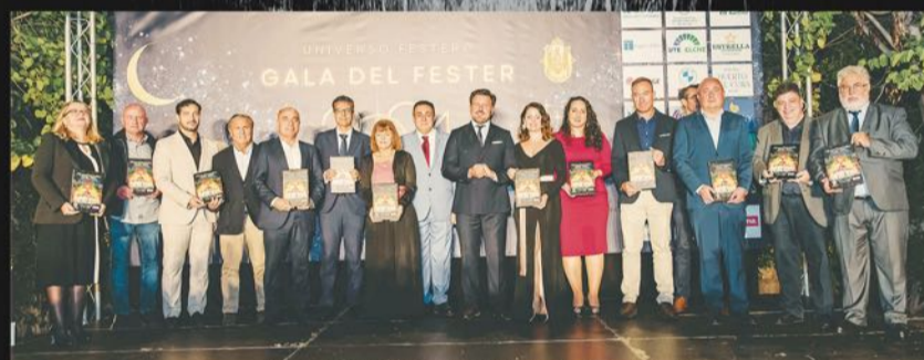
Patrocinadores y colaboradores.