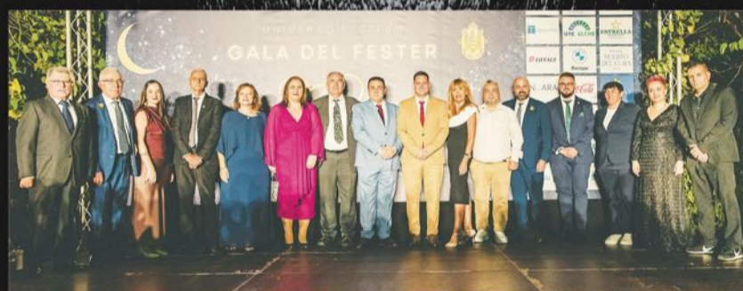
Presidentes de las Comisiones de Fiestas.