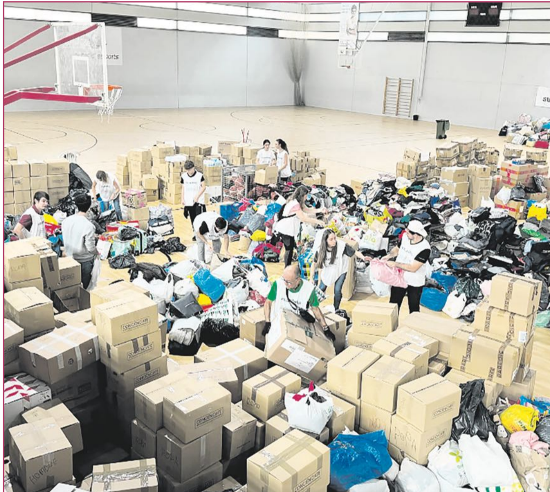
Almacenamiento en el polideportivo de El Toscar de los productos donados.

“El Ayuntamiento de Mislata nos pidió llevar camas y somieres a un polideportivo que habilitó para familias que había perdido sus hogares. A pesar de que era un día festivo, la respuesta de los ilicitanos fue tan brutal que el mismo 1 de noviembre pudimos mandarles el primer