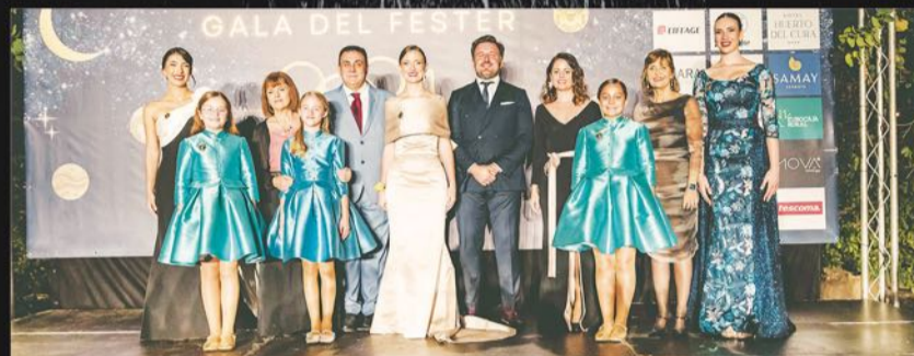
Autoridades con las Reinas y Damas de las Fiestas de Elche 2024.

Especial agradecimiento a los diferentes grupos políticos de nuestra ciudad, representante de la Policía Local y las entidades festeras y culturales que nos quisieron acompañar esa noche.