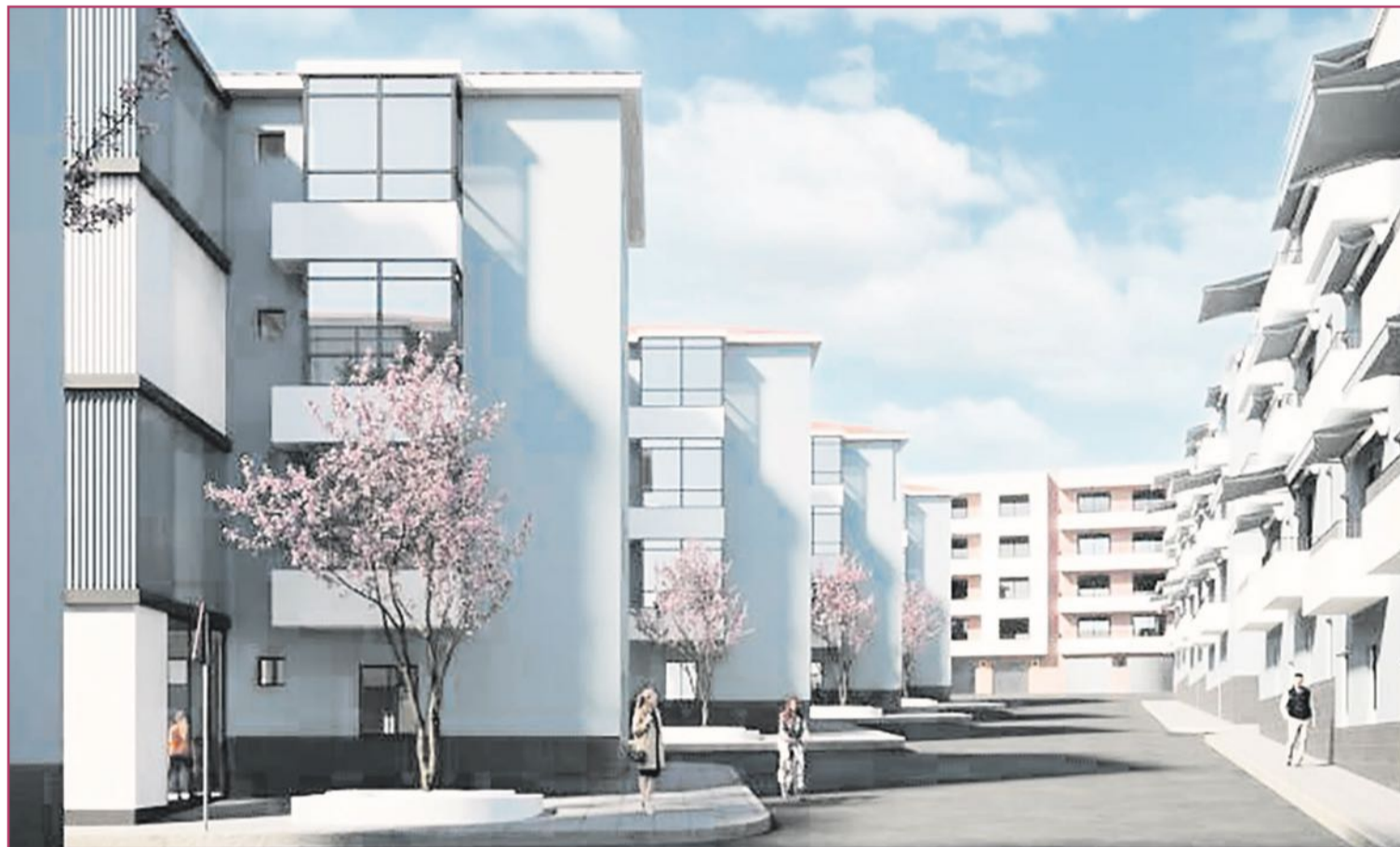
El Ayuntamiento quiere dar al barrio Porfirio Pascual una imagen totalmente renovada.

El nuevo edificio en el Travalón constará de 76 viviendas