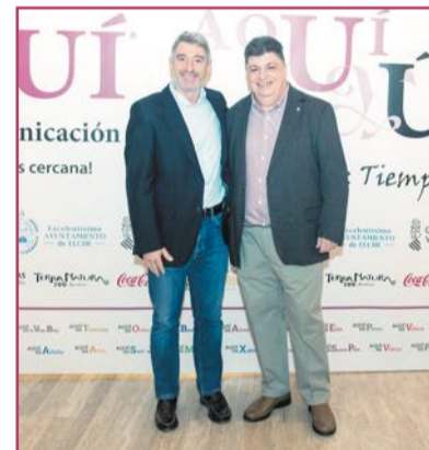
Pepe Vegara, alcalde de Orihuela.