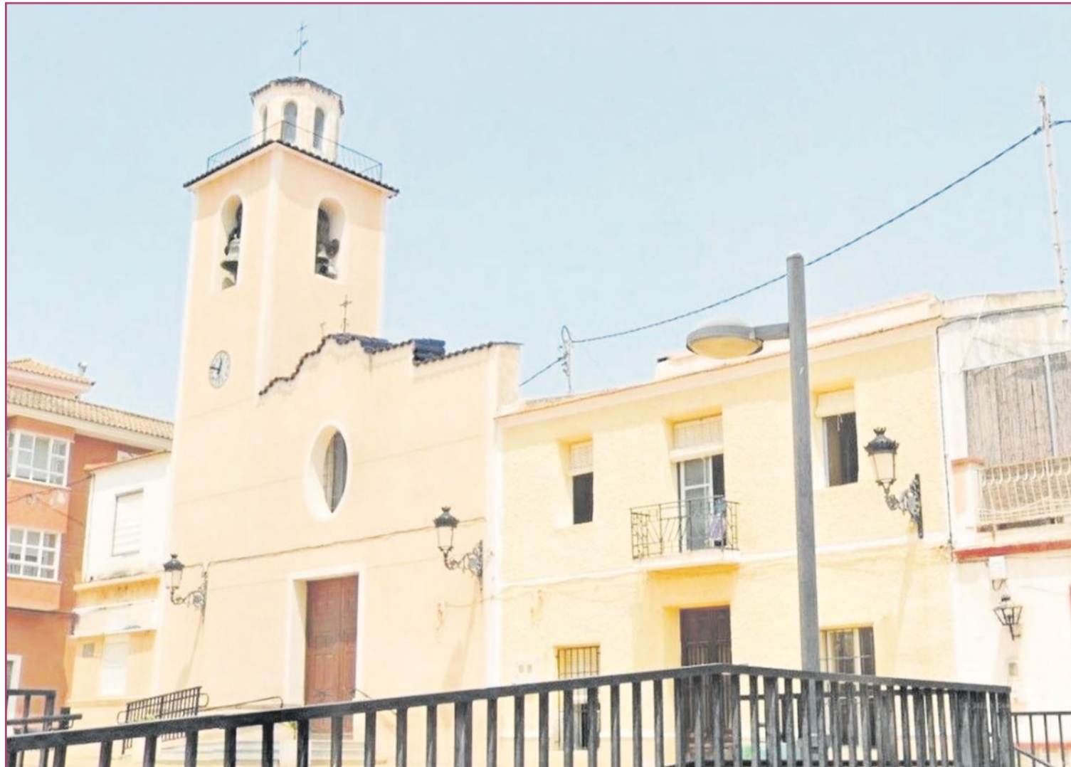
Torremendo, en las cercanías del embalse de la Pedrera, no deja de ser una pedanía tipo oriolana.

Crecida a partir de la llamada Dehesa de Campoamor, el regalo del poeta y político asturiano