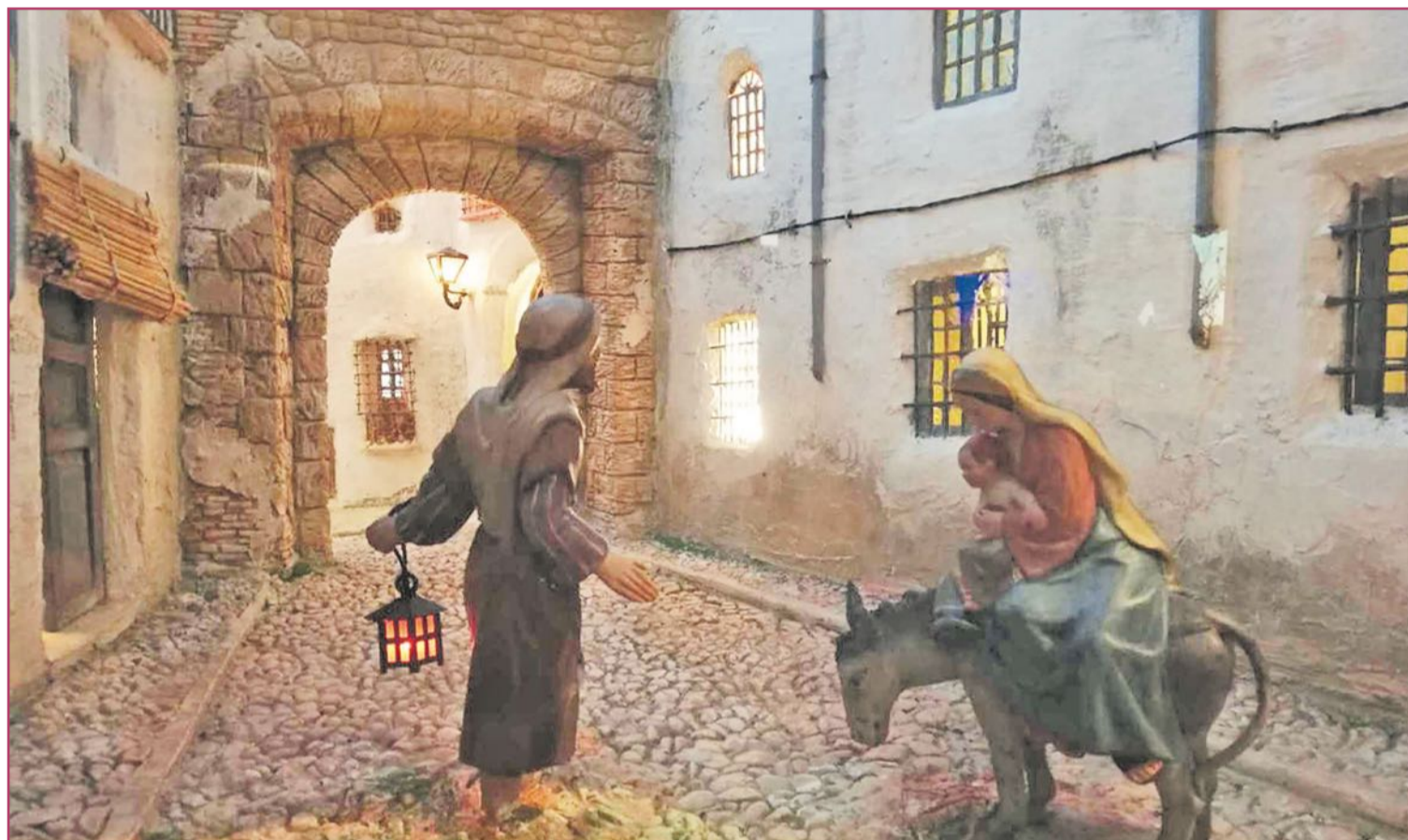
Los belenes confeccionados por las asociaciones no dejan de tener sus ambientaciones localistas

Por supuesto, el Nacimiento, el pesebre, y que no se nos olviden los pastorcitos, los animalillos (cabras, gallinas, ocas, ovejas). Todas las figuras (el 'caganer', los Reyes Magos, la Sagrada Familia...). ¡Y la nieve, dónde está el corcho para la nieve! La moda (no anglosajona, sino centroeuropea) del árbol navideño, reducido ahora a un recortable pegado con fixo, antaño competía con los disfrutes de, literalmente, montar el Belén y luego ir a ver otros, a la calle.