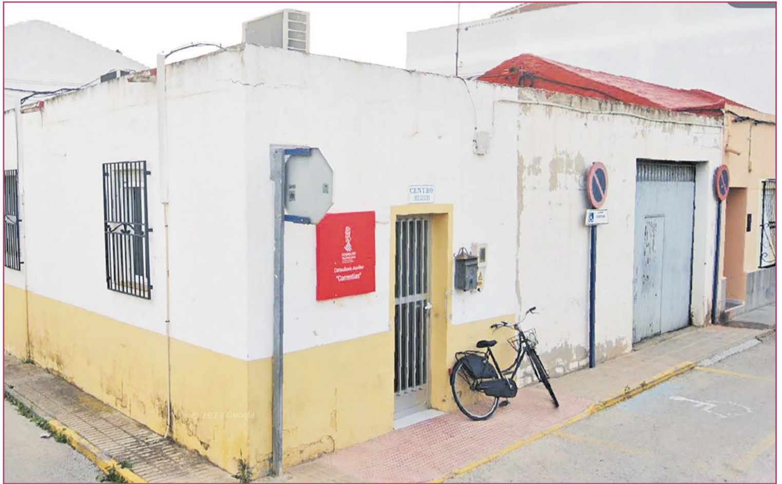
Consultorio médico en Correntías Medias

Estamos redactándola en base a la actual ley nacional de bienestar animal. La verdad es que actualmente en este tema Orihuela está siendo un poco la ciu-