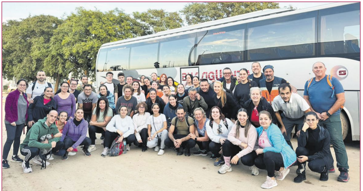
Voluntarios oriolanos camino a València (17-noviembre-2024).

Del centro logístico, fue la desorganización. Se necesitaban muchas manos para descargar camiones, ordenar material, embalar cajas y distribuir alimentos. Los voluntarios debemos ser el relevo para las personas que llevan más de veinte días conviviendo con el barro.