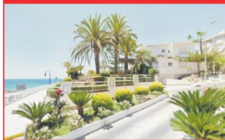
Orihuela es una pujante ciudad, pero también una inmensa extensión donde abundan las más diferenciadas pedanías. Pág. 4