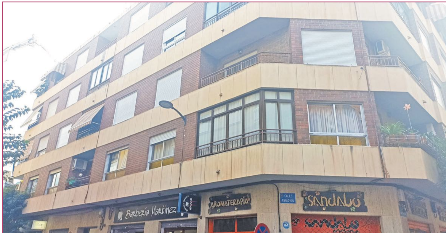
Edificio residencial en la calle Aviación.

Por todos es sabido que el mercado inmobiliario se encarece especialmente en el litoral, y de hecho si nos fijamos en ciudades de tamaño similar a San