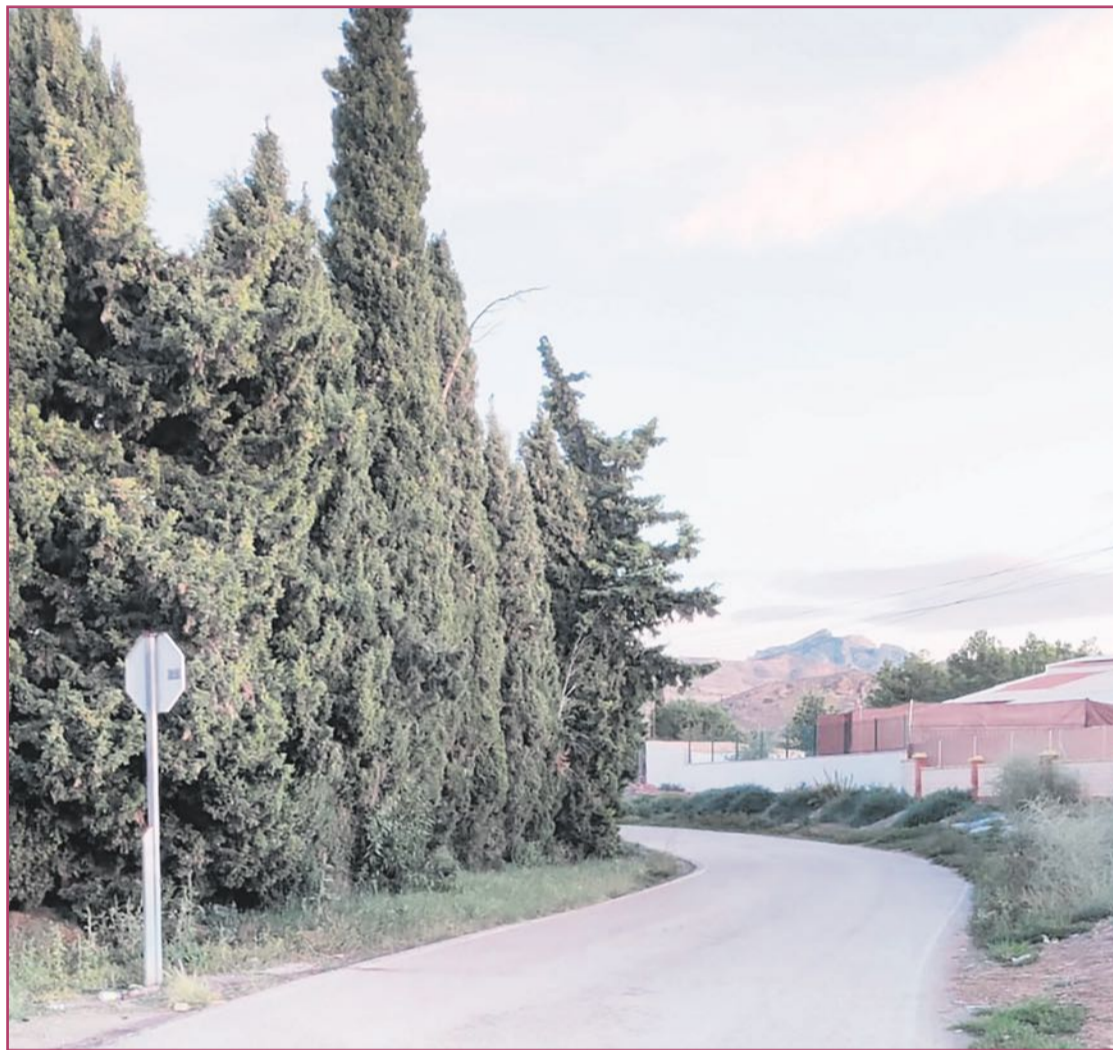
Tramo del Camí de Montnegre sin alumbrado público ni arcén.

Además en este tramo tampoco hay arcén para viandantes. Por tanto la única manera de