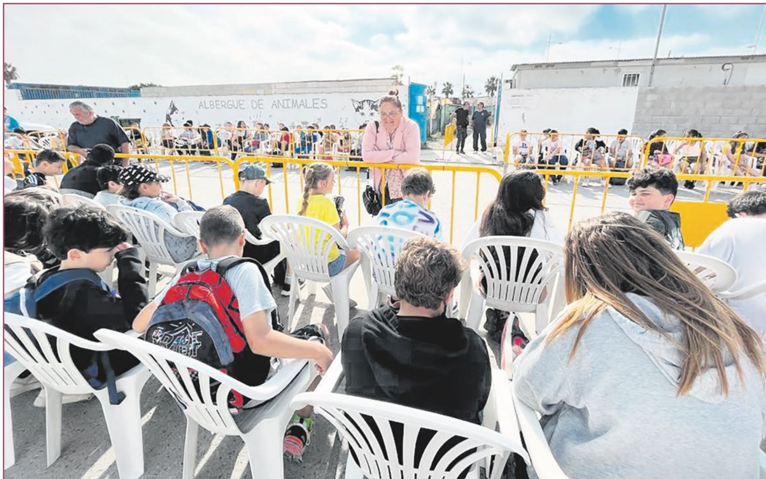
Escolares visitando el Albergue Municipal de Animales.

“Estamos trabajando mucho para que el chorlito se recupere en nuestros parques, igual