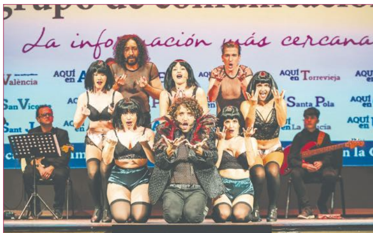
Compañía Teatro Musical de España.

tenemos en marcha planes de emergencia".