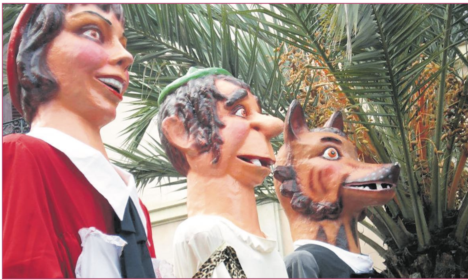
Los protagonistas de la obra de Pedro Antonio Albaladejo.

En esta obra, la historia que sucede es una de tantas que se repiten en Torreveja. Es fácil identificarse con cualquiera de los personajes que, a su vez, son arquetipos de nuestra ciudad que podemos encontrar en diferentes estatuas.