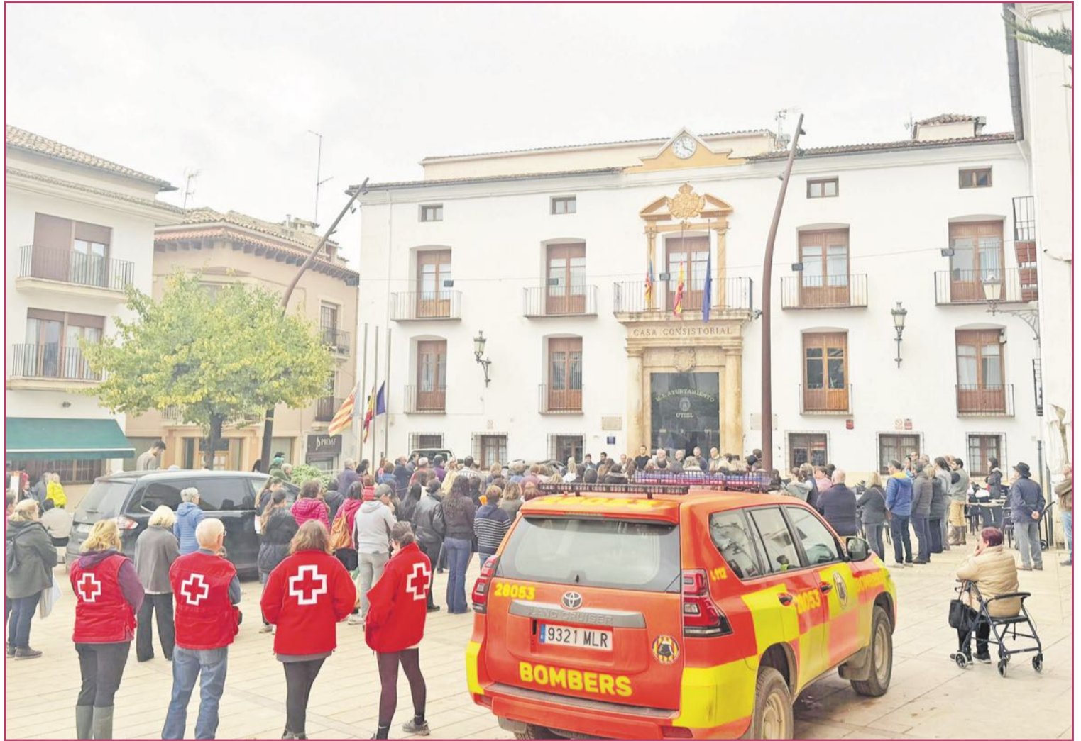
Fuerzas de protección civil participan en el minuto de silencio por las víctimas ante el Ayuntamiento de Utiel (5 de noviembre).

En cambio en un nivel 3 no hace falta todo este procedimiento. Si el sargento de la UME dice que faltan motobombas, se comunica directamente con el Ministerio. Es mucho más ágil porque se pueden