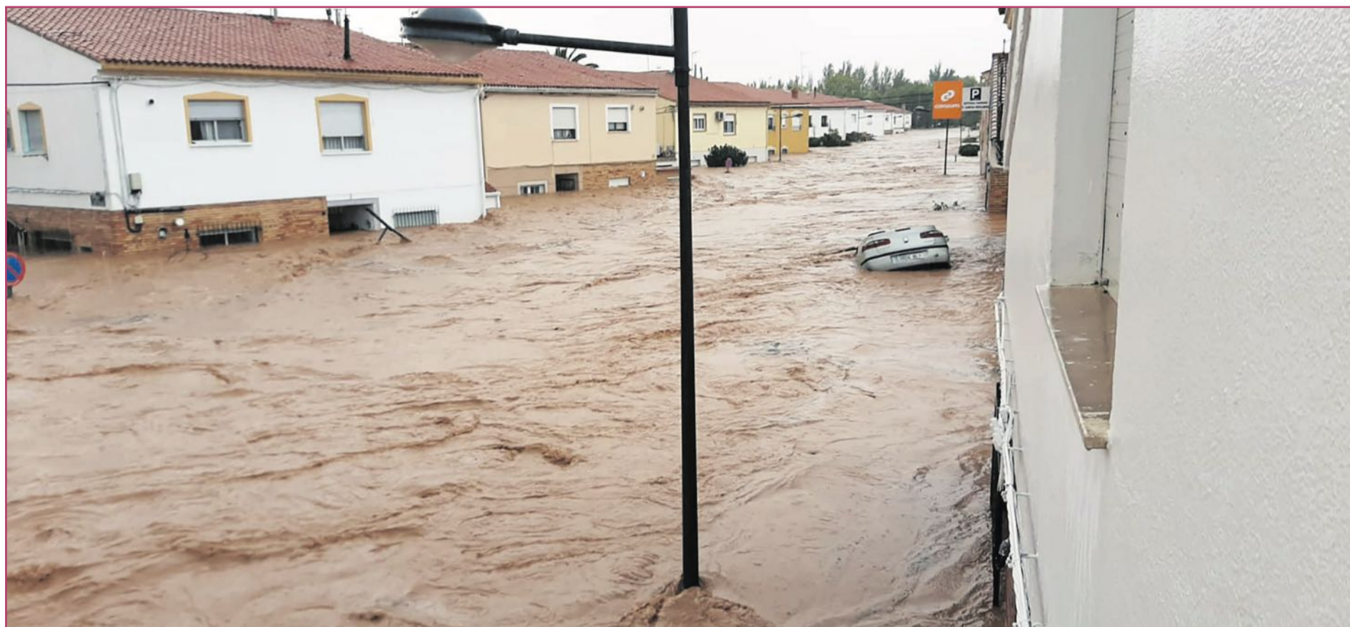
Imágenes de Utiel el 29 de octubre.

Tres testimonios relatan el sufrimiento provocado por la DANA que asoló Utiel el 29-O