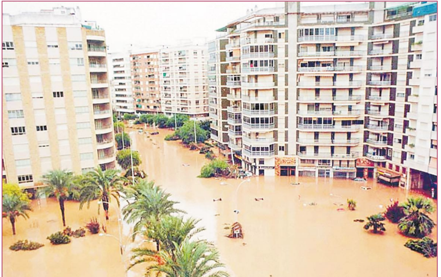
Alzira inundada tras la Pantanada de Tous en 1982.

En 1589 y 1590 Valencia sufrió dos gotas frías en años consecutivos. Los innumerables destrozos provocados llevaron a que, por fin, las autoridades políticas se convencieran de la necesidad de construir infraestructuras hi-