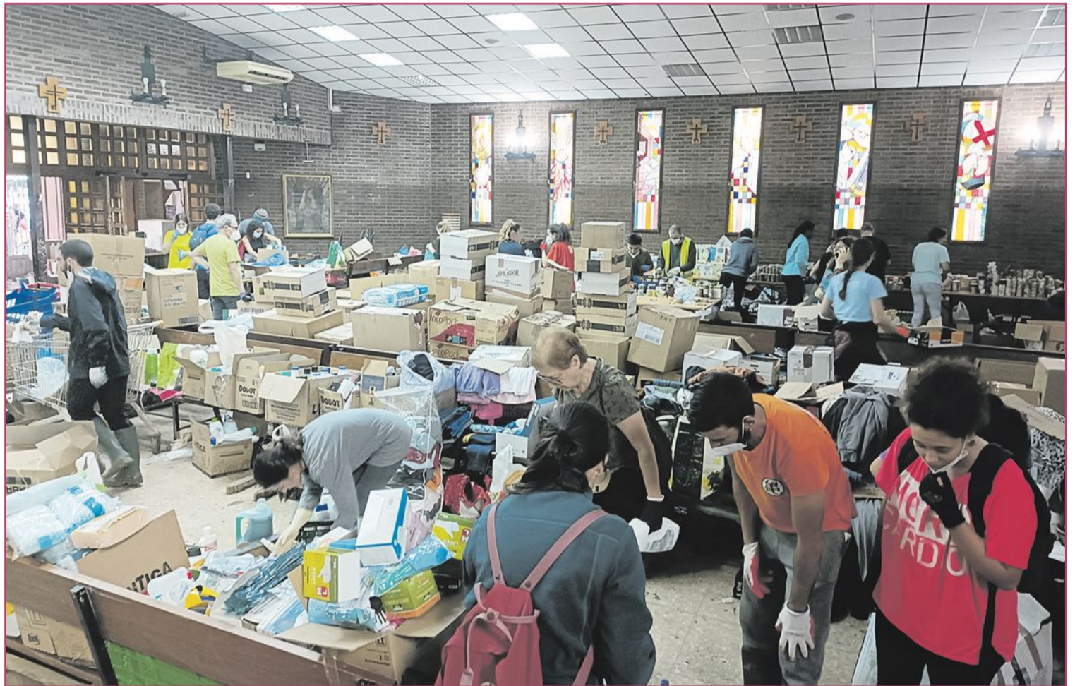
Uno de los muchos sitios que se convirtieron en improvisados puntos de reparto de comida, en este caso en Catarroja.

La noticia corrió de boca en boca. No hubo convocatorias oficiales ni llamamientos masivos