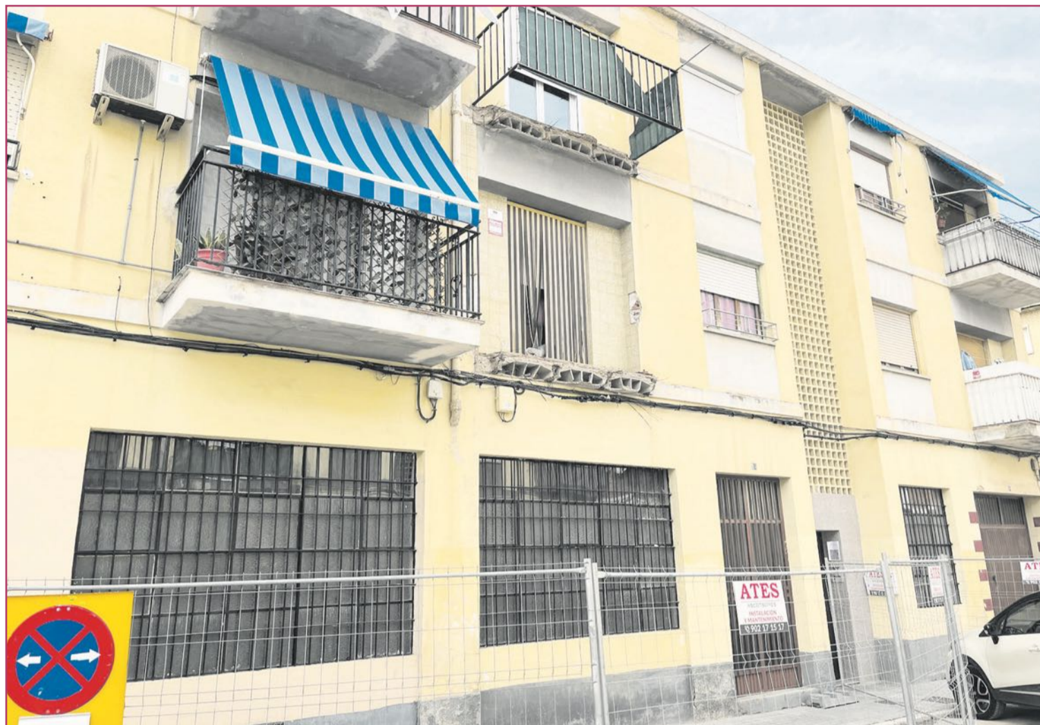
Imagen del piso que ha sufrido el desprendimiento de los dos balcones.

Los problemas de algunos edificios llevaron al ayuntamiento a poner el proyecto en "reestudio", ante la preocupación de que iniciar las excavaciones en las calles