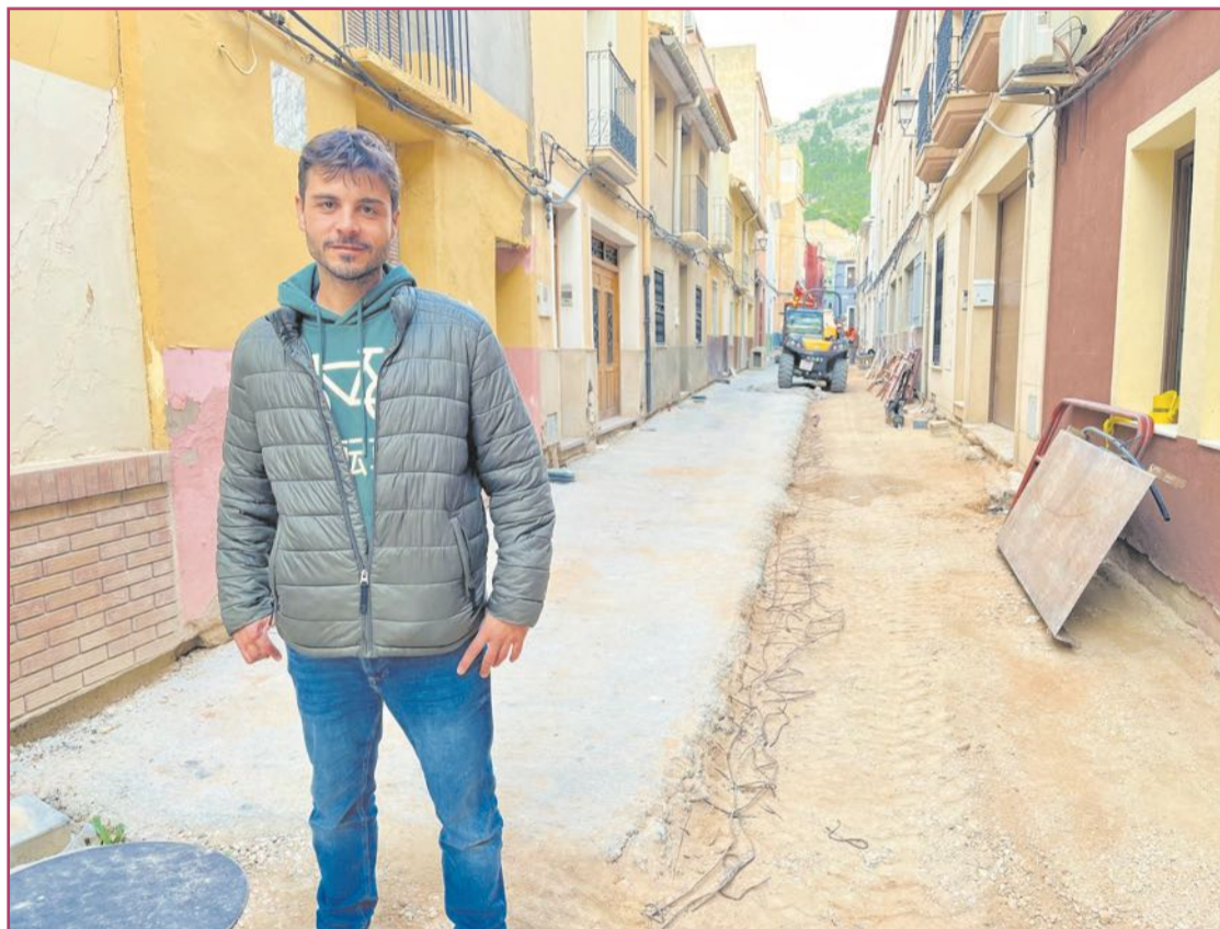
Obras en el entorno de San Antón que propiciaron el descubrimiento arqueológico.

«Hemos realizado una excavación documentando más de setenta metros de trazado de muralla en cremallera»