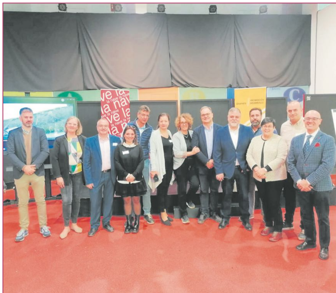
Foto de grupo de los representantes europeos de EcoCore durante su visita a Villena.

Las ciudades españolas Urbact se reunieron en el Espacio Joven para avanzar en los planes de acción