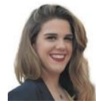
Alba Berenguer CORRECCIÓN DE TEXTOS