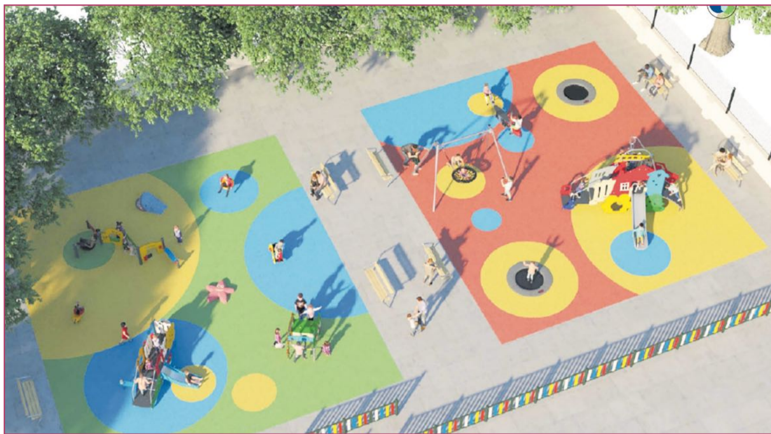
Recreación del futuro Jávea Park en el Arenal.

Yo misma cuando compré mi casa en el municipio tuve que pagar esta acometida. Los constructores trasladan este gasto al comprador. Y esto afecta incluso a los antiguos propietarios que, por el motivo que sea, tengan que dar de alta otra vez el servicio.