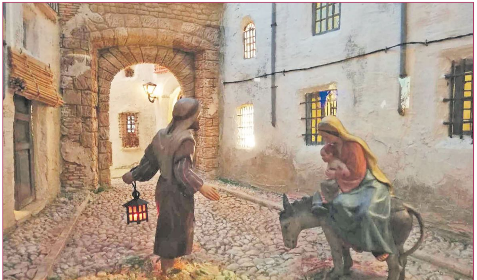
Los belenes confeccionados por las asociaciones no dejan de tener sus ambientaciones localistas | Turisme Comunitat Valenciana

Por supuesto, el Nacimiento, el pesebre, y que no se nos olviden los pastorcitos, los animalillos (cabras, gallinas, ocas, ovejas). Todas las figuras (el 'caganer', los Reyes Magos, la Sagrada Familia...). ¡Y la nieve, dónde está el corcho para la nieve! La moda (no anglosajona, sino centroeuropea) del árbol navideño, reducido ahora a un recortable pegado con fixo, antaño competía con los disfrutes de, literalmente, montar el Belén y luego ir a ver otros, a la calle.