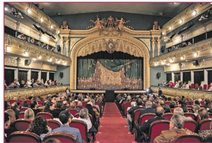
El teatro, antes de comenzar el espectáculo, con un lleno total.

La gala de AQUÍ grupo de comunicación, AQUÍ y ÚNICOS, reunió en el Gran Teatro de Elche a políticos, empresarios y un gran número de invitados que llenaron por completo las más de 700 plazas del espectacular lugar.