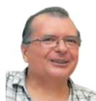
Fernando Abad PROVINCIA