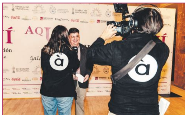
La gala fue retransmitida en directo y despertó el interés de muchos medios de comunicación.