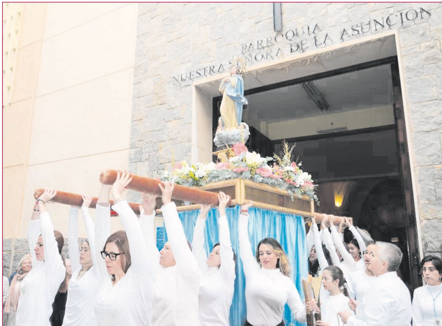
La Virgen de Loreto llegó aquí para quedarse, y este hecho se conmemora todos los años en diciembre | Ayuntamiento de Santa Pola

En la pedanía alteana (posible origen de la localidad) las celebraciones en honor a Bár-