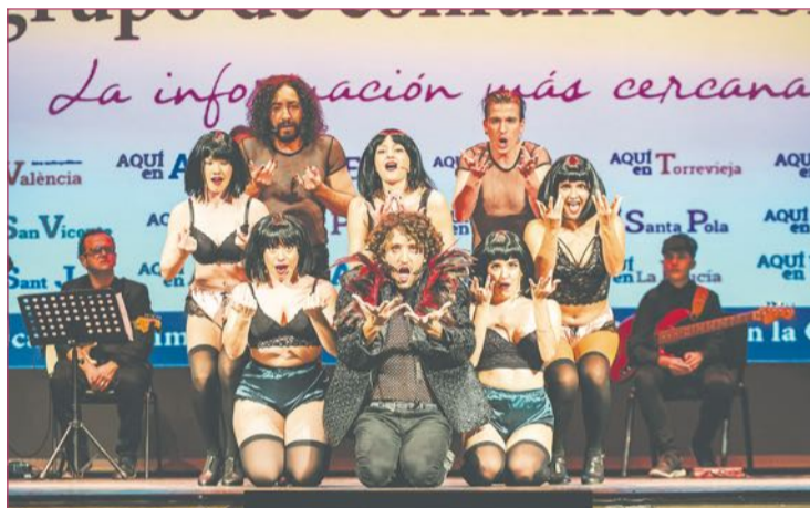
Compañía Teatro Musical de España.