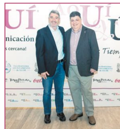
Pepe Vegara, alcalde de Orihuela.