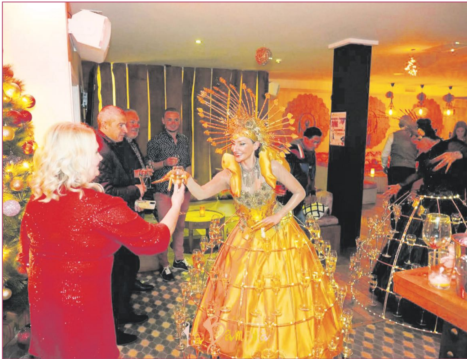
La buena experiencia de cada fin de año genera que la mayoría de los clientes repitan cada Nochevieja.

Otro de los grandes favoritos es Bohemians, situado en un enclave privilegiado con vistas impresionantes hacia la bahía de Xàbia. Este local no solo deleita con una cocina cuidadosamente elaborada, sino que también ofrece momentos únicos para despedir el año de una manera memorable. Las sorpresas están a la orden del día, desde actua-