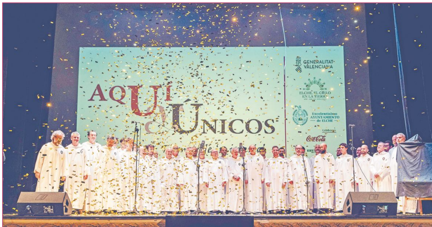
Actuación de los cantores del Misteri en la gala homenaje de AQUÍ grupo de comunicación.

Fue una hora y media con espectáculos de música, humor y mentalismo que tuvieron como colofón una última actuación muy especial. Cincuenta cantores ilicitanos tomaron el escenario, ante la atenta mirada de los espectadores que llenaron el teatro, para interpretar una de las emblemáticas piezas de este drama sacro-lírico reconocido por la UNESCO como Patrimonio de la Humanidad.