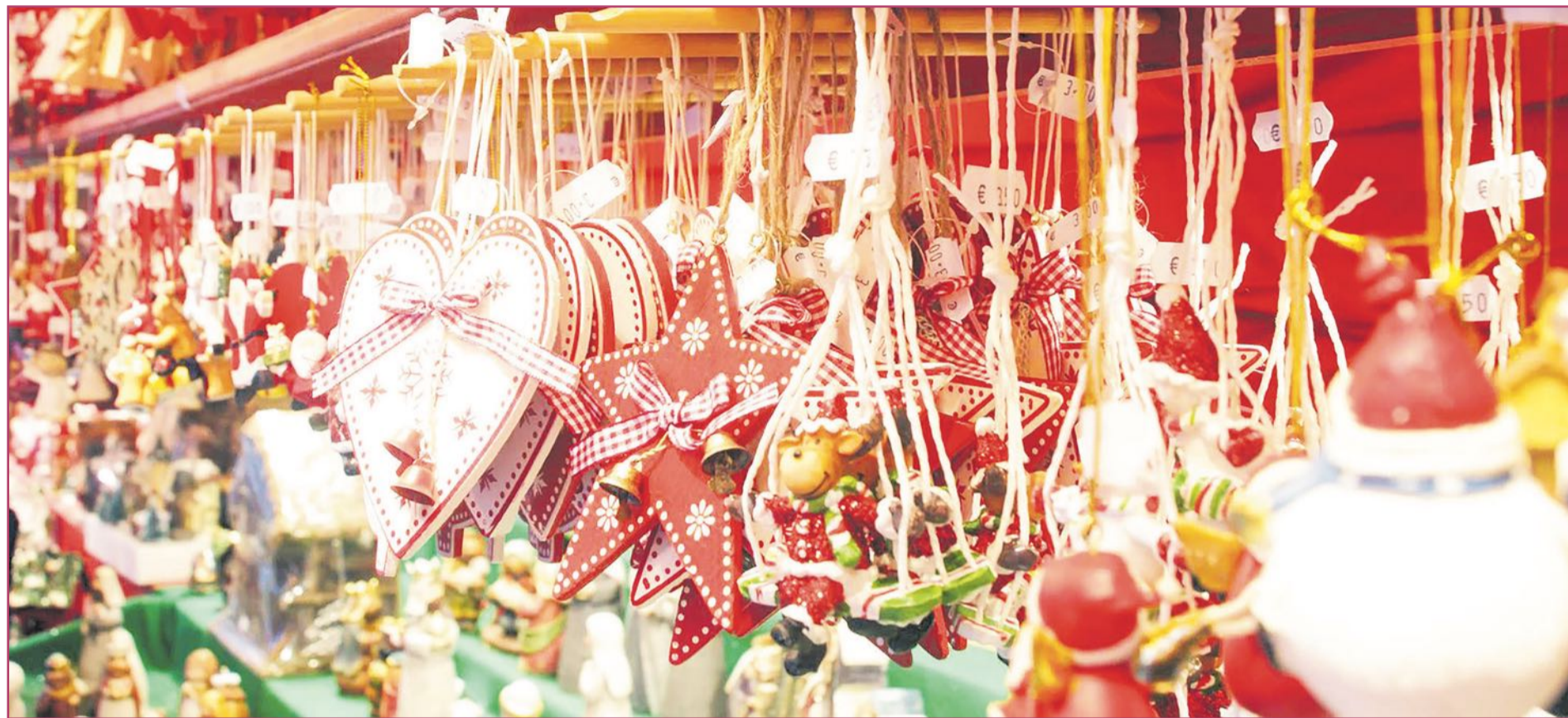
La industria de la Comunitat Valenciana se ha dedicado también a la producción de complementos navideños | Turisme Comunitat Valenciana

Las industrias jugueteras y otras en la Comunitat Valenciana se han impuesto también en la fabricación de complementos navideños