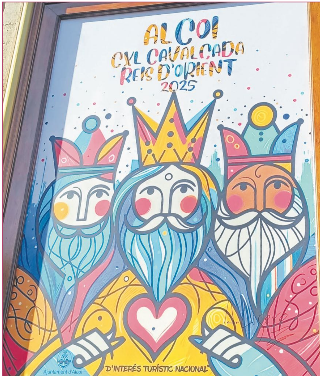
Cartel de la Cabalgata de Reyes 2025

Su punto de partida es el mismo que en el pasado año, es decir la plaza de España. Desde allí sube hacia San Lorenzo y hace una parada en el parque del Parterre, orientada sobre todo a los niños para explicarles como es la Navidad en Alcoy mediante diversos juegos. Desde allí realiza la clásica vuelta a los puentes para regresar de nuevo al centro de la ciudad. Normalmente tarda una media