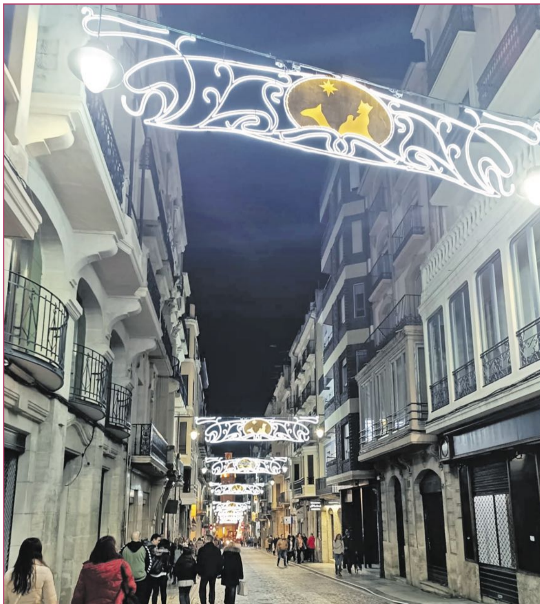
Calle San Nicolás

«En la Nochevieja matinal repartiremos doce aceitunas rellenas de anchoa»