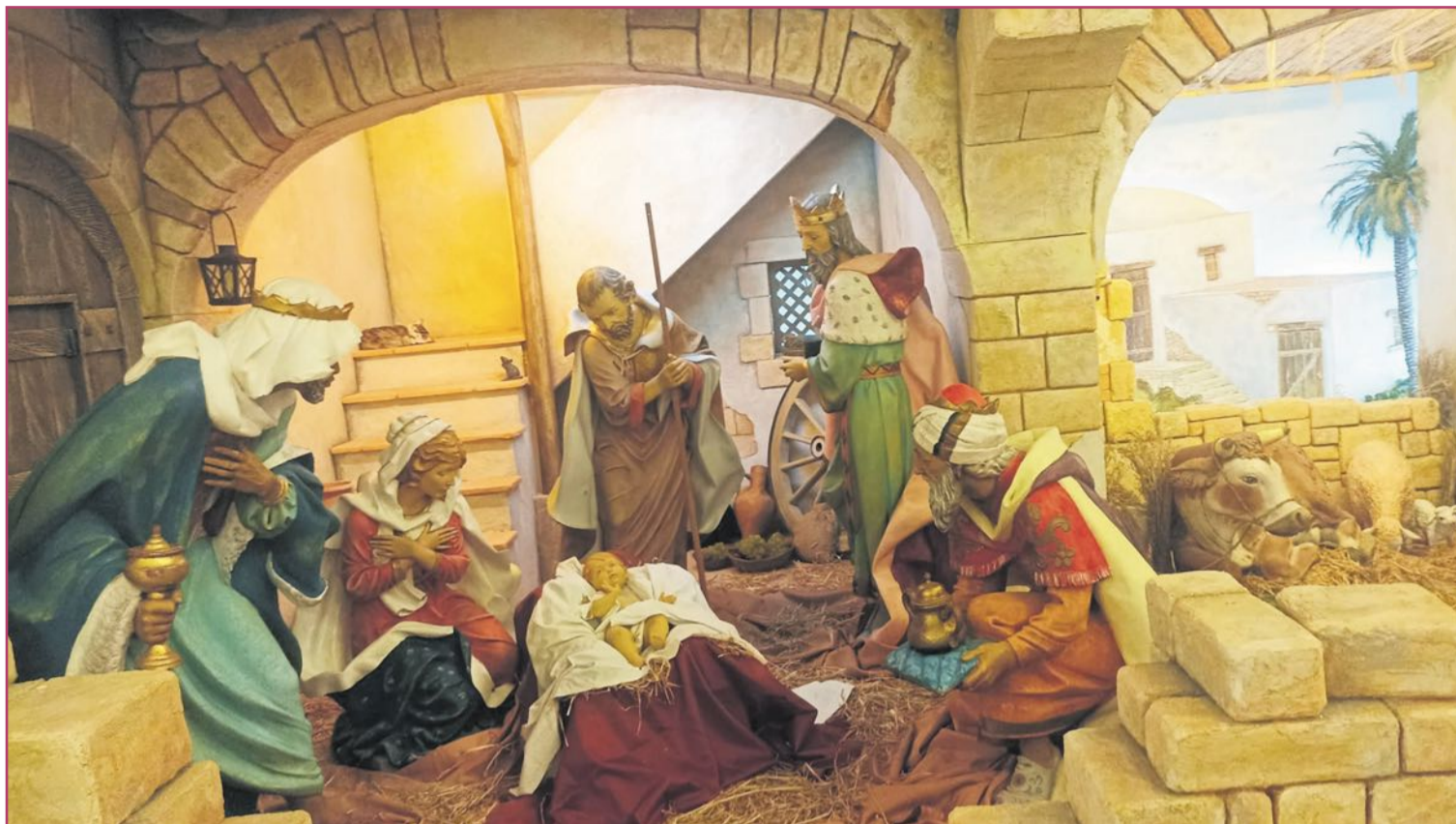
El belén ubicado en el Espacio Séneca.

En la parte central de la sala encontramos seis escenas seguidas mostradas en forma de semicírculo. Estas representaciones forman parte de un mis-