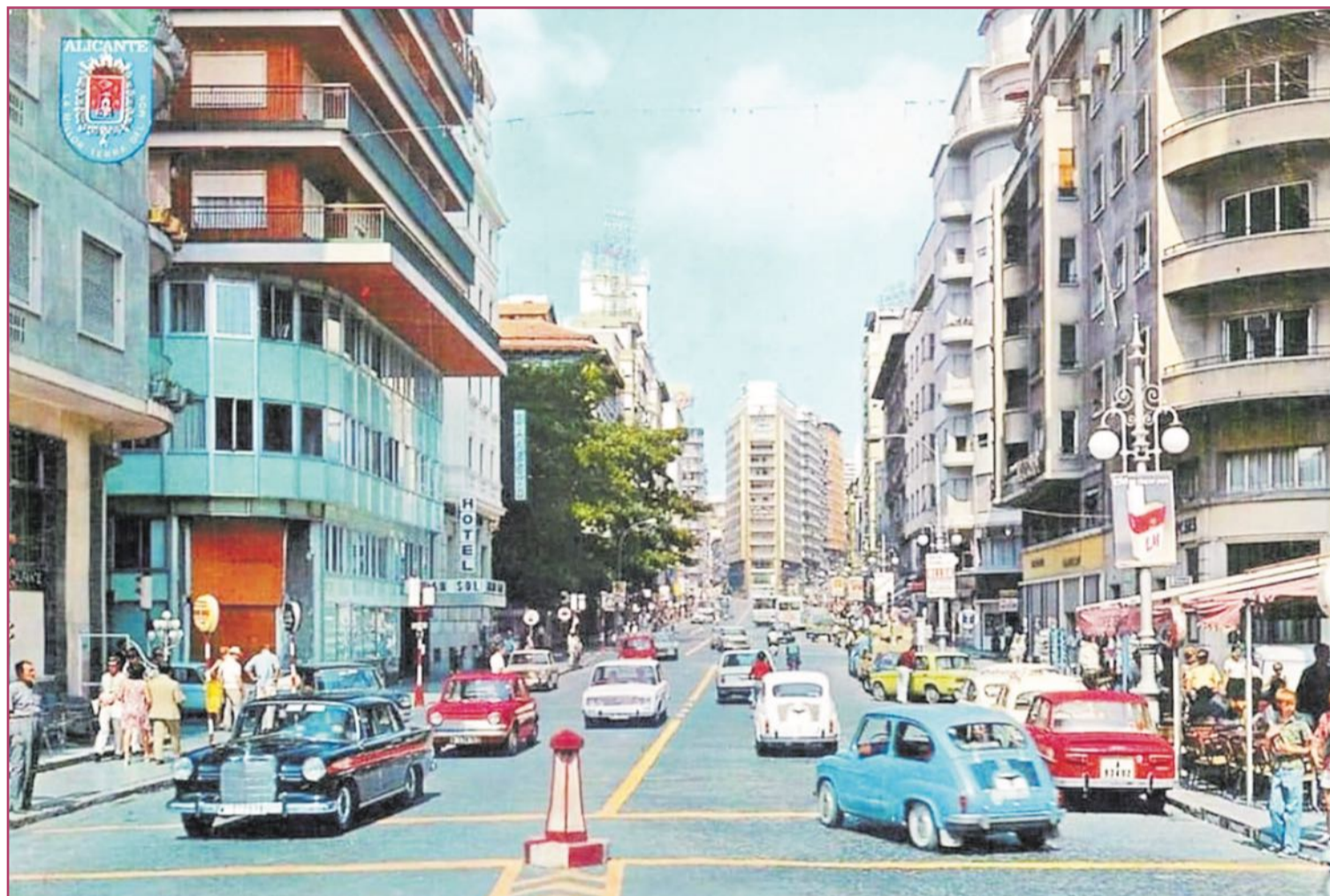
Aunque parezca que no en esta postal, una mirada más detenida nos devuelve una Alicante muy distinta de la actual.

Una Alicante navideña y postnavideña atestada de tráfico. Con autobuses, porque el tranvía nos había abandonado en noviembre de 1969. Ese mismo año, las estadísticas nos hablaban de 14.354 vehículos matriculados (11.120 turismos, 66 ómnibus, o sea autobuses, más 2.422 camiones, 731 motocicletas y 15 tractores). Sí, eran datos provinciales, pero en una ciudad, la alicantina, con