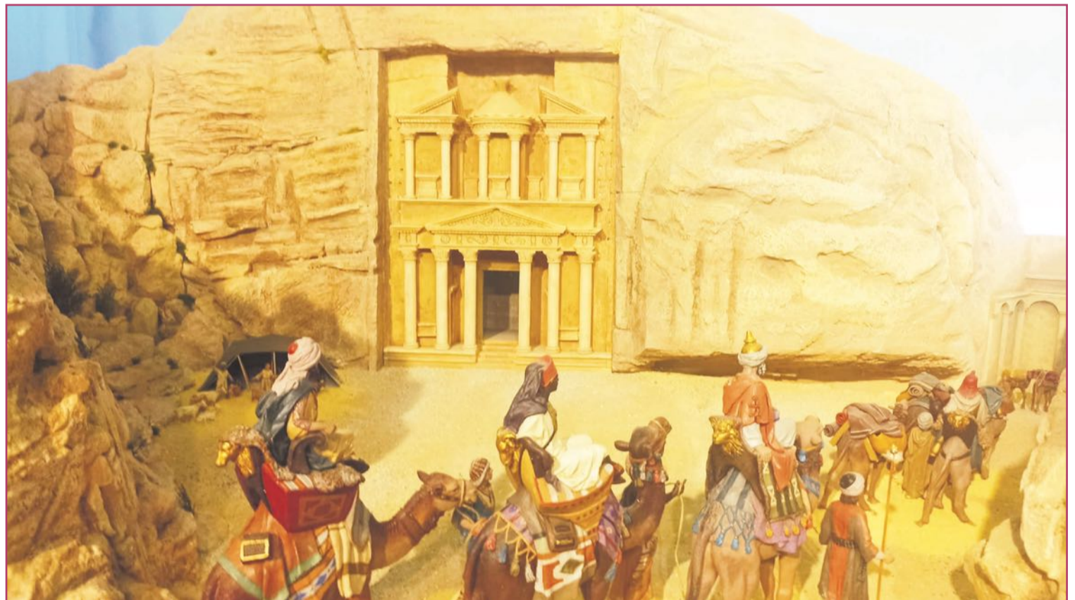
Recreación de Petra en una de las escenas de la Diputación.

Este imprevisto cambio de ubicación casualmente ha coincidido con una ruptura bastante grande del formato de peque-