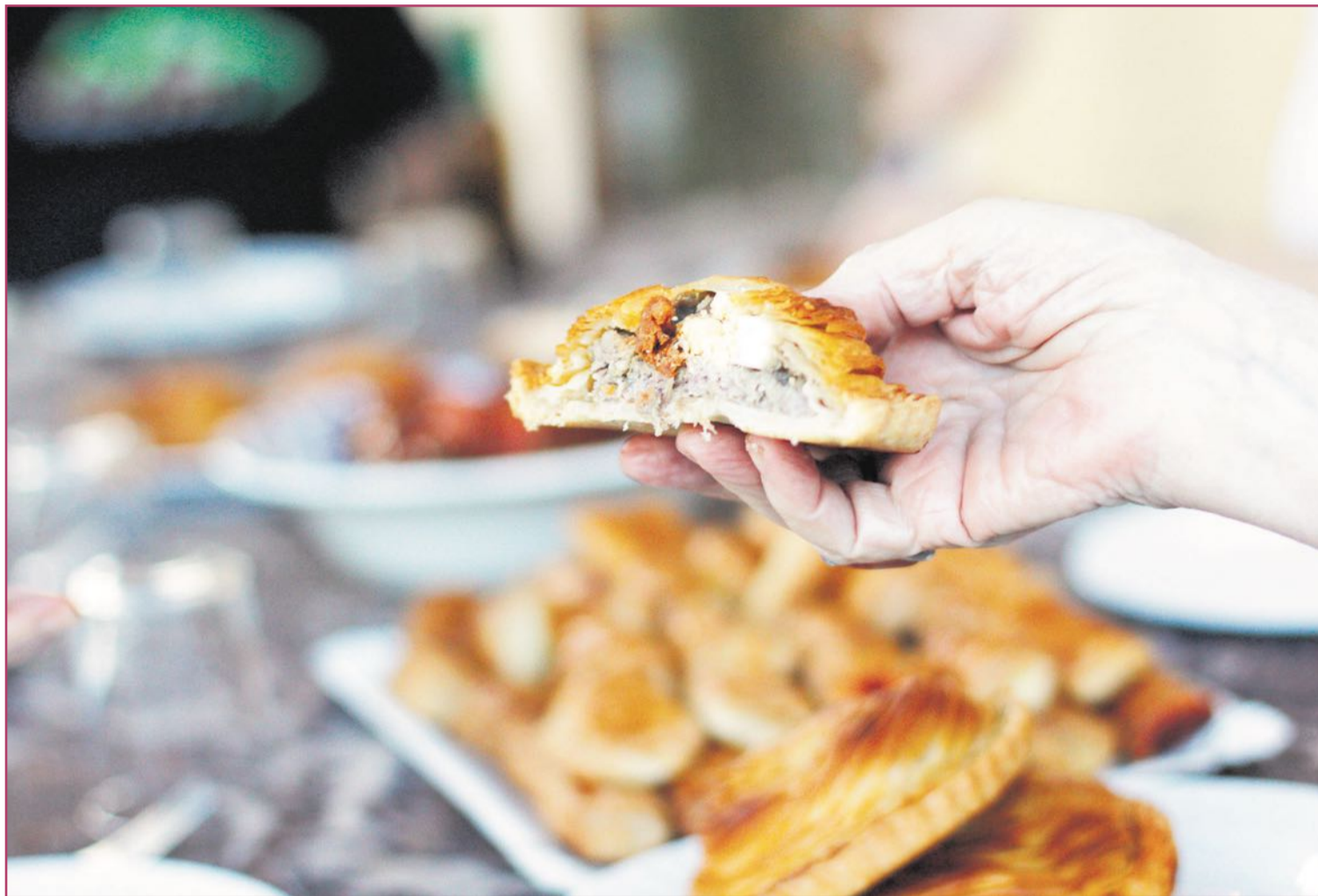
El pastel de carne, además de típico murciano, también lo es oriolano | nesimo

La cercanía, ya se sabe. Hemos comenzado por el postre, tomémosnos ahora un poco de aperitivo histórico. Es obvio que la contigüidad con Murcia y la de esta con la hoy Castilla-La Mancha han hecho mucho. Más cuando, por ejemplo, la ahora manchega Albacete fue murciana prácticamente desde tiempos de la Reconquista española (722-1492), aunque como provincia no nacería oficialmente