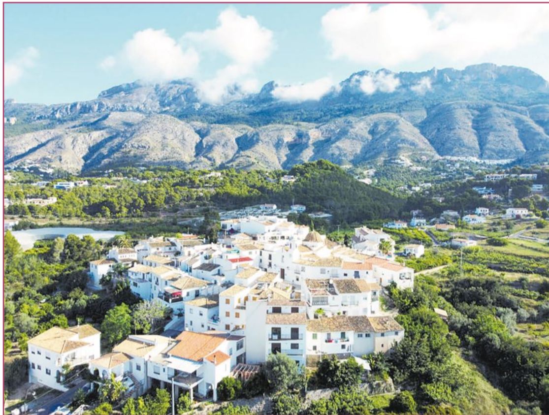
Altea La Vella debe de ver solucionado su abastecimiento de agua.

Mientras que desde el gobierno se defiende que, pese a las subidas, Altea se mantiene