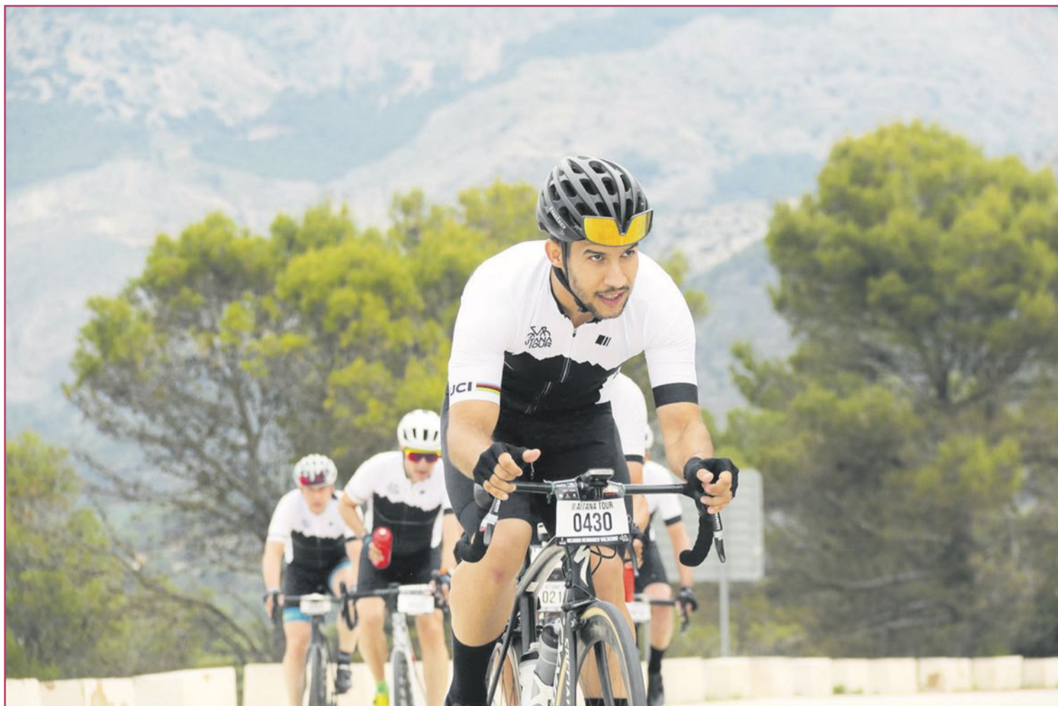
Las proximidades de Altea son ideales para la práctica del ciclismo.

Los aficionados que pedaleen en estas fechas por Altea lo harán acompañados de muchos profesionales