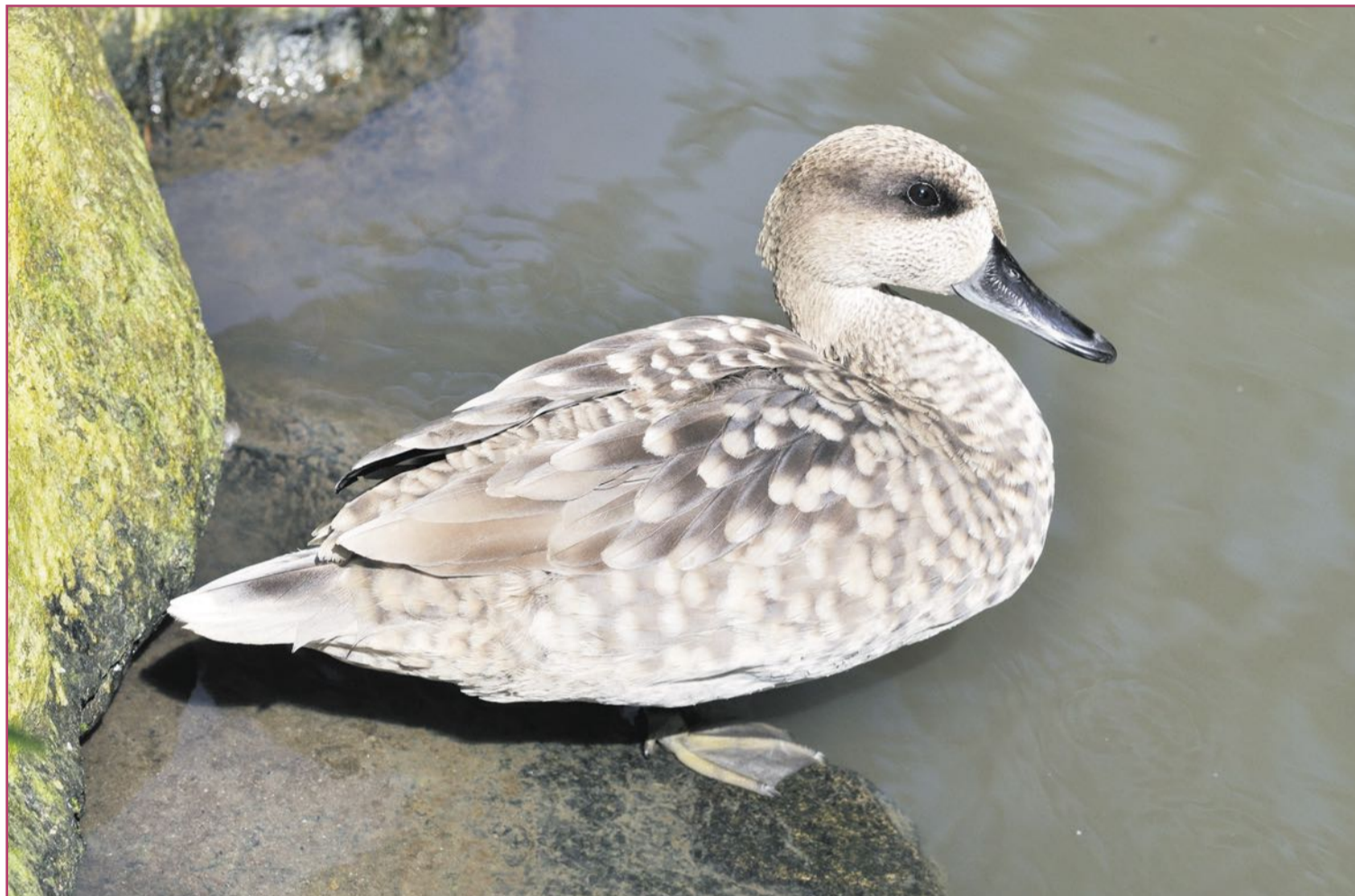
La cerceta pardilla, por desgracia, ya no visita tanto nuestros muchos humedales

Extinciones localizadas se han dado muchas, algunas fa-