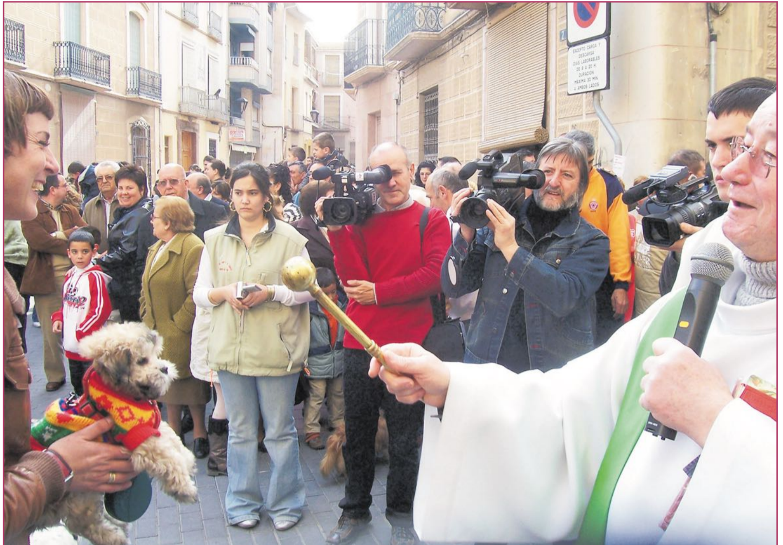
La bendición de los animales, como esta en Aspe (Vinalopó Medio), protagoniza parte de los eneros en estas tierras

De nuevo, las sociedades agrarias y pescadoras daban gracias, por lo obtenido, y pedían, por lo sembrado este mes, porque el mar continuara siendo generoso. De los Reyes Magos, con sus cabalgatas, autos (obras musicales) sacramentales y hasta danzas antiquísimas, como las Danses de Reis, en Tibi (Foia u Hoya de Castalla), se ha hablado en extenso desde estas páginas. Pasemos las páginas navideñas y veamos nuestro mundo a partir del día después.