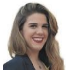
Alba Berenguer CORRECCIÓN DE TEXTOS