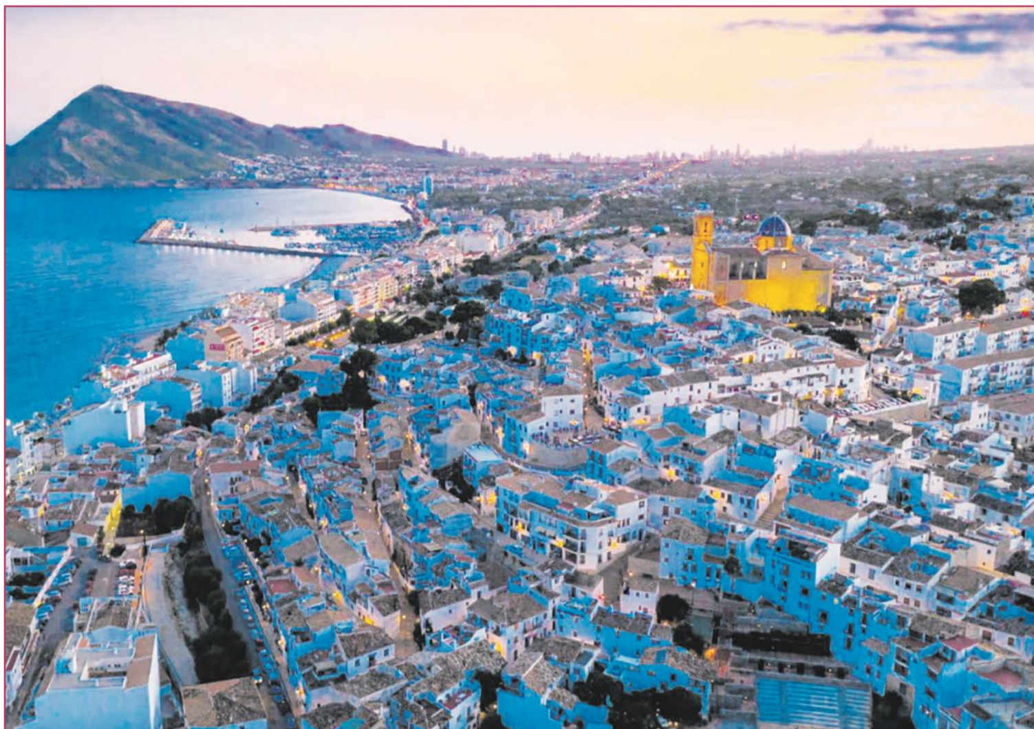
Altea es uno de los municipios con los precios más elevados.

La otra gran pata del banco inmobiliario, el alquiler, tampoco parece en estos momentos una opción por la que decantarse. En la Marina Baixa, como en tantos otros destinos turísticos, muchos propietarios han visto en ese uso una forma de sacar más beneficio por sus propiedades, y eso ha provocado que cada vez haya menos casas en el mercado residencial y, por lo tanto, que también esos precios se hayan disparado.