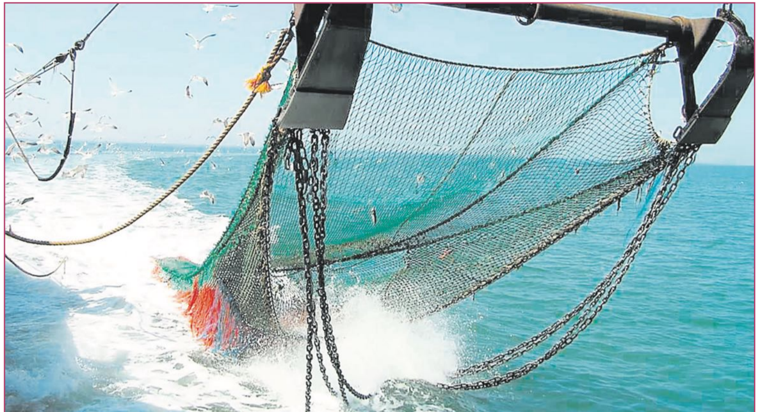
Los buques deberán ahora adaptar sus mallas.

Todo acabó decidiéndose en Bruselas como, y nunca deja de ser sorprendente, se deciden estas cosas en la capital comunitaria: a altas horas de la ma-