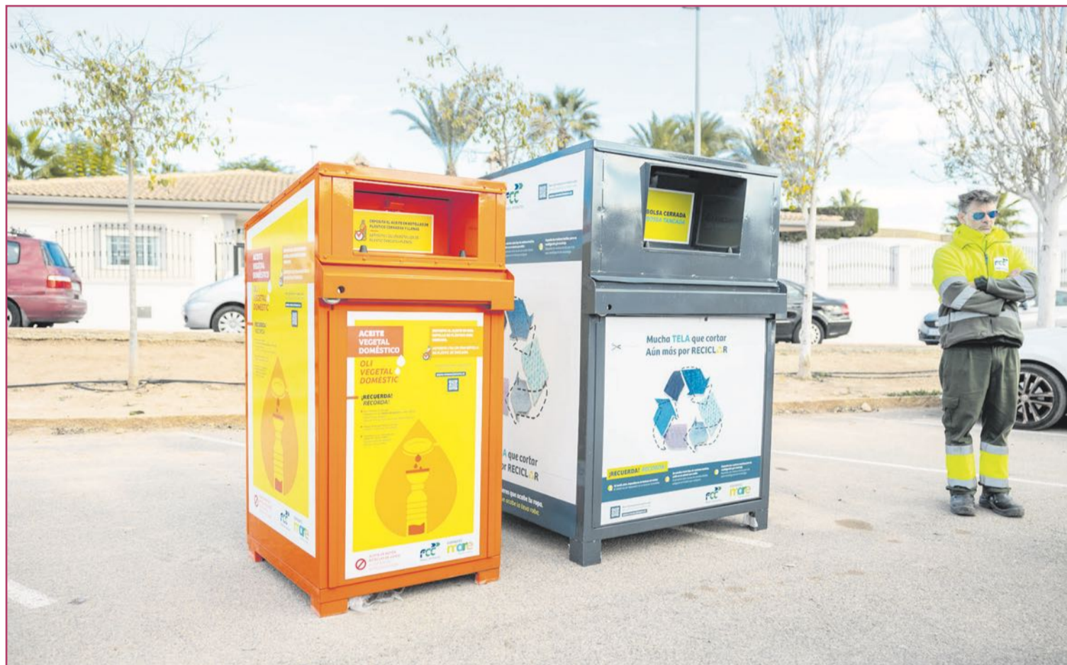
Los esfuerzos se centran ahora en el aceite y el textil.