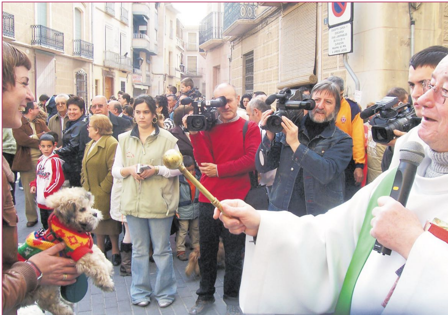
La bendición de los animales, como esta en Aspe (Vinalopó Medio), protagoniza parte de los eneros en estas tierras

De nuevo, las sociedades agrarias y pescadoras daban gracias, por lo obtenido, y pedían, por lo sembrado este mes, porque el mar continuara siendo generoso. De los Reyes Magos, con sus cabalgatas, autos (obras musicales) sacramentales y hasta danzas antiquísimas, como las Danses de Reis, en Tibi (Foia u Hoya de Castalla), se ha hablado en extenso desde estas páginas. Pasemos las páginas navideñas y veamos nuestro mundo a partir del día después.