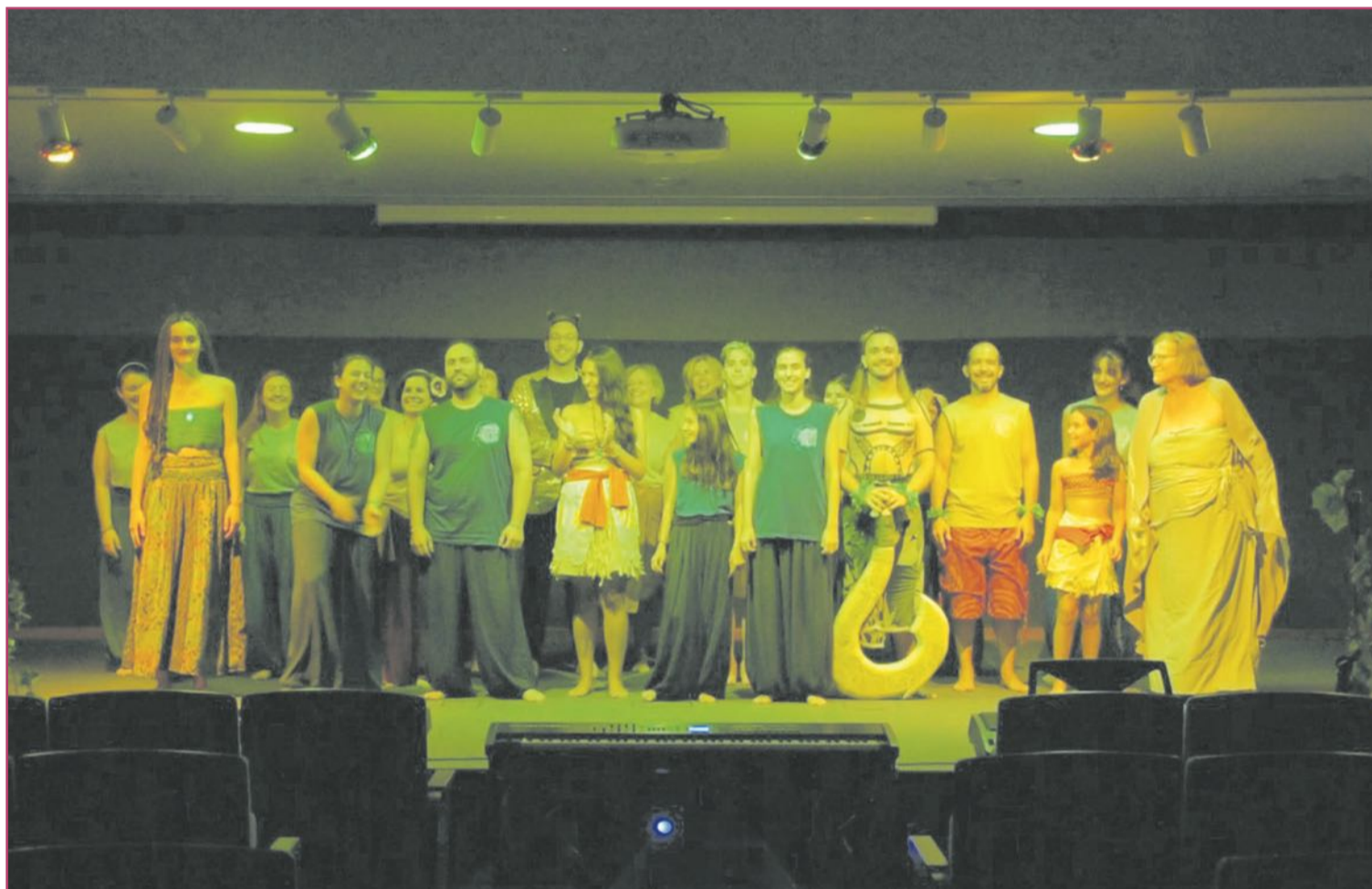
Asimetría en su vídeo-musical de 'Vaiana'.

«Tenemos un repertorio variado, cantamos desde música rock a música clásica o villancicos»