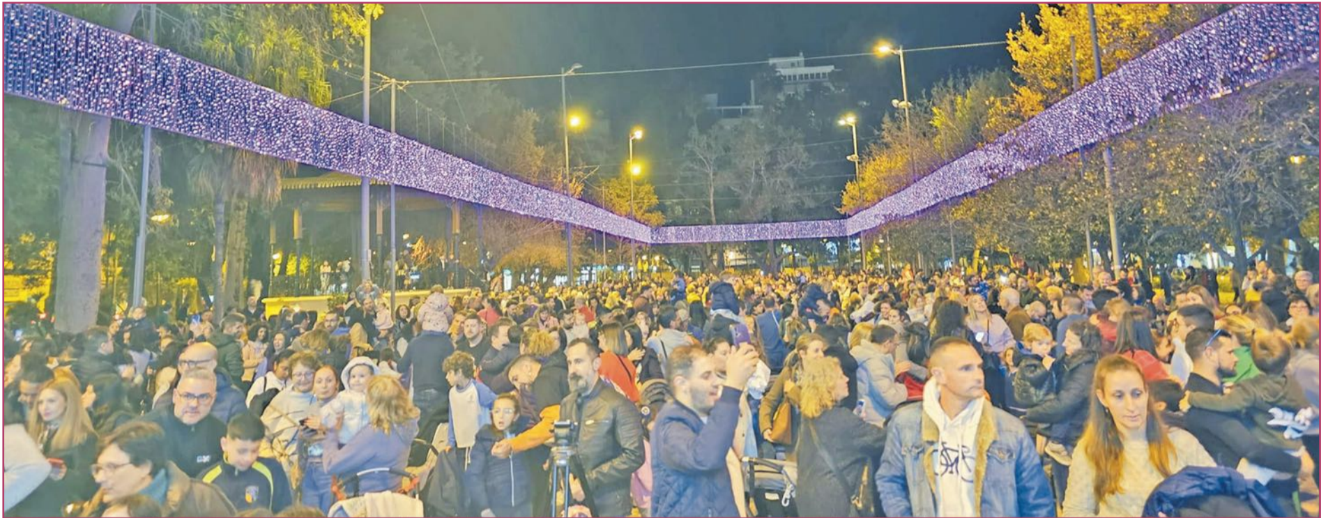
Encendido del alumbrado navideño en la Glorieta Gabriel Miró (5 de diciembre).

«Espero que todo el mundo venga a visitar el Belén municipal, la verdad es que ha quedado muy bonito»