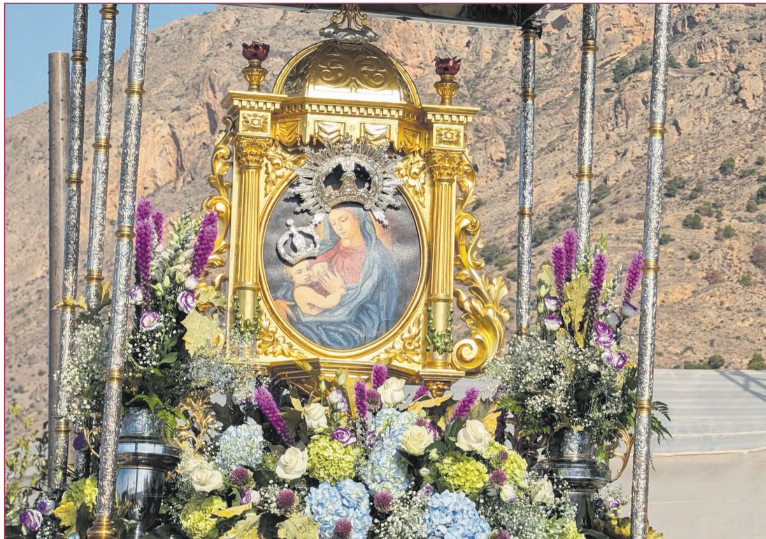
Nuestra Señora de Belén de La Aparecida en plena romería conmemorativa del hallazgo del lienzo | Parroquia Nuestra Señora de Belén

Lo del caudal roba almas enlaza con las mujeres atrapadas por el agua