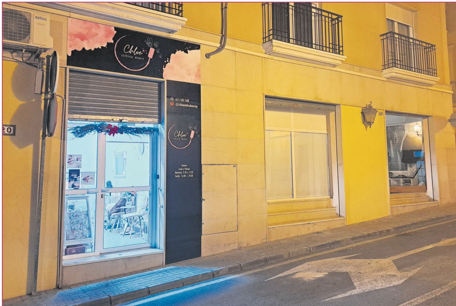
Dos de los cinco negocios que han recibido subvención municipal están en la calle San Vicente.

Vecina puerta con puerta del local de estética es Sara Gon-