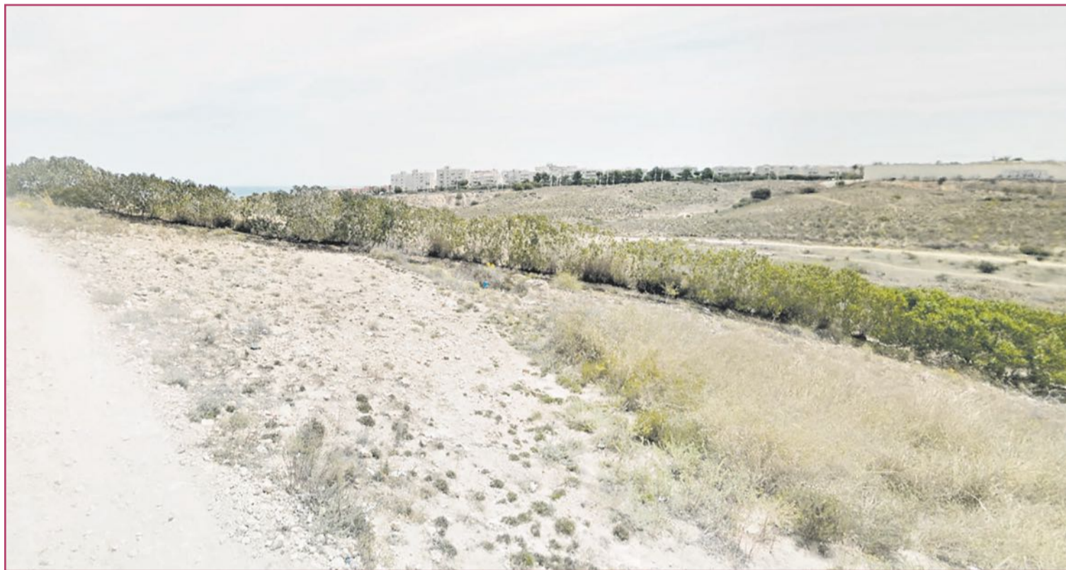
Zona de La Hoya.

"Tanto el Ayuntamiento como la Generalitat estamos de acuerdo en habilitar varios tipos de viviendas. Algunas serán de Protección Oficial y el resto estarán orientadas hacia un público joven menor de 35 años que tienen dificultades para emanciparse. Tendrán precios