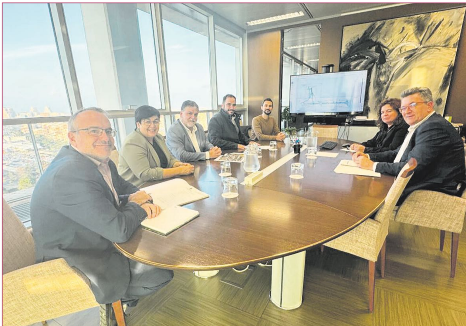
Reunión del alcalde de Villena y miembros del equipo de gobierno con el conseller de Infraestructuras Vicente Martínez.

Este proyecto ha sufrido importantes retrasos al inicio, provocados por la demora de casi dos años, por parte de Iberdrola, para desviar las torres de alta tensión por encima de la catenaria para salvar las vías, con el contrato y la licitación aprobados. A continuación, vino la pandemia provocada por la covid, y acto seguido la guerra de Ucrania, incidentes que multiplicaron el precio de las materias primas para la construcción.