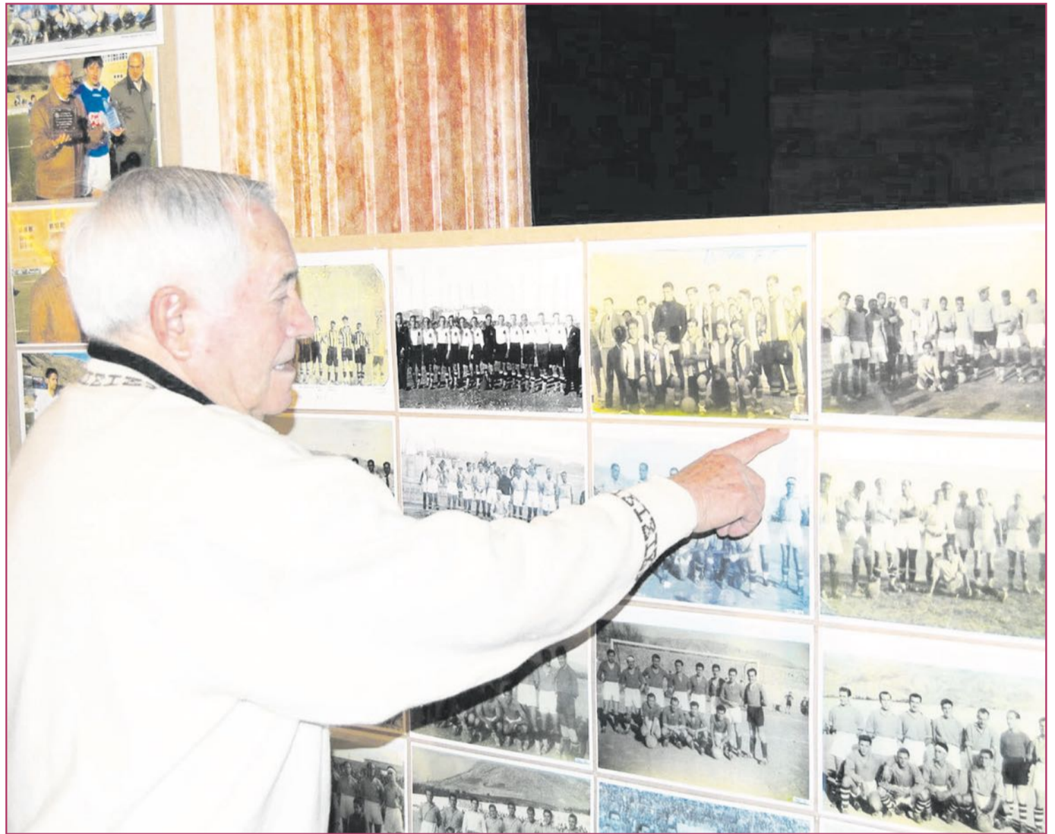
Exposición 'El fútbol mi pasión' celebrada en 2013 con 700 imágenes de su colección.

En el conjunto local destacaban nombres como Valero, Bonet, Cano o Wilson mientras que en el conjunto merengue, plagado de internacionales, hizo su