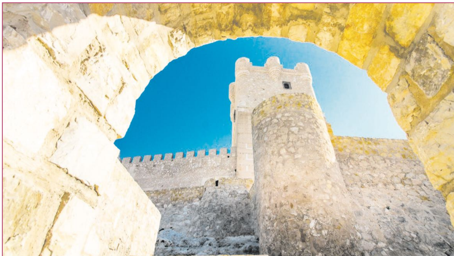
La importancia militar y económica, junto al apoyo a la corona, facilitaron la concesión de Carlos I en 1525.

La programación de actividades tendrá su presentación oficial en la inminente edición de FITUR 2025 que se celebra a finales de enero en Madrid. Un abanico de actuaciones para las que el Ayuntamiento ha destinado un presupuesto de 329.000 euros, al que habrá que sumar las posibles colaboraciones autonómicas y provinciales, con las que se organizarán actividades turísticas, concursos, congresos, actuaciones urbanas y actos culturales.