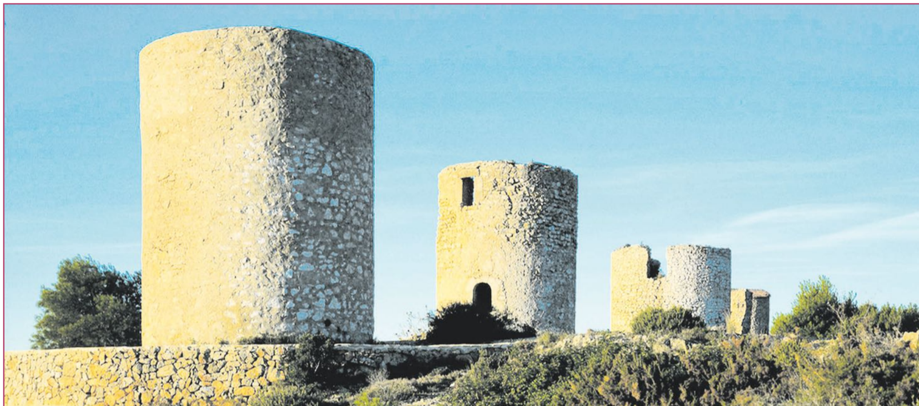
Pese a carecer de techados y aspas, la figura de los Molinos de la Plana aun resulta imponente

Los molinos de la Plana xabiera se han convertido en imponente testigo de un pasado harinero y un presente ya monumental