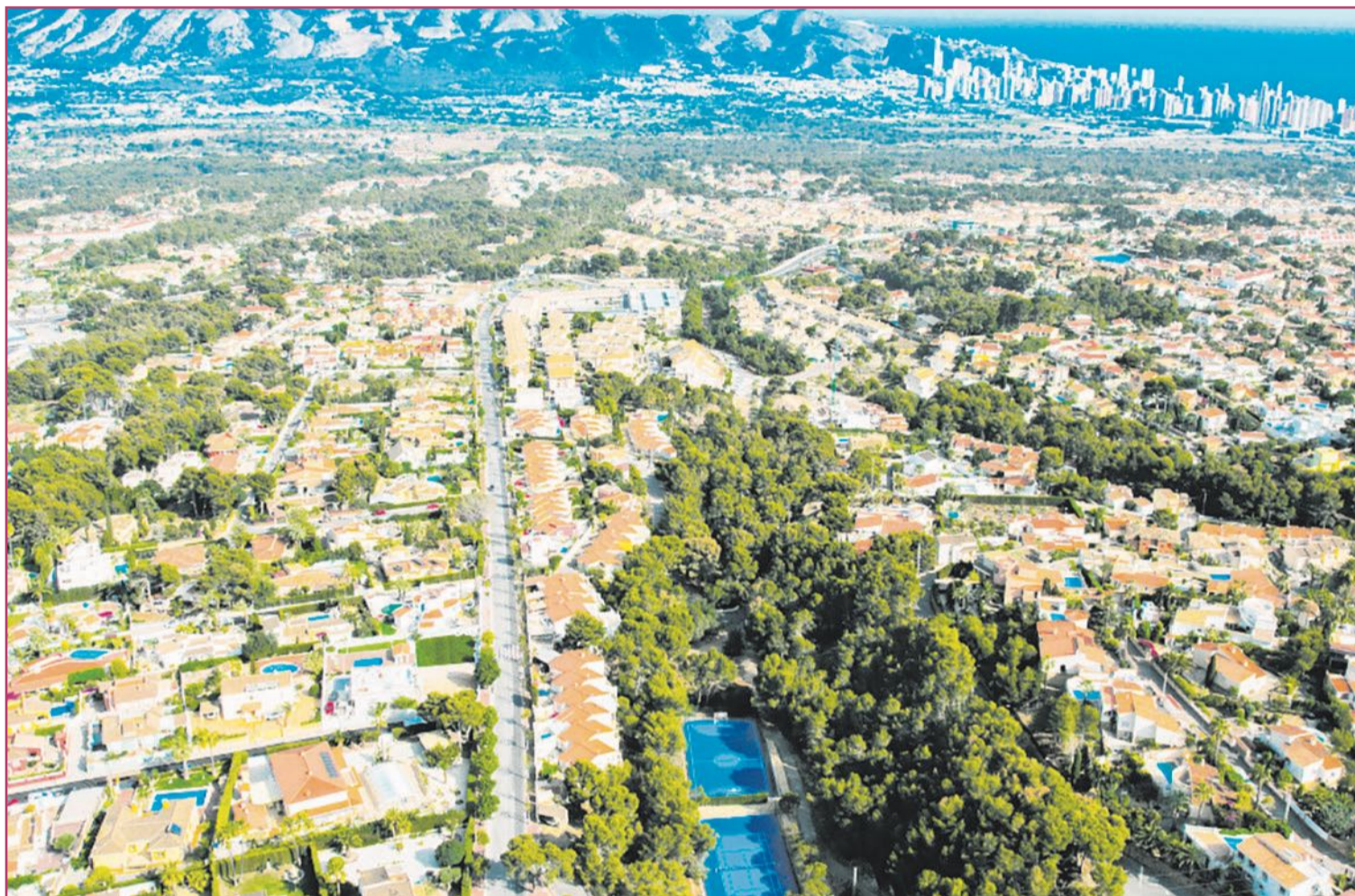
El precio de la vivienda en La Nucía se ha disparado en los últimos años.