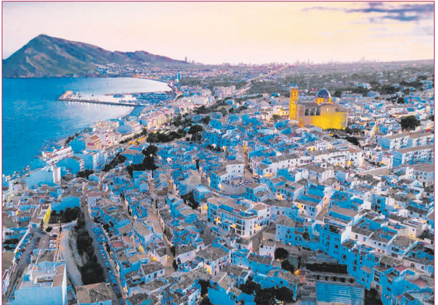
Altea es uno de los municipios con los precios más elevados.

La otra gran pata del banco inmobiliario, el alquiler, tampoco parece en estos momentos una opción por la que decantarse. En la Marina Baixa, como en tantos otros destinos turísticos, muchos propietarios han visto en ese uso una forma de sacar más beneficio por sus propiedades, y eso ha provocado que cada vez haya menos casas en el mercado residencial y, por lo tanto, que también esos precios se hayan disparado.