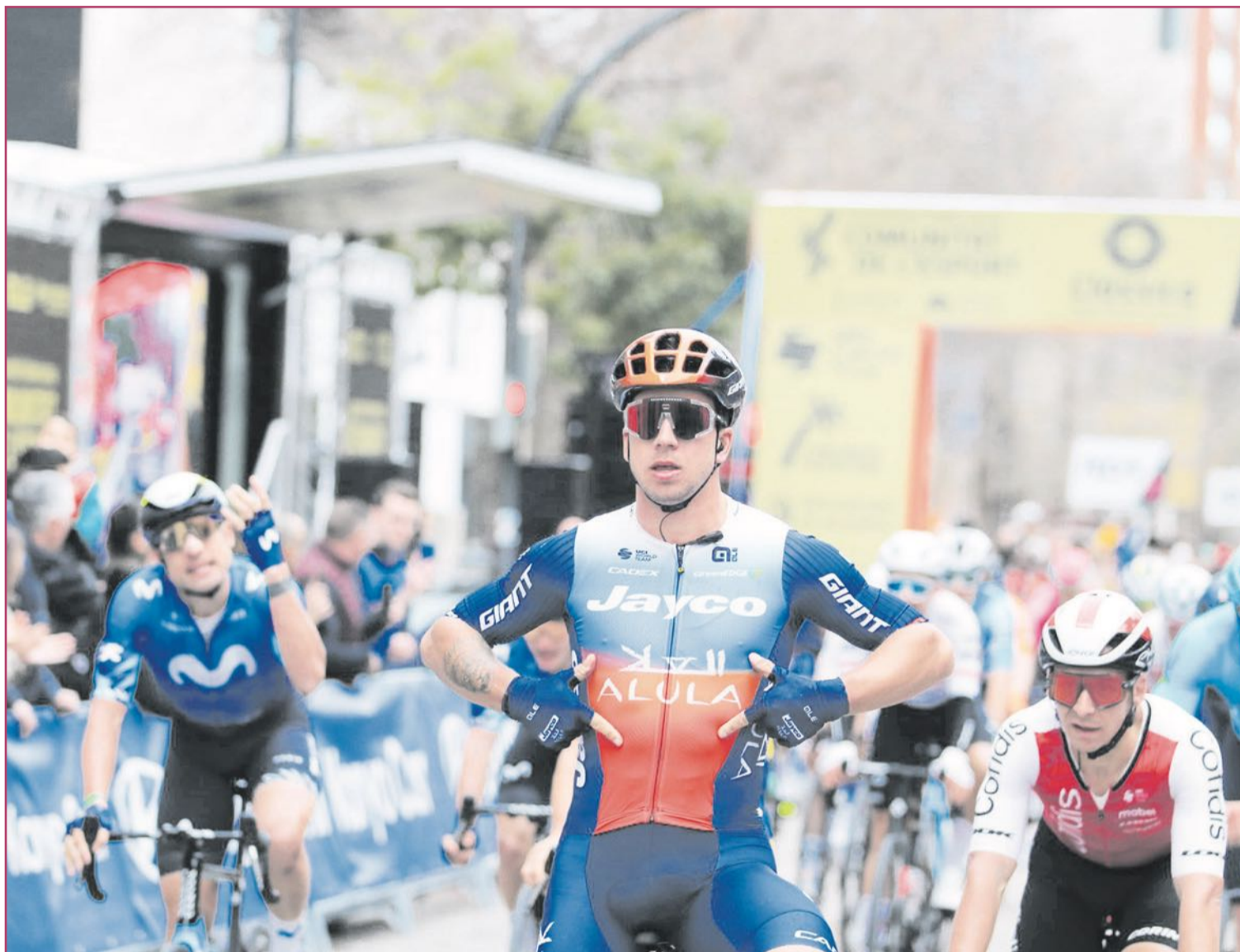
Imagen de Dylan Groenewegen, ganador el pasado año.

Dylan Groenewegen, ganador de seis etapas en el Tour, fue el vencedor en 2024