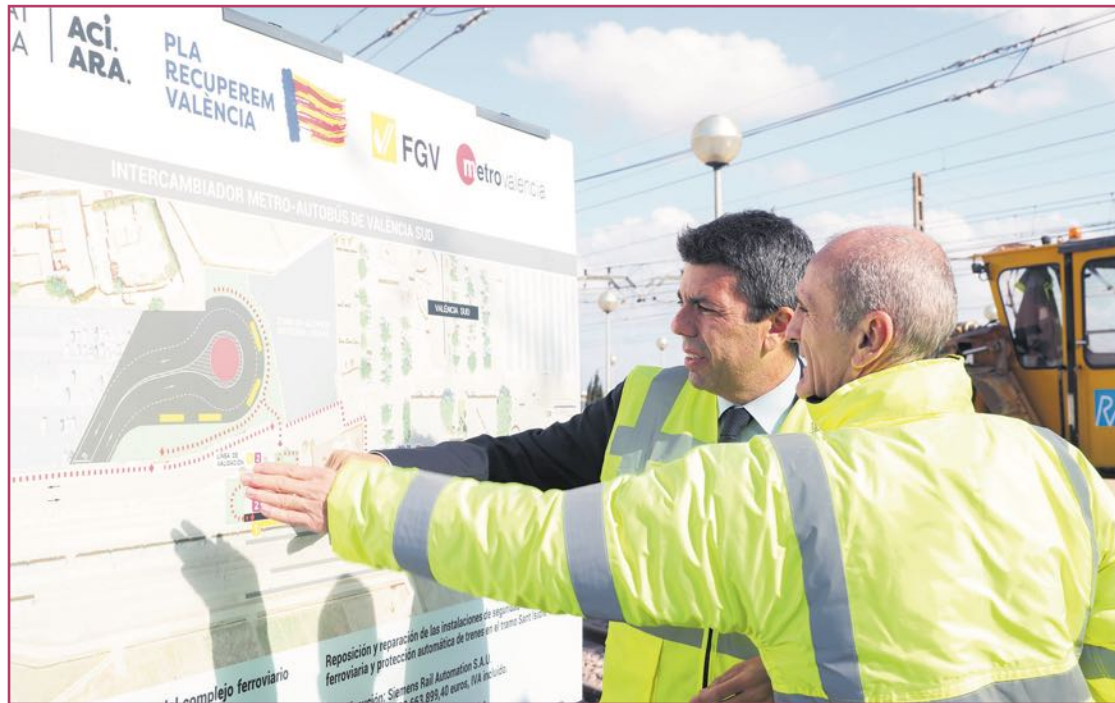
A mediados de febrero se recuperará la parada de Valencia Sud y se establecerá allí un nuevo intercambiador.

Desde la Generalitat exigimos al Gobierno que las lleve a cabo. No queremos buenas palabras y declaraciones, sino que