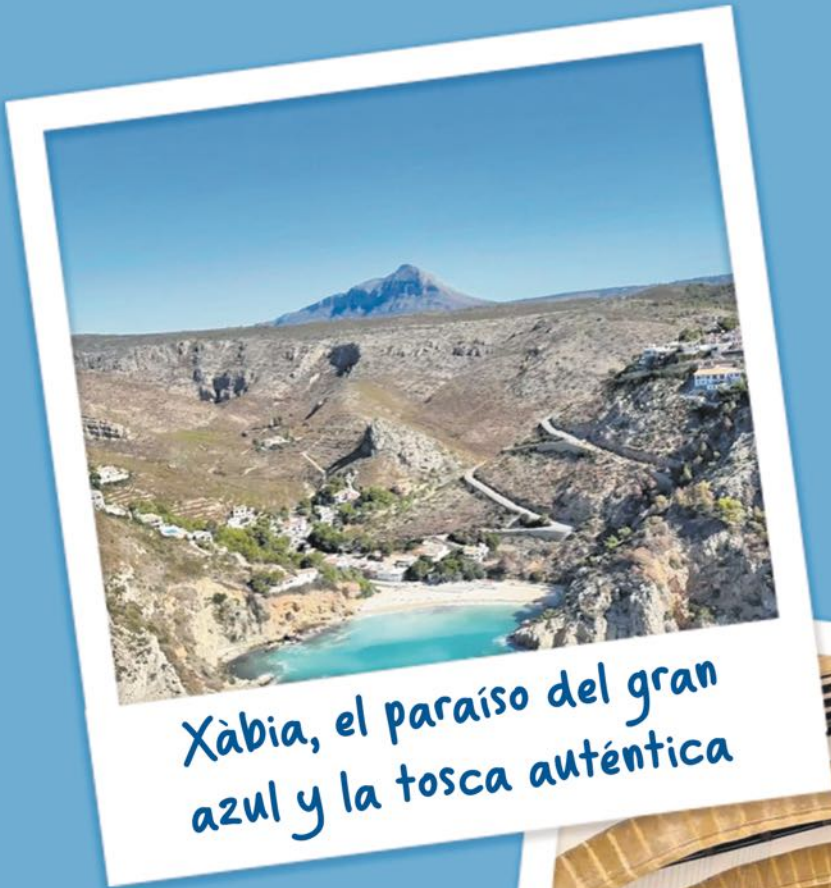
Xàbia, el paraíso del gran azul y la tosca auténtica