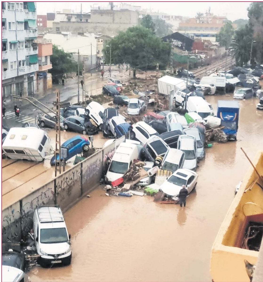
El entorno de las vías horas después de la riada.

Para Alcaide, la reconstrucción tras la catástrofe no debería