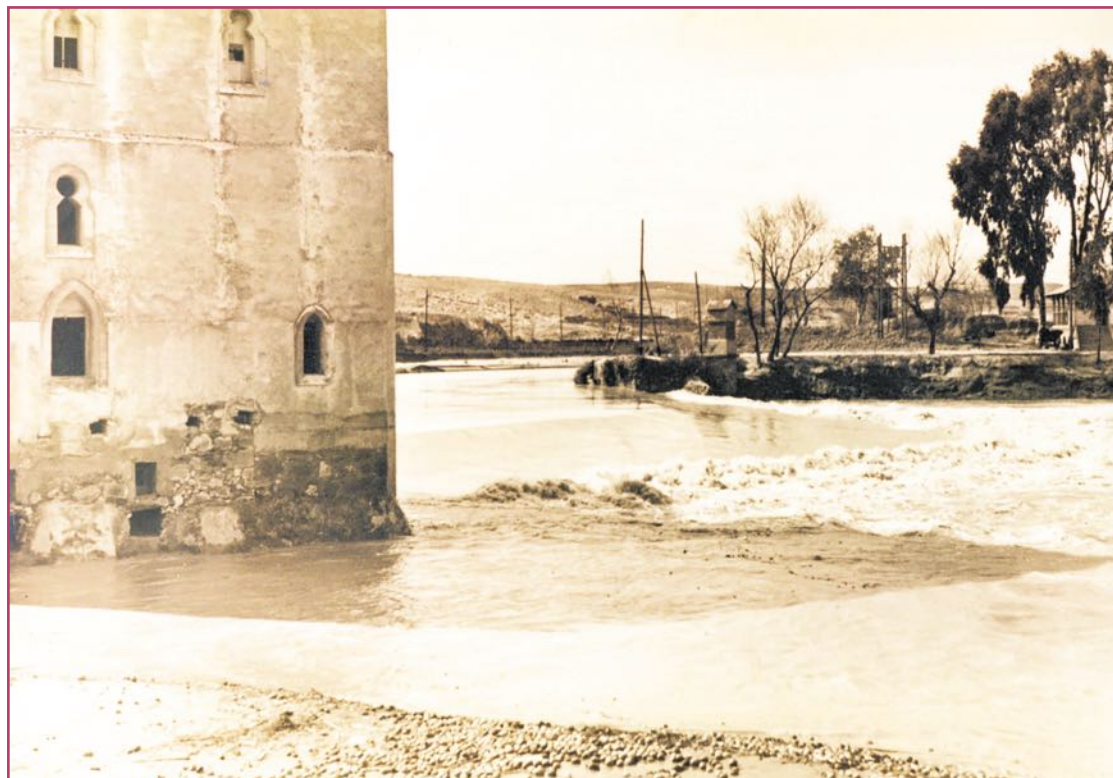
Molino de San Antonio en los años 40 del siglo pasado.

También se ubicará en el molino un pequeño mirador para las aves, e incluso se pretende habilitar este tramo antiguo del cauce del río para que las anguillas puedan volver a remontarlo