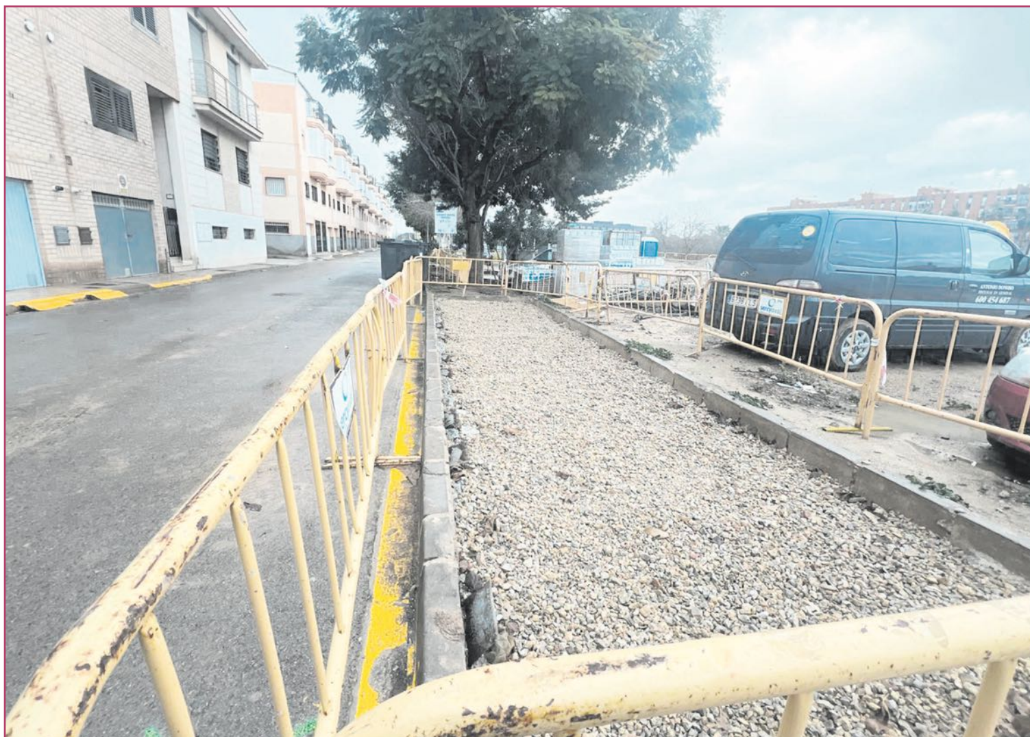
Los nuevos contenedores estarán en los espacios que ocupaban los soterrados o en lugares cercanos.

Por otra parte, resultan más seguros para el personal de limpieza, que no necesita manipular manualmente los contenedores para acoplarlos al vehículo. La accesibilidad para el vecino es, igualmente, un aspecto positivo, pues cuentan con tapas ergonómicas y bocas de vertido a una altura adecuada.